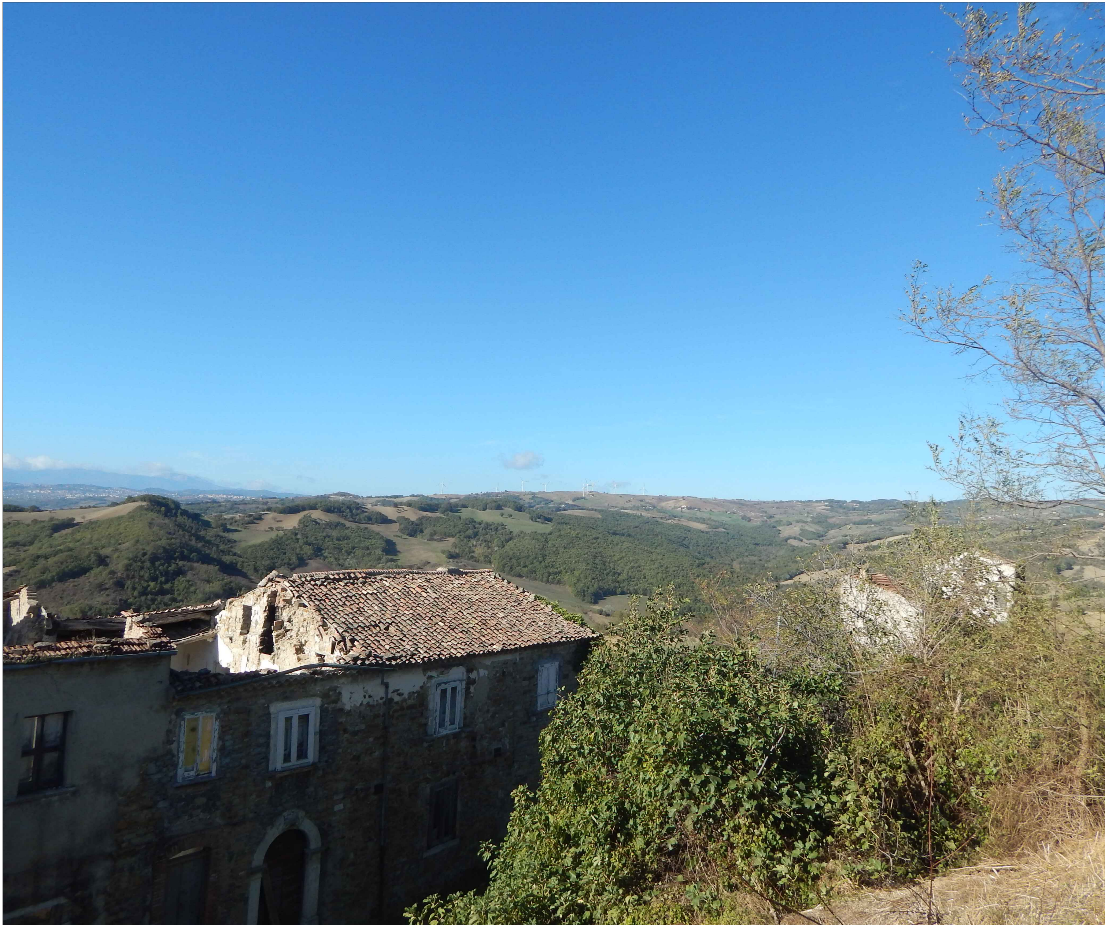
Stato di fatto - Recettore 1: BELVEDERE MONACILIONI