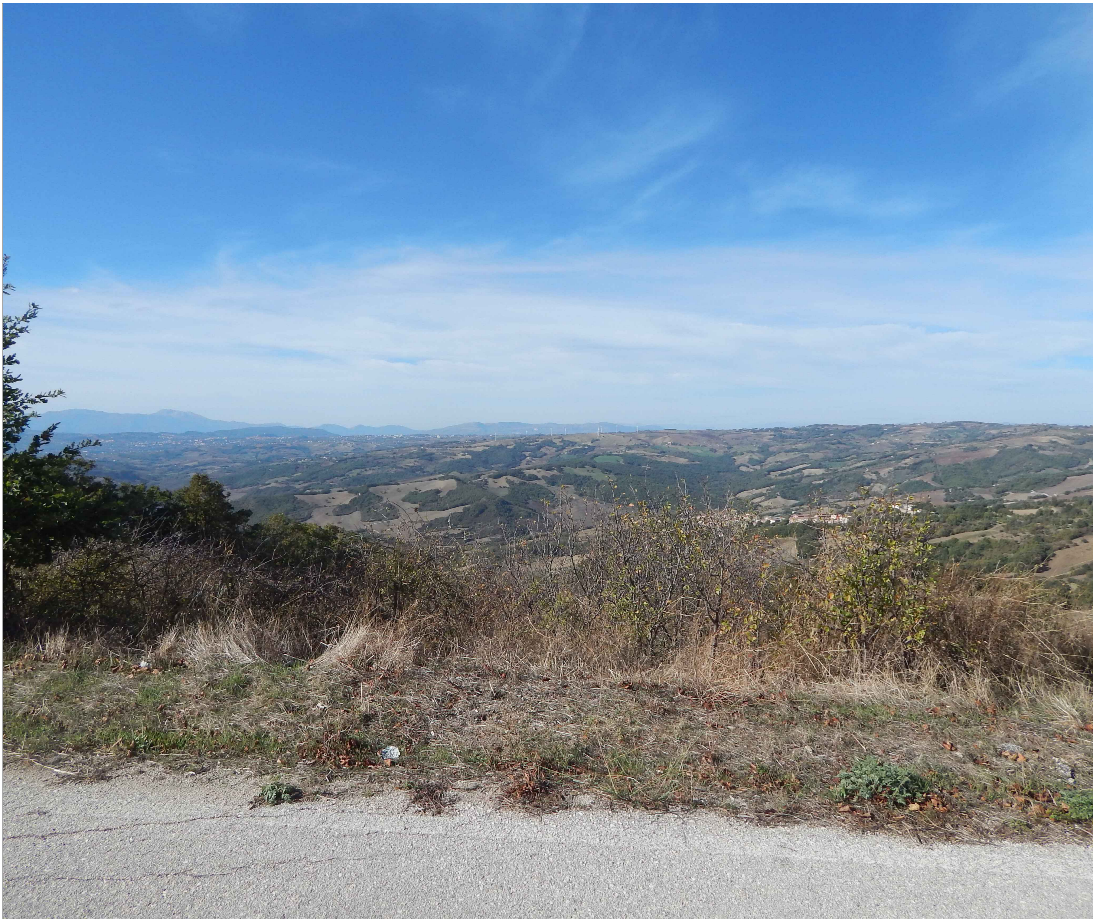
Stato di fatto - Recettore 2: STRADA PROVINCIALE SP149 - MONACILIONI