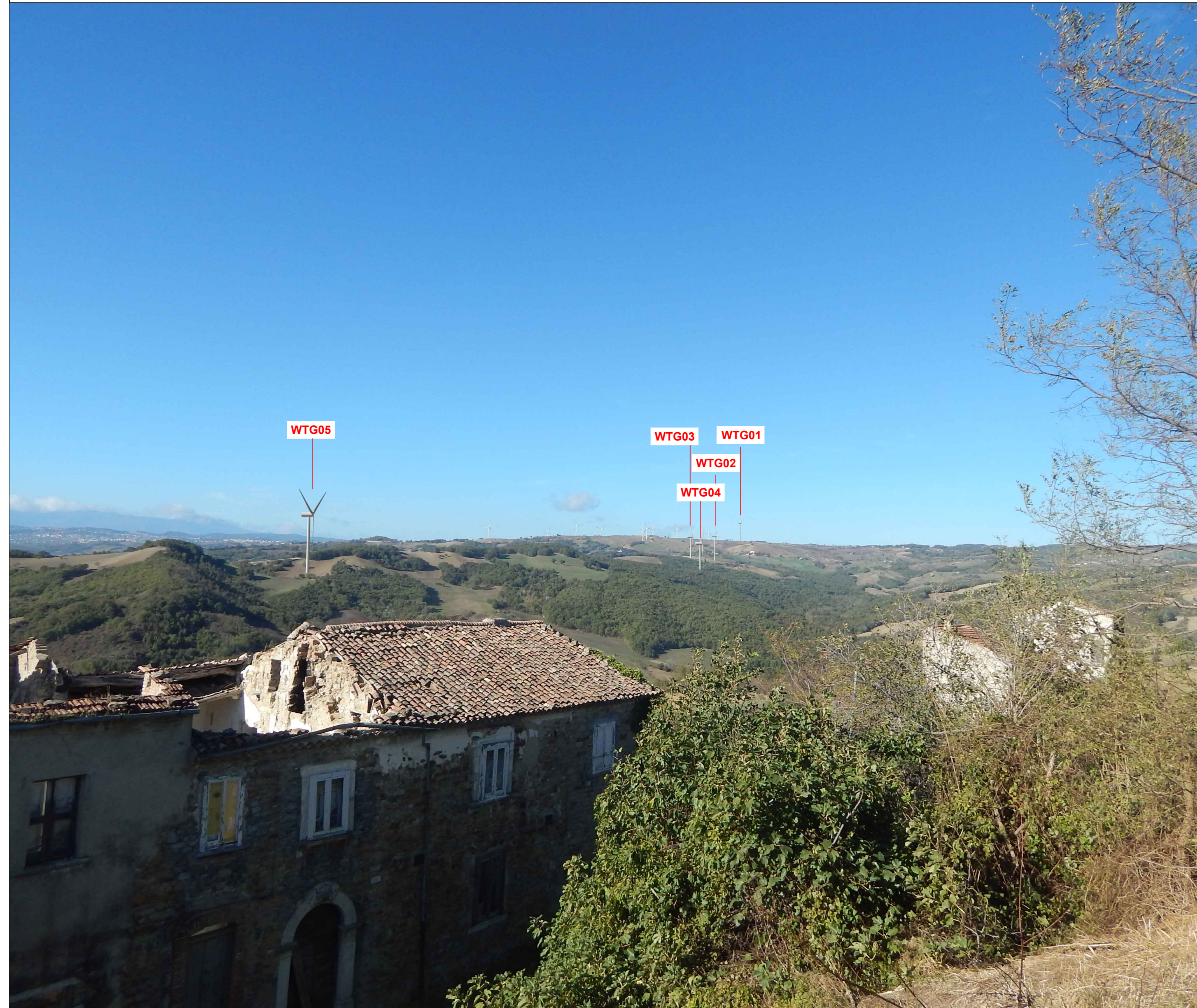
Stato di progetto - Recettore 1: BELVEDERE MONACILIONI