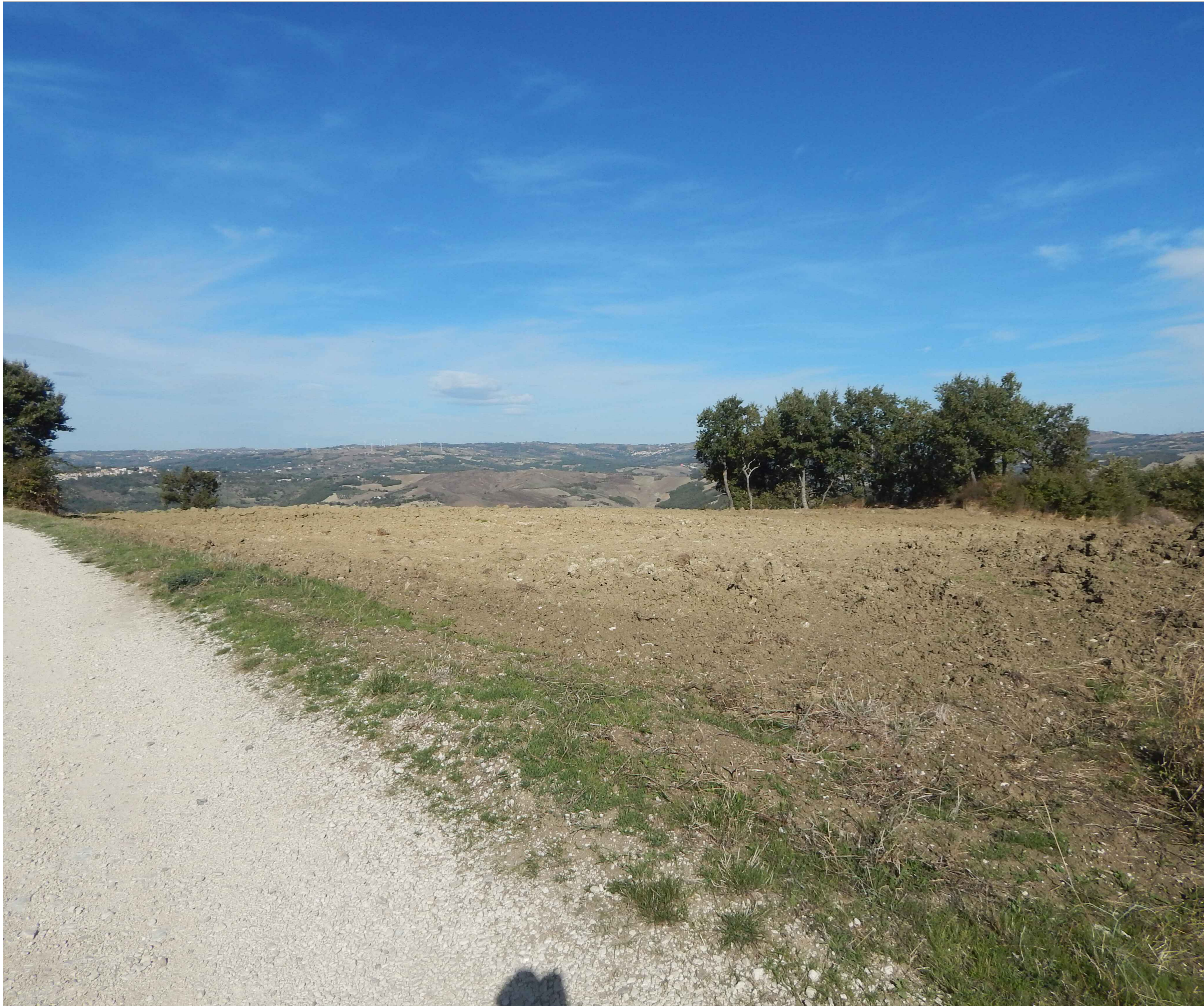
Stato di fatto - Recettore 13: STRADA SECONDARIA - JELSI