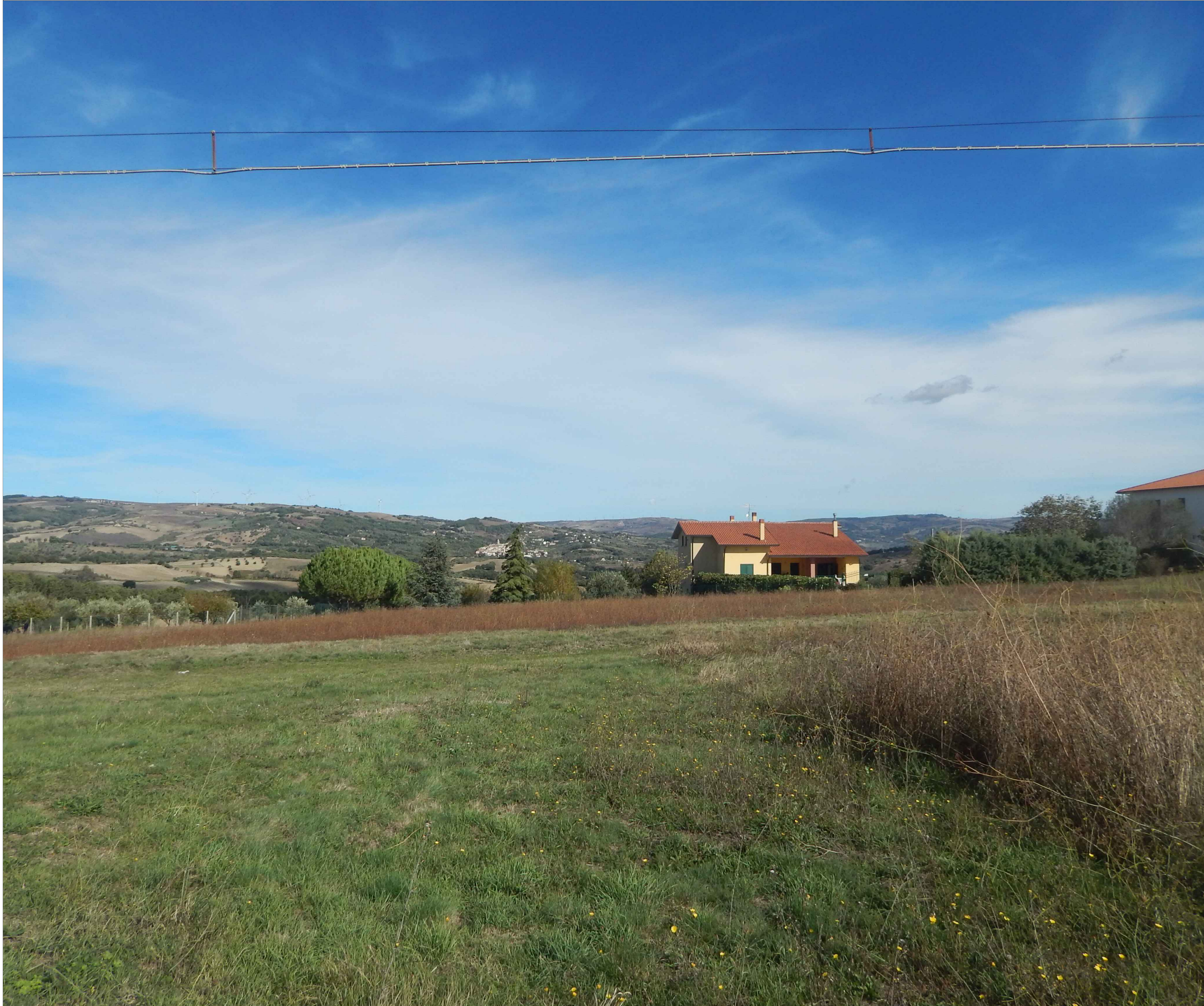
Stato di fatto - Recettore 12: STRADA CONTRADA SAN GIOVANNI CERRETTO-CAMPODIPIETRA