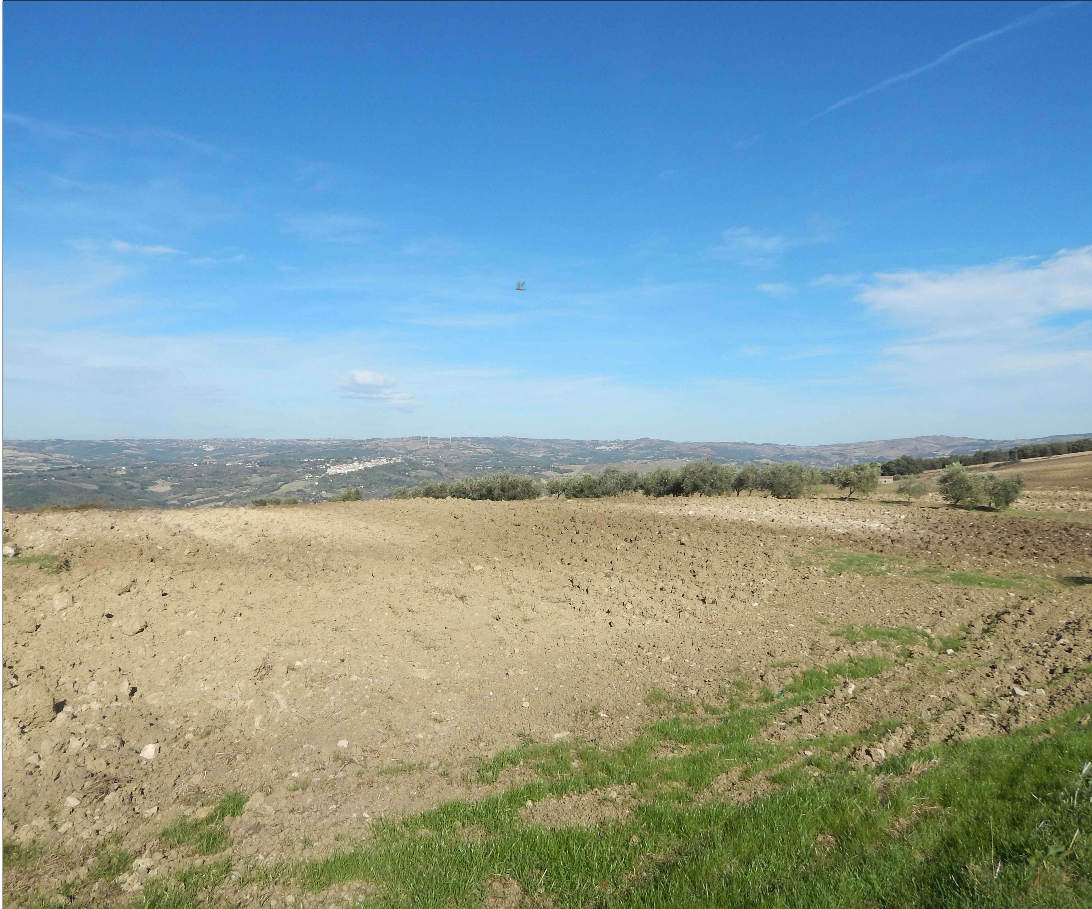
Stato di fatto - Recettore 14: CONTRADA CARRARA - JELSI