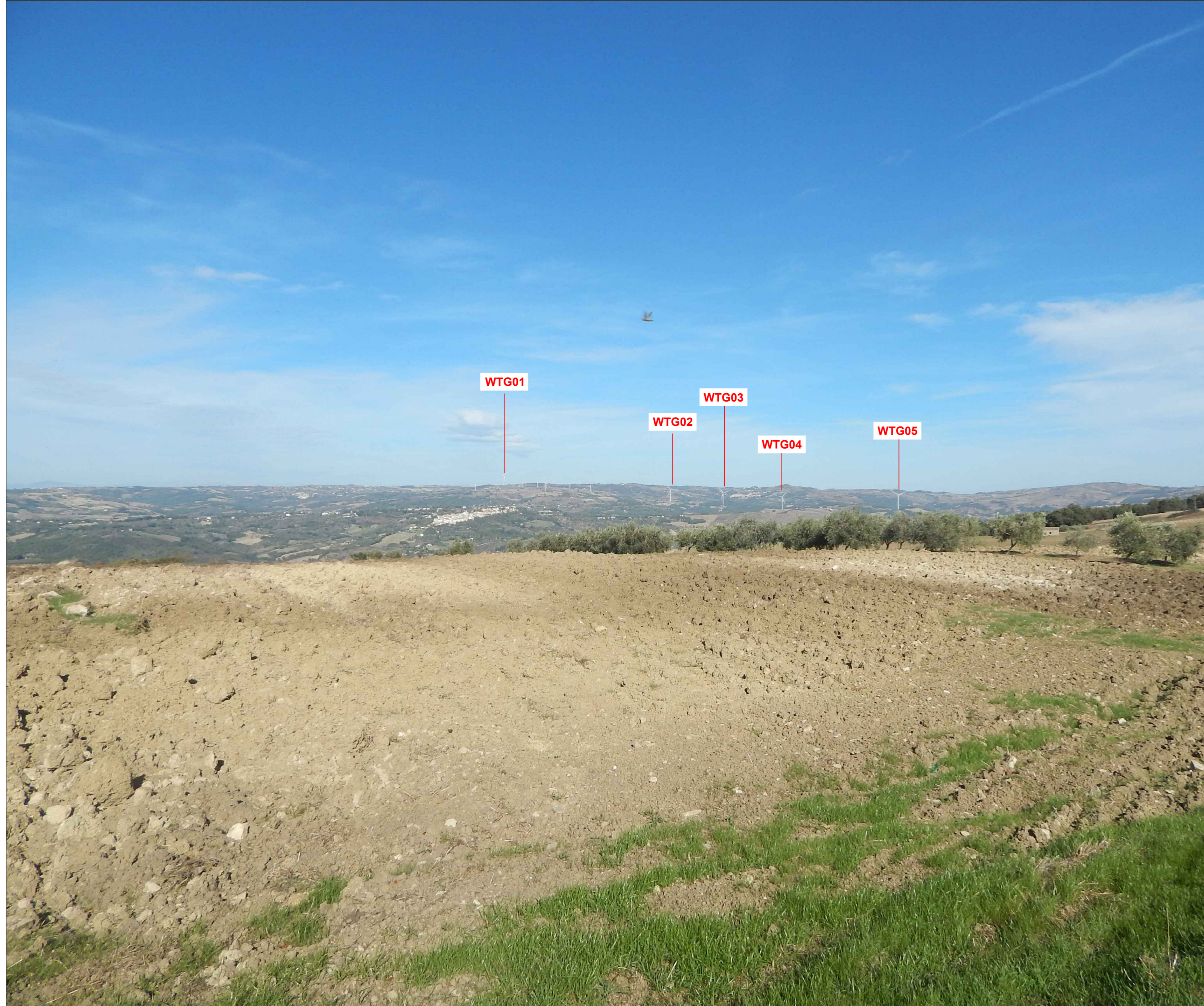
Stato di progetto - Recettore 14: CONTRADA CARRARA - JELSI