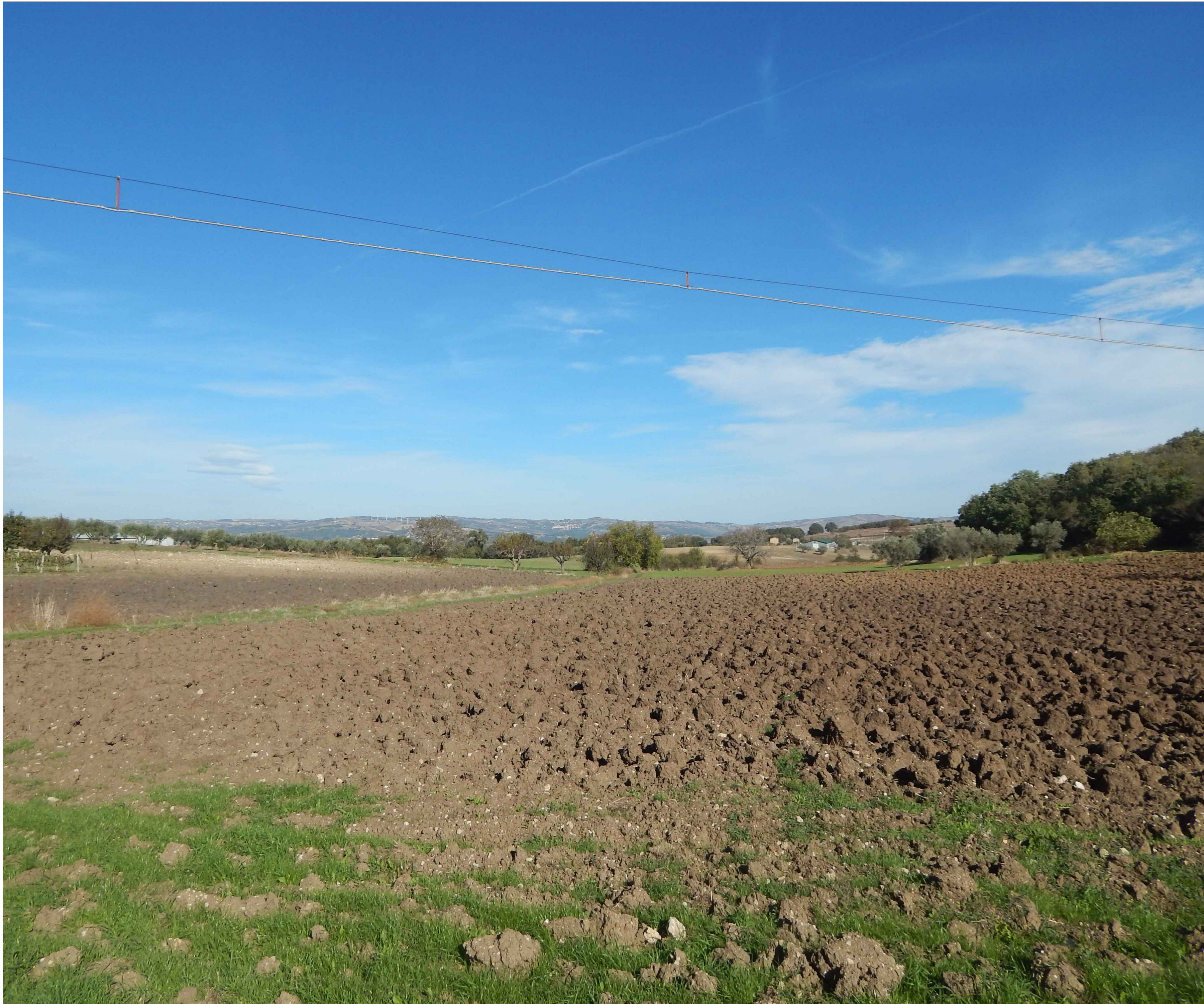
Stato di fatto - Recettore 15: STRADA PROVINCIALE SP119 - JELSI