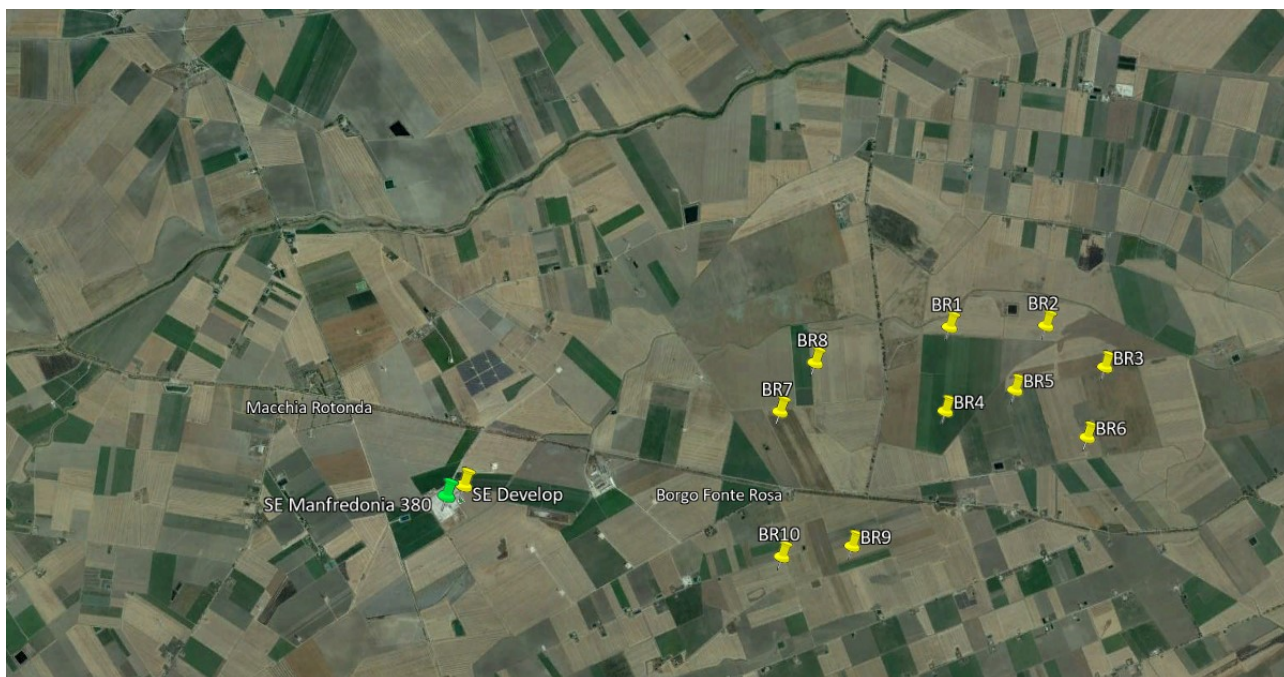
Figura 2 – Inquadramento territoriale del progetto (2/2)