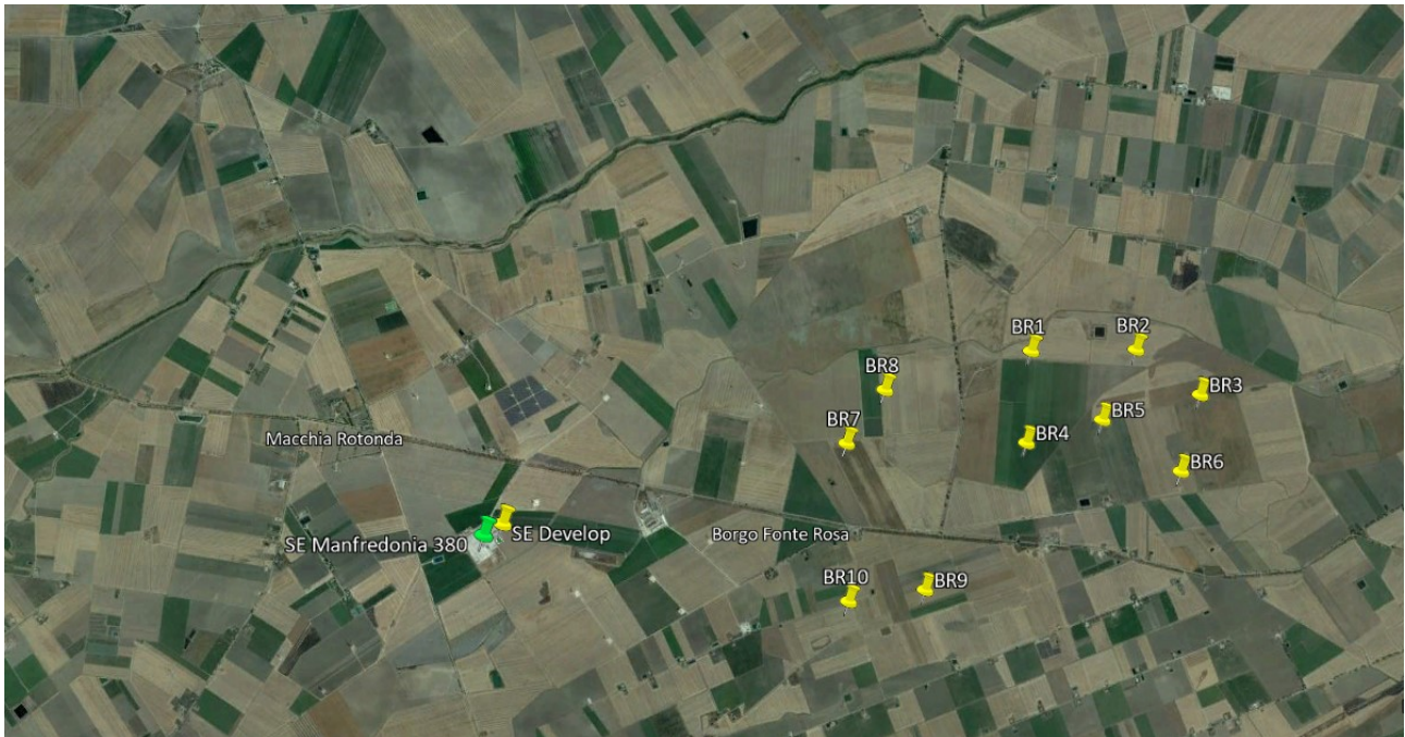
Figura 2 – Inquadramento territoriale del progetto (2/2)