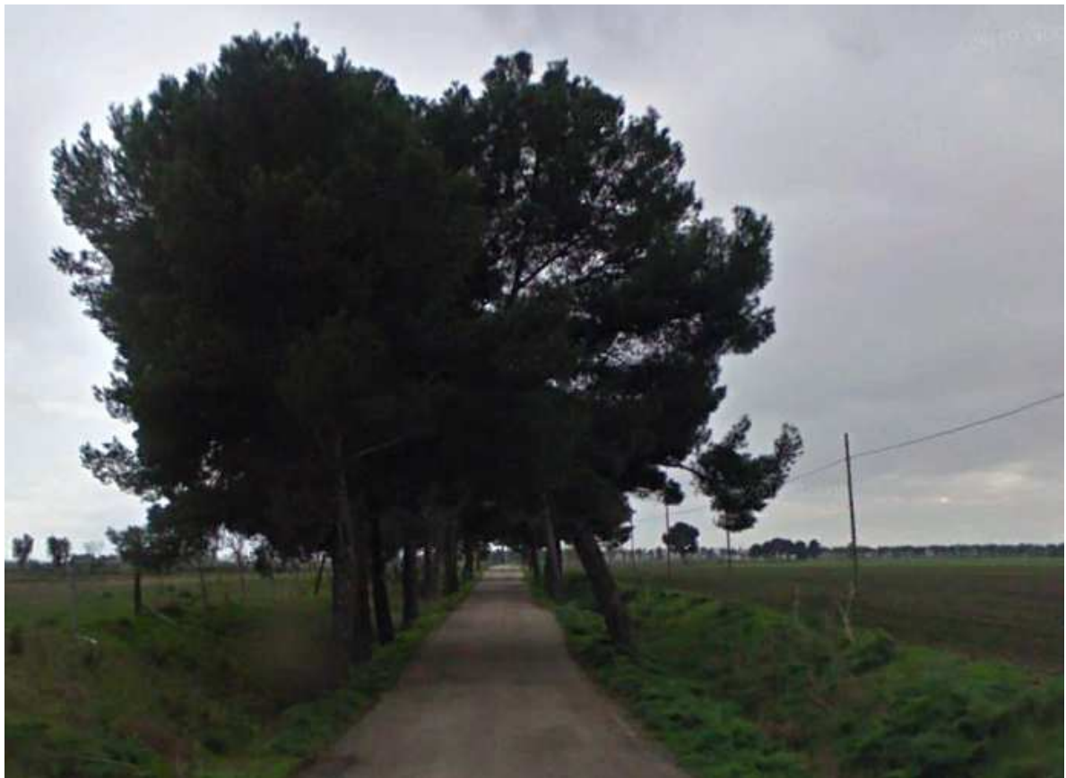
Pini d'Aleppo ai margini della S.P. 71