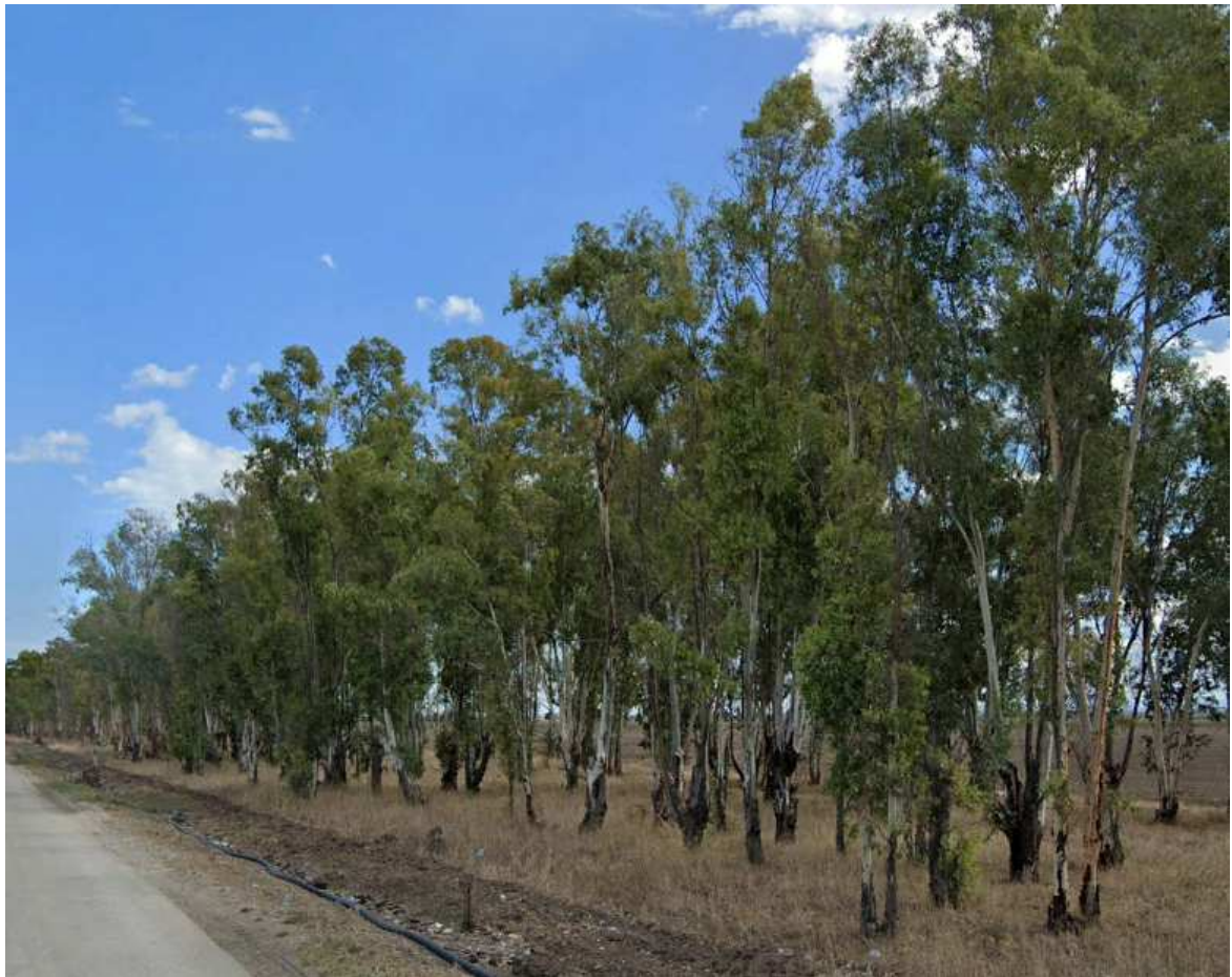
Eucalipti ai margini della S.P. 70