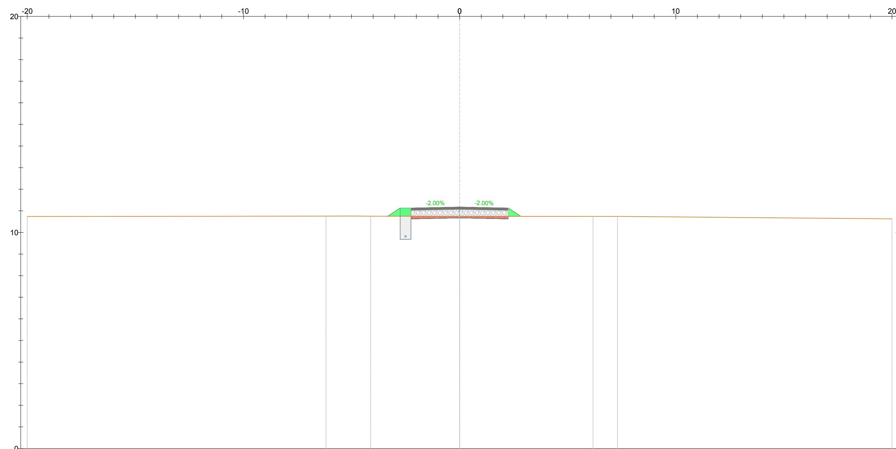
TRACCIATO BR3 Sezione 19 Progressiva: 0+360.00 Scala: 1:100 Quota di Riferimento: 0.00