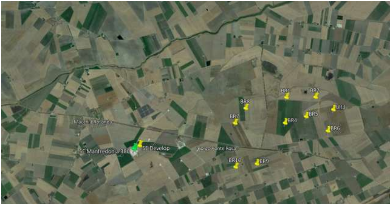
Figura 2 - Inquadramento territoriale del progetto (2/2)

Gli aerogeneratori si possono ricomprendere, dal punto di vista della posizione, in un unico gruppo. Sono infatti tutti ubicati nei territori del comune di Manfredonia, a 15 km dal centro abitato del Comune di Foggia, con quote comprese tra i 10 e i 20 metri sul livello del mare.