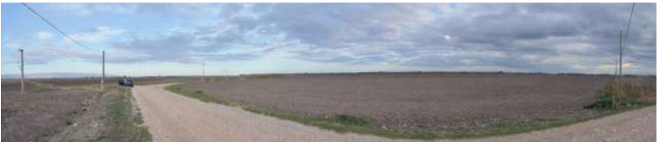
01 – Vista dalla Masseria Ramatola verso Est (WTG 01-02-03-04-05)