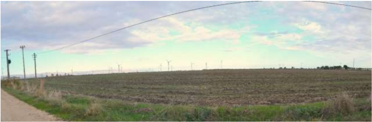
04 bis - Vista dalla Posta Santo Spirito verso NE