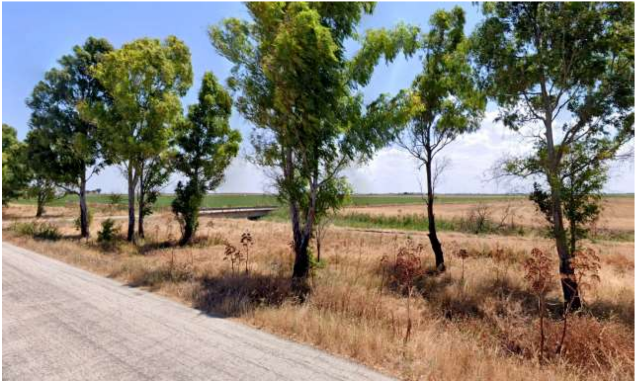
16 – Vista da SP60 (VIR 355-394 e Beni Culturali) verso SO