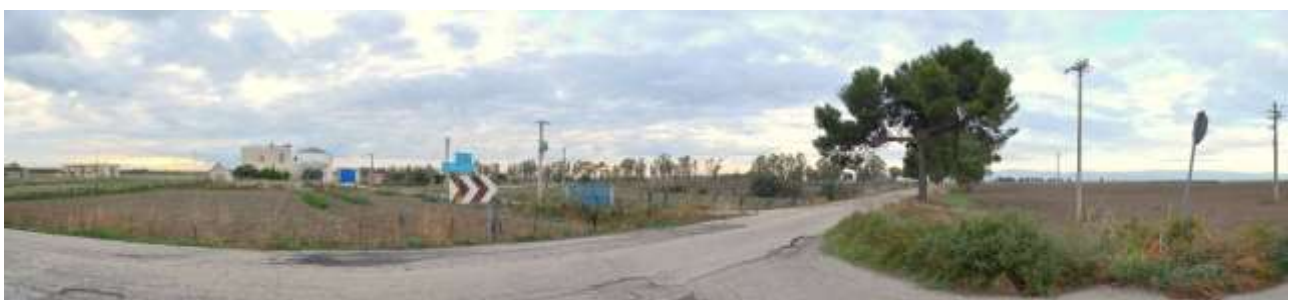
09 – Vista dalla Masseria Inacquata verso NW (WTG 01-02-03-04-05-06)