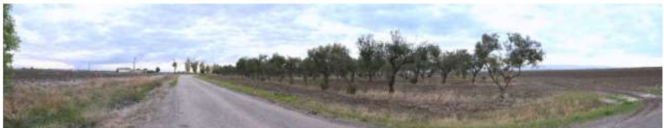
08 – Vista Vista dal Tratturello Foggia-Zapponeta e Masseria Vernarecciola verso NW (WTG 01-02-03-04-05-06)