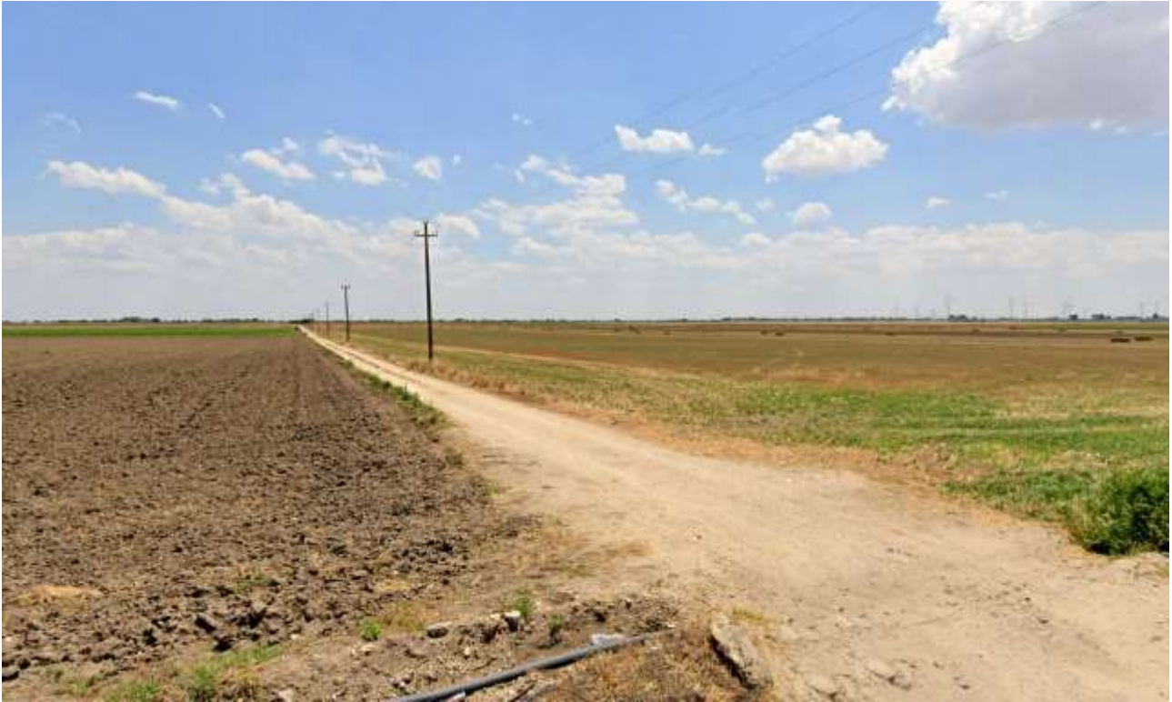
12 – Vista da SP73, Masseria i Canali verso SE