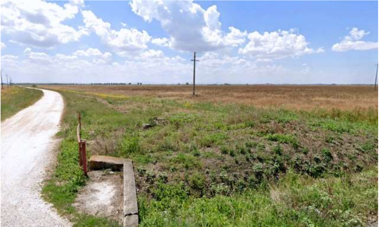
10 – Vista dalla SP 60 (Strada Panoramica) verso SO