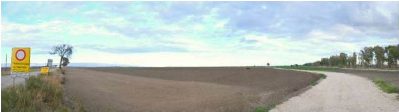
06 - Vista dal Tratturello Foggia-Zapponeta verso Est