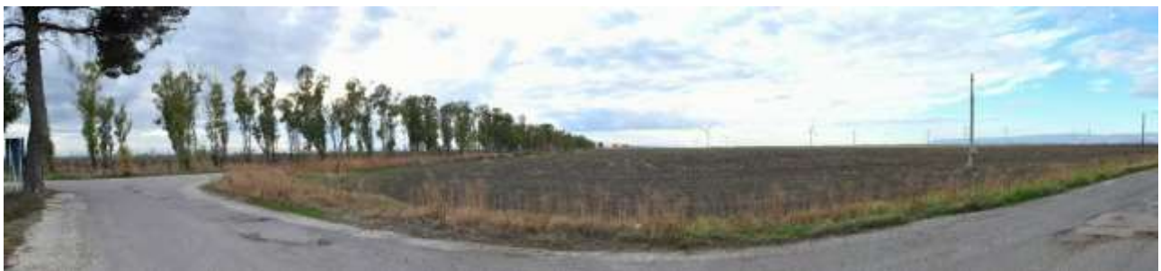
07 – Vista dal Tratturello Foggia-Zapponeta verso Ovest