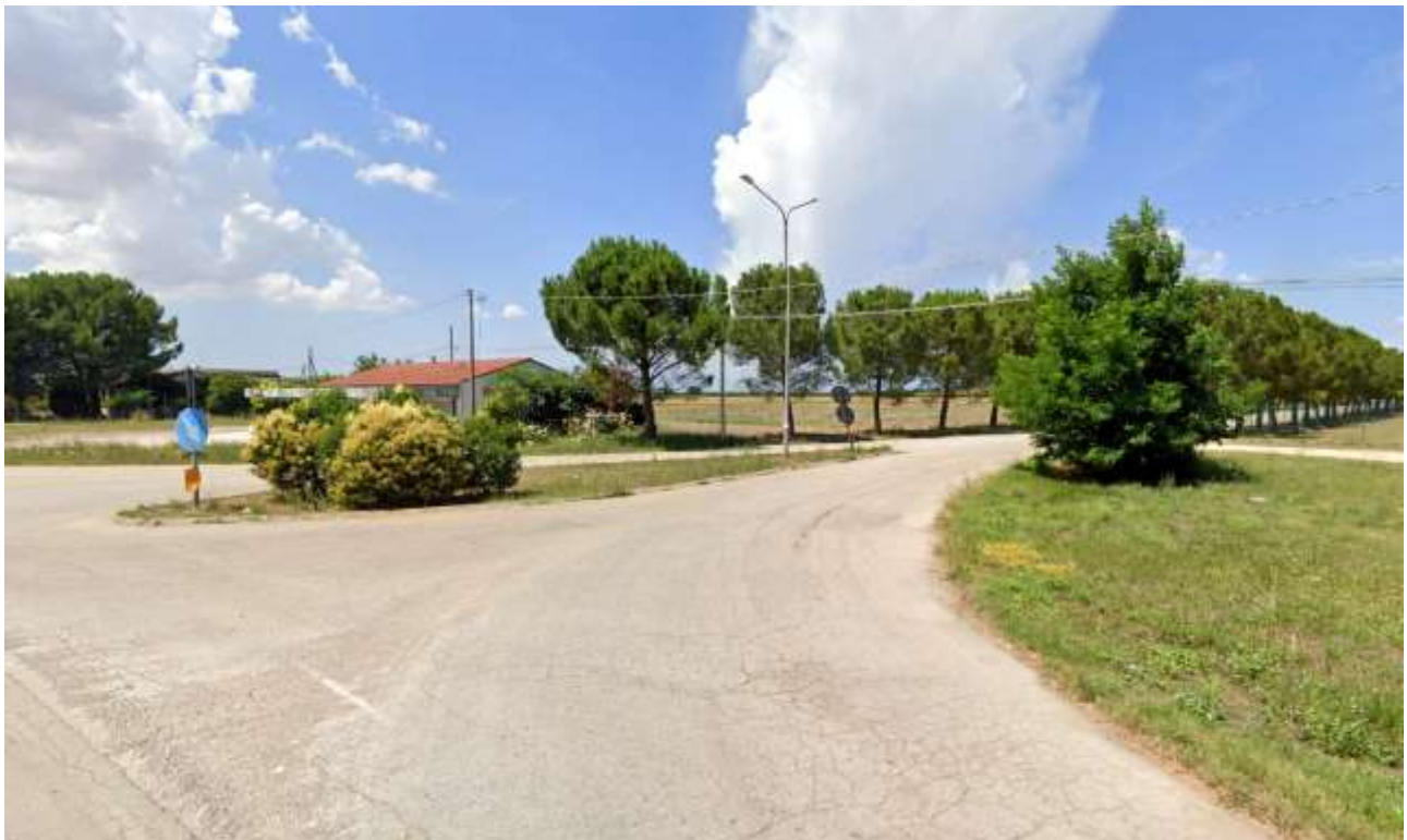
15 – Vista da SS544 (VIR 31 Casa Cantoniera ex ANAS) verso Ovest