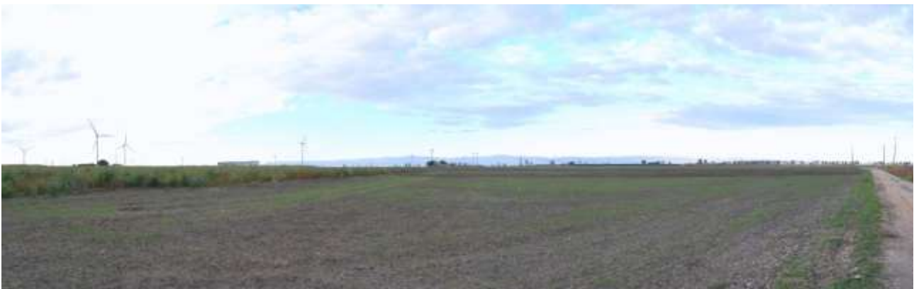
05 - Vista dalla Masseria Fendo La Paglia verso Est (WTG 09-10 e 06-07-08)