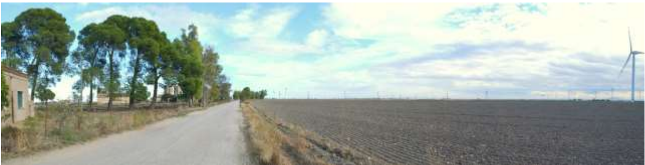
03 - Vista dalla Masseria La Rotonda verso Est (WTG 07-08-09-10)