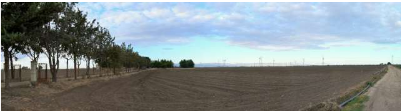
04 - Vista dalla Masseria Santino verso NE (WTG 07-08-09-10)