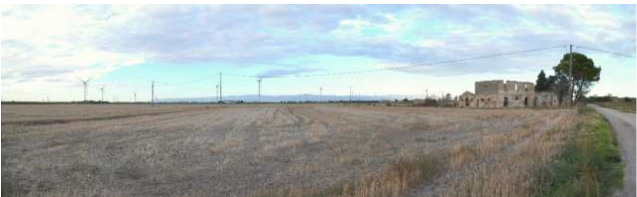
05 bis - Vista dalla Masseria Vaccareccia verso NE