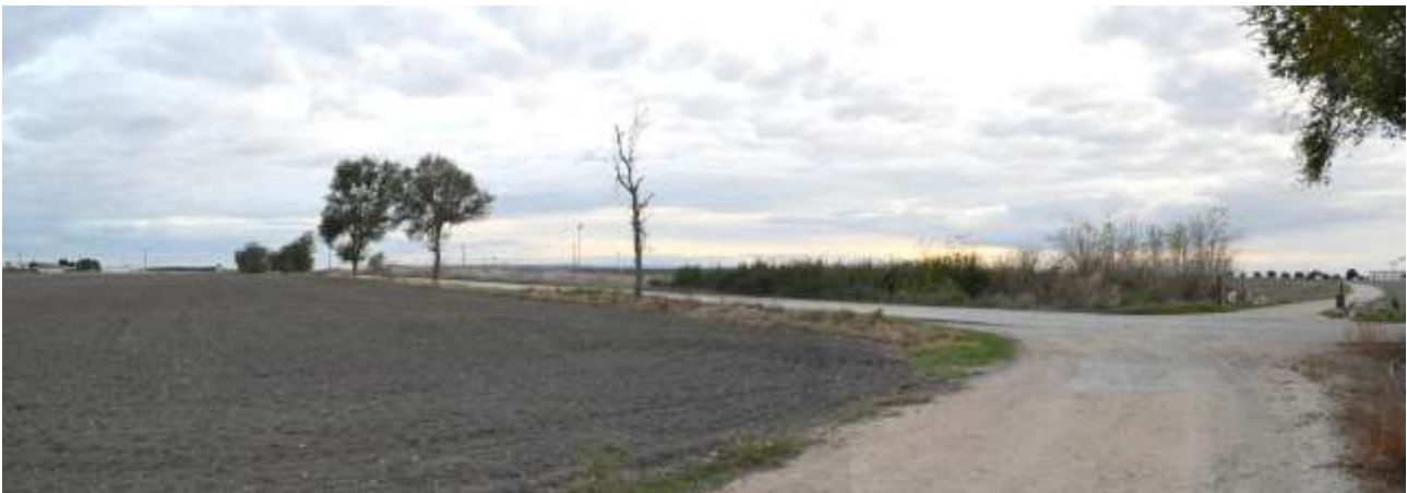
13 – Vista nei pressi del Bene Archeologico ARC0605 Masseria Cupola verso S