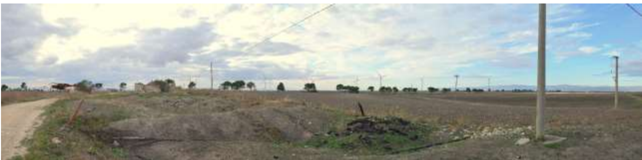
02 - Vista dalla Masseria Ramatola verso Ovest (WTG 07-08-09-10)