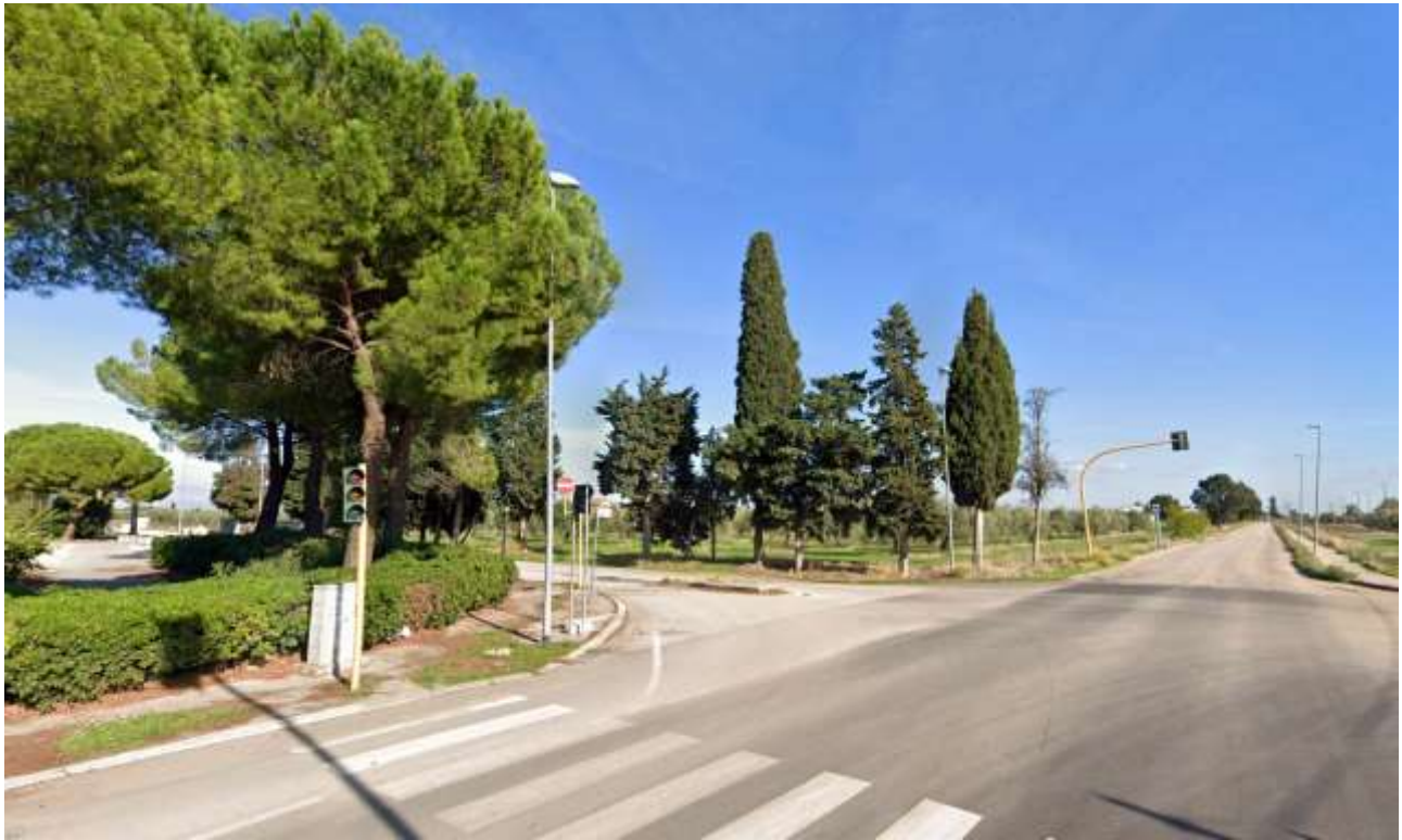
14 – Vista da Borgo Mezzanone (VIR 434-435-437-445-446-447-448-449) verso E dalla SS544