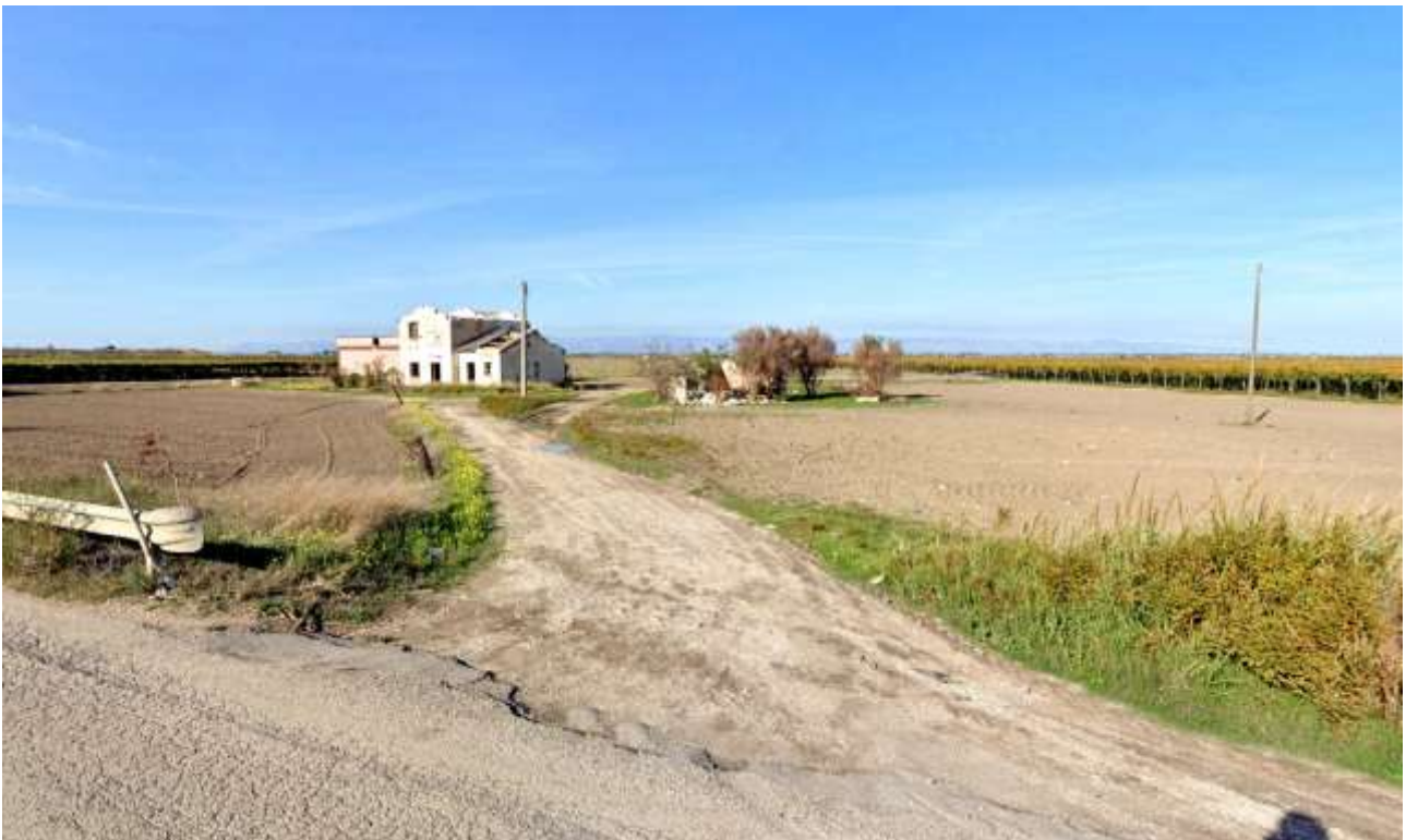
11 – Vista nei pressi del Bene Archeologico ARC0027 Barvagnone Tressanti verso NE