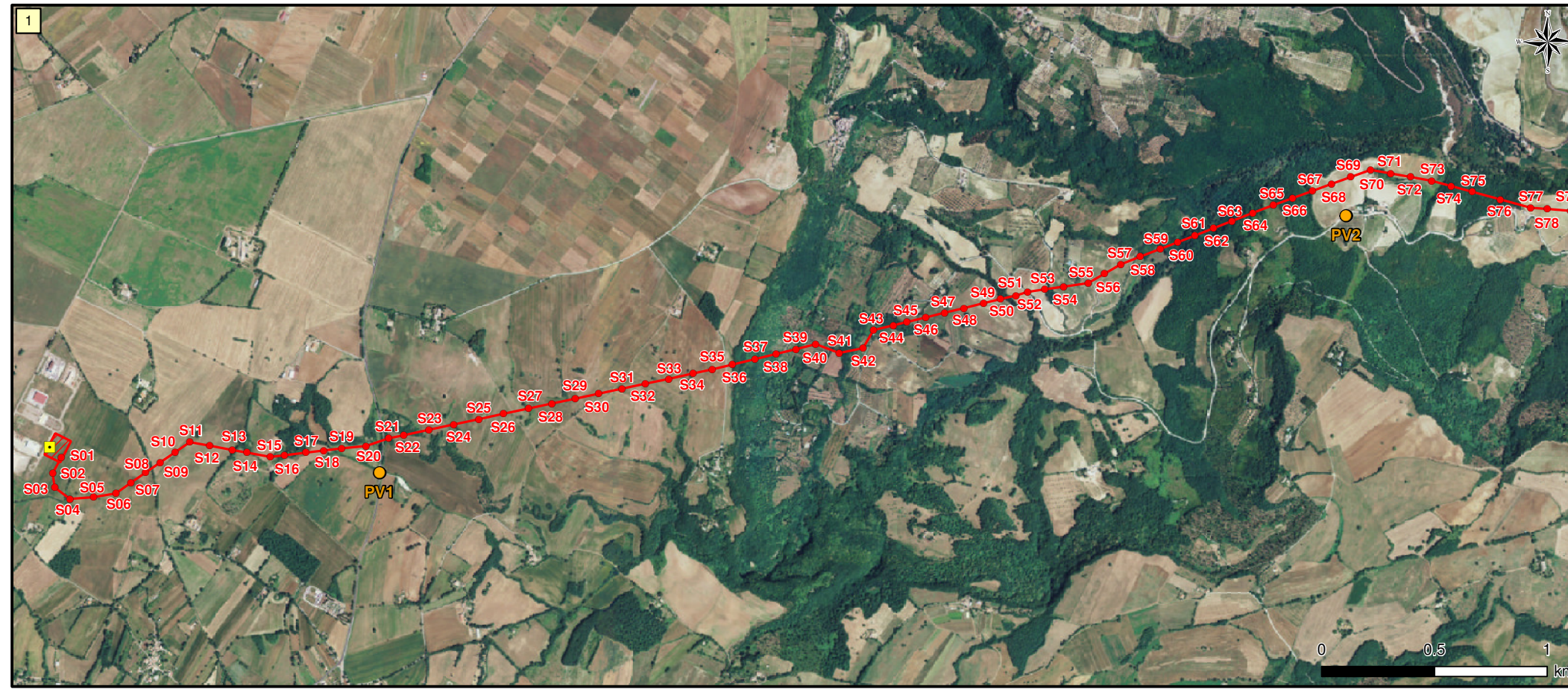
Individuazione dei Punti di Vista Utilizzati per i Fotoinserimenti