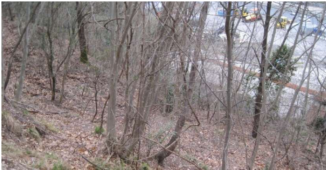
Figura 16 Area boscata nel versante Sud dell'autostrada A12