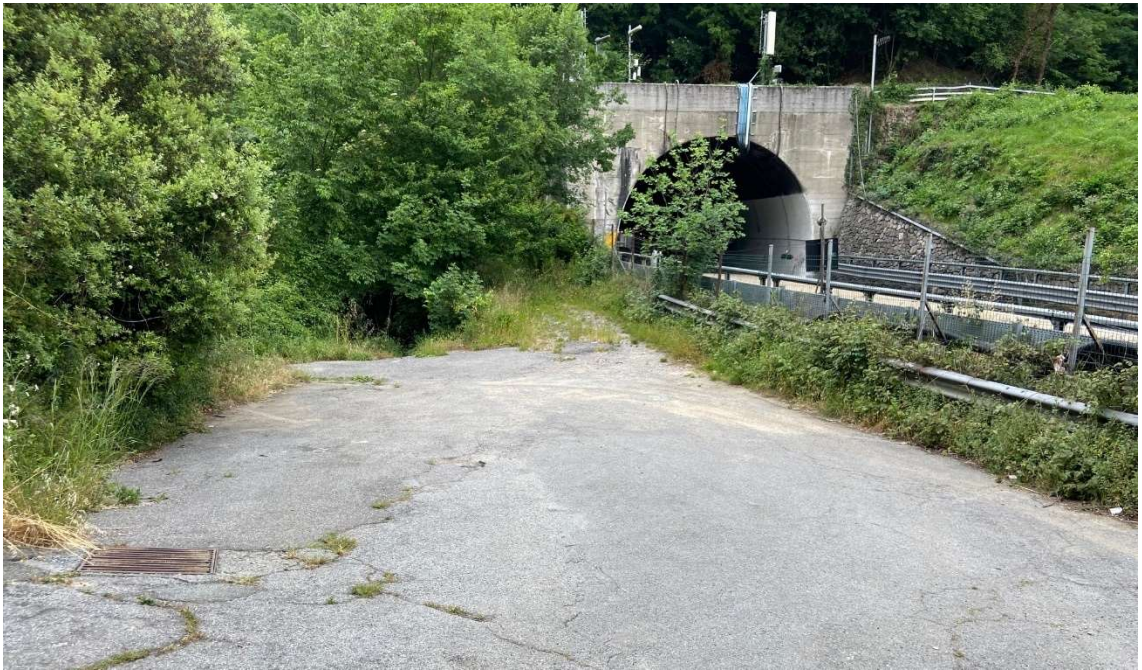
Figura 9 Area di sosta al termine della strada secondaria di Via Torbella