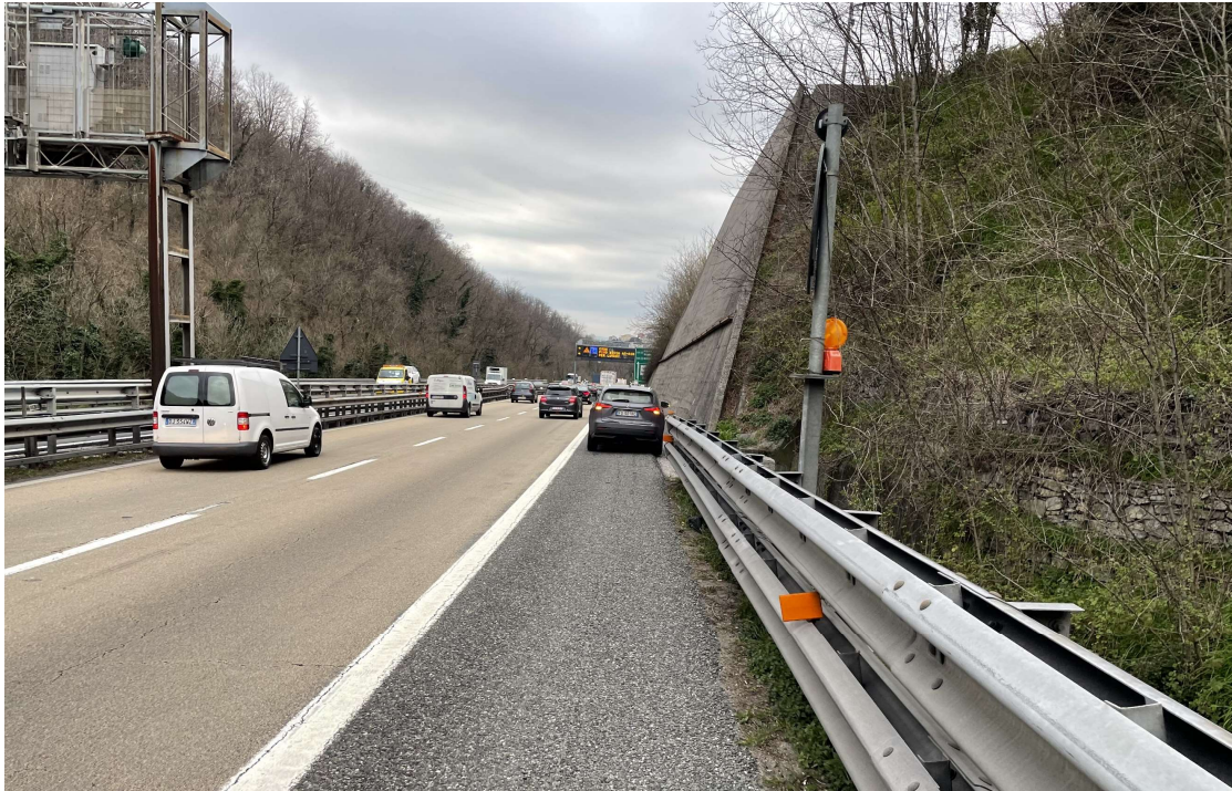
Figura 2 Configurazione geometrica dell'attuale corsia di emergenza dell'Autostrada A12 in carreggiata ovest dove verranno realizzati gli accessi alla zona di imbocco Sud delle gallerie Forte Diamante, Bric du Vento e Torbella Ovest

Le fotografie seguenti illustrano contesti dello stato di fatto in cui la variante proposta si prefigge di apportare miglioramenti rispetto alla situazione attuale e al progetto approvato (rif. Punto 3 Lista di controllo).