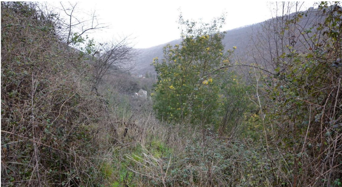
Figura 12 Incolto su terrazzamenti e muretti a secco nel versante Nord dell'autostrada A12