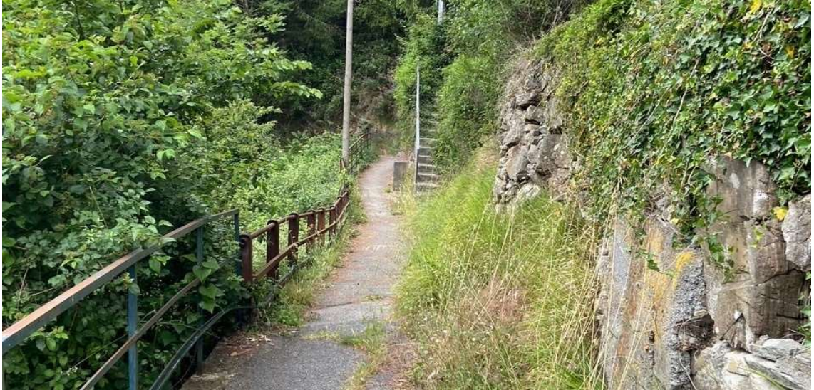
Figura 8 Percorso pedonale (creuza) che dall'insediamento di Begato scende al torrente Torbella