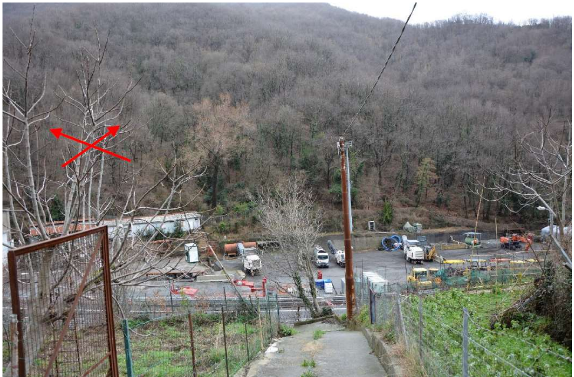
Figura 5 Versante collinare (con la freccia rossa viene indicata la zona di imbocco Nord della galleria Granarolo e Montesperone)