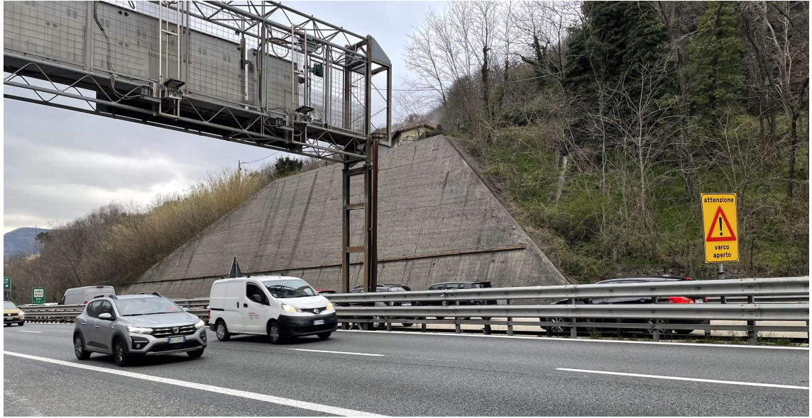
Figura 6 Muro di controripa in aderenza alla carreggiata ovest della piattaforma autostradale dell'A12 al km 2+050 circa