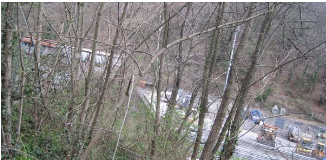
Figura 15 Area a vegetazione boschiva ed arbustiva in evoluzione