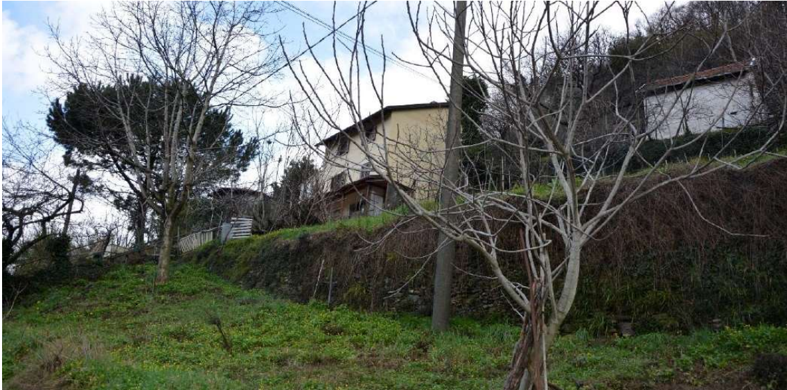
Figura 13 Orti su terrazzamenti nel versante Nord dell'autostrada A12