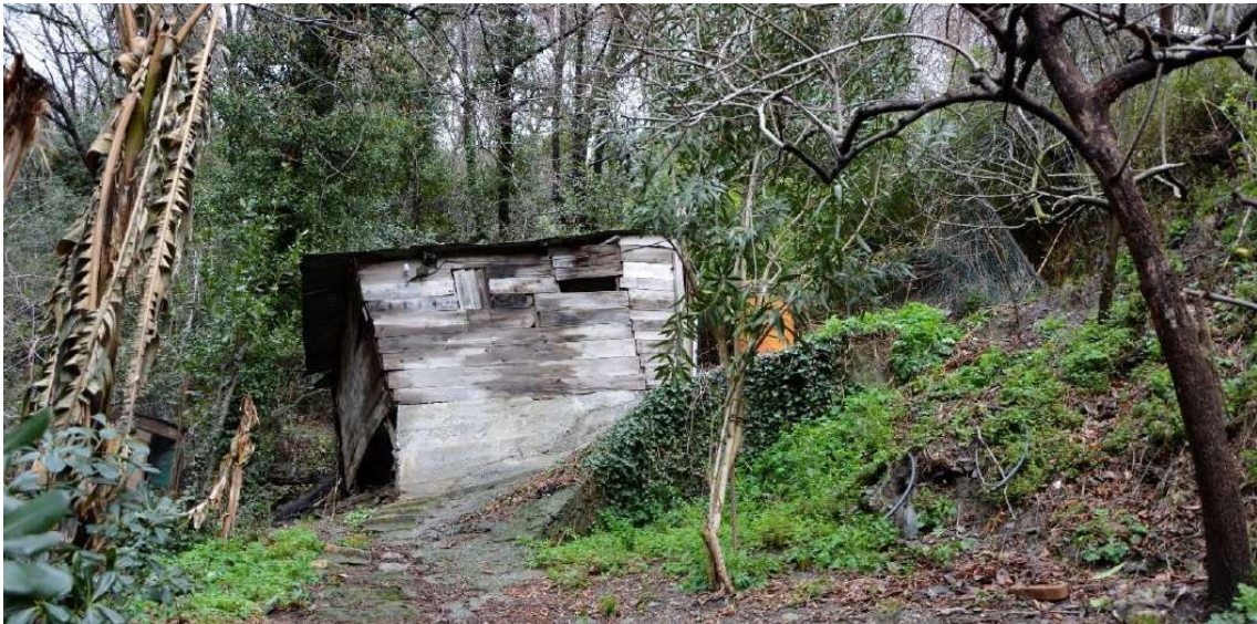
Figura 14 Bosco ceduo residuo al margine di area agricola in stato di abbandono nel versante Nord dell'autostrada A12