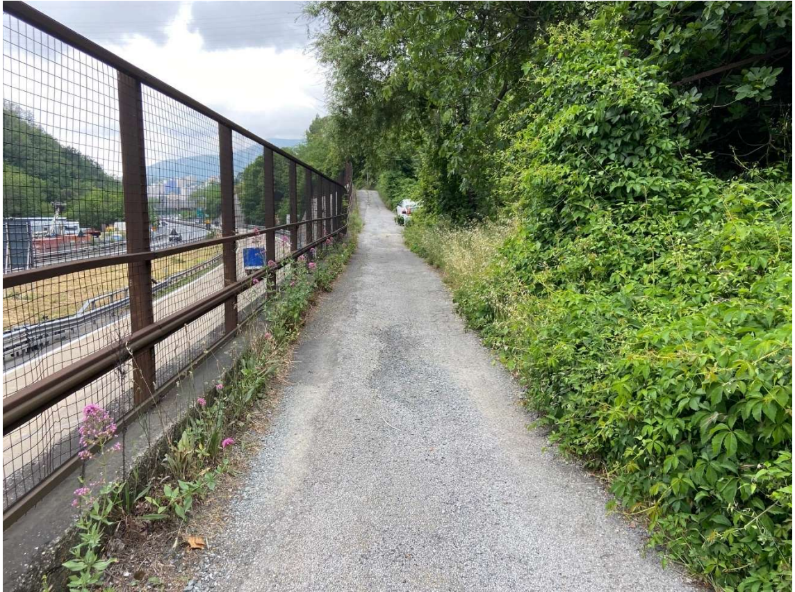
Figura 10 Strada secondaria di Via Torbella