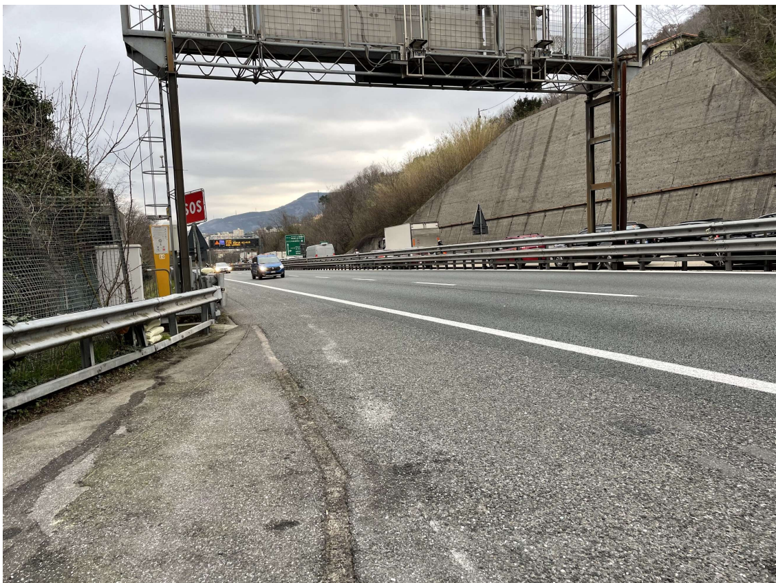
Figura 3 Configurazione geometrica dell'attuale corsia di emergenza dell'Autostrada A12 in carreggiata est dove verranno realizzati gli accessi alla zona di imbocco Nord delle gallerie Granarolo e Montesperone