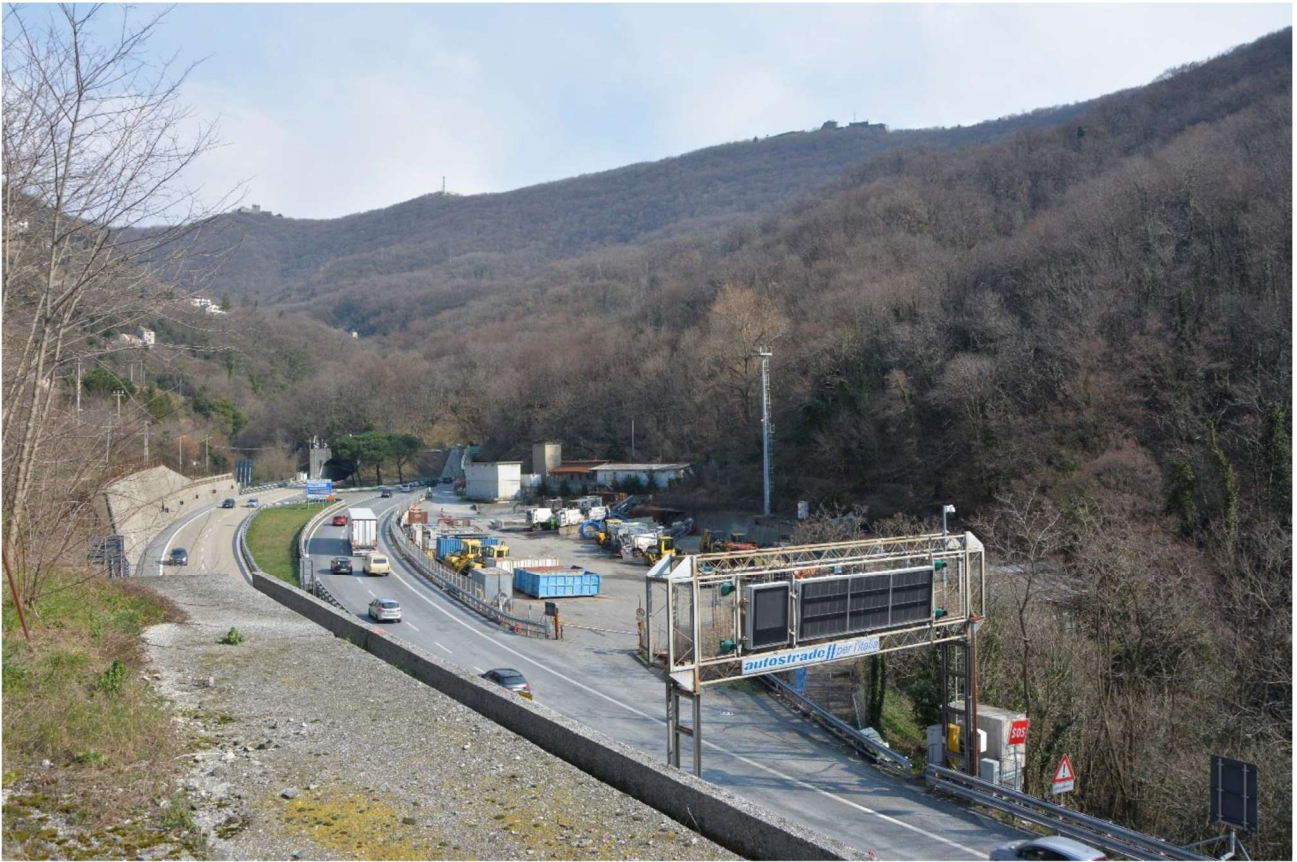
Figura 11 Attuale sede autostradale dell'A12 e spazio adiacente la carreggiata sud di pertinenza della stessa autostrada

Le fotografie seguenti completano l'inquadramento dello stato di fatto con particolare riferimento all'uso attuale del suolo nelle aree adiacenti all'infrastruttura già in esercizio.