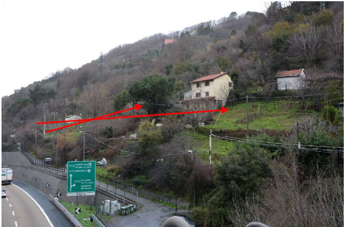
Figura 4 Versante collinare (con la freccia rossa viene indicata la zona di imbocco Sud della galleria Forte Diamante e Bric du Vento)