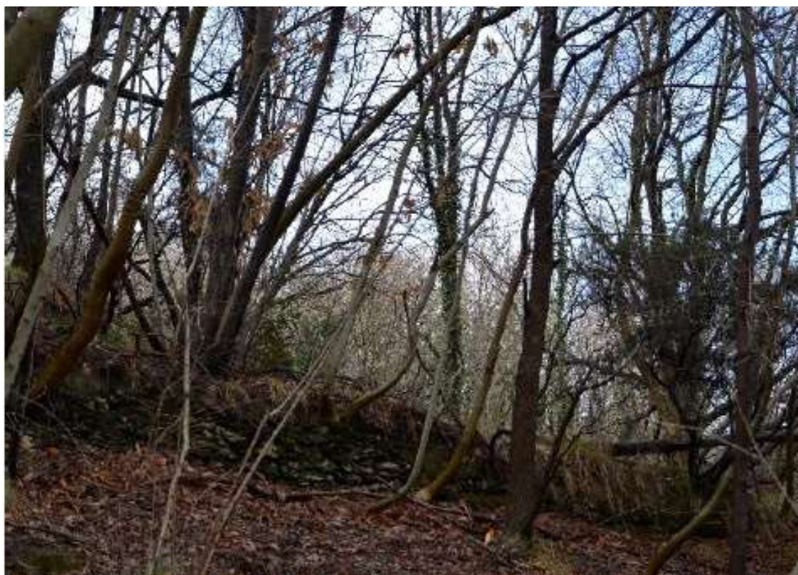
Figura 17 Area boscata nel versante Sud dell'autostrada A12