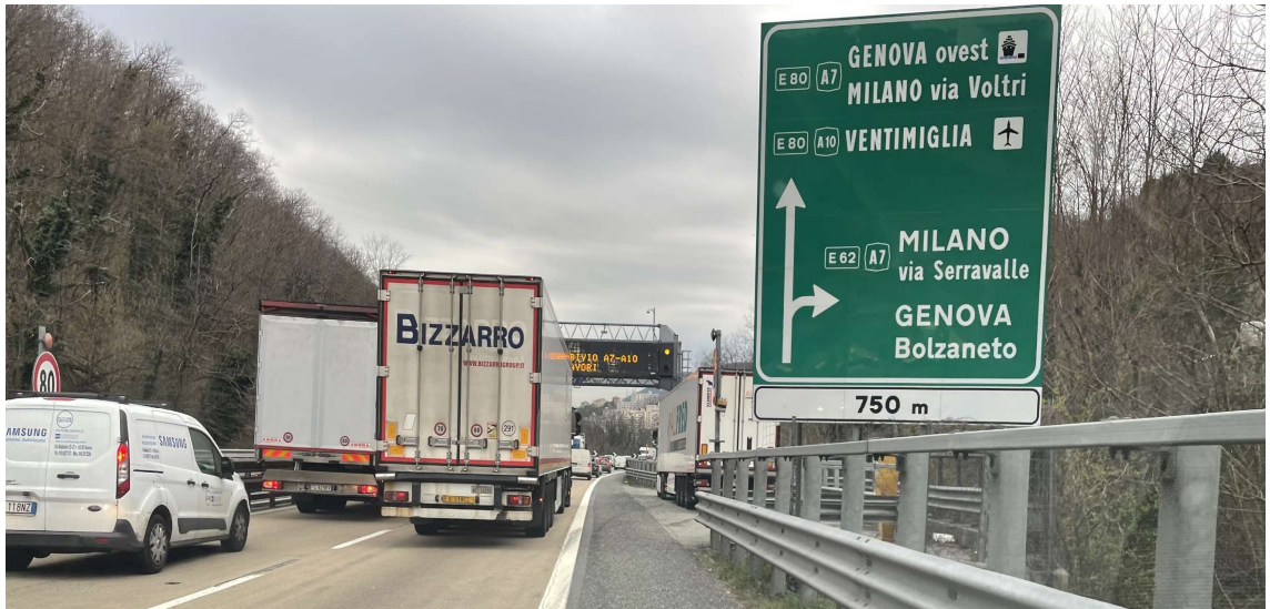
Figura 7 Piazzola di sosta in carreggiata ovest della piattaforma autostradale dell'A12 al km 1+950 circa