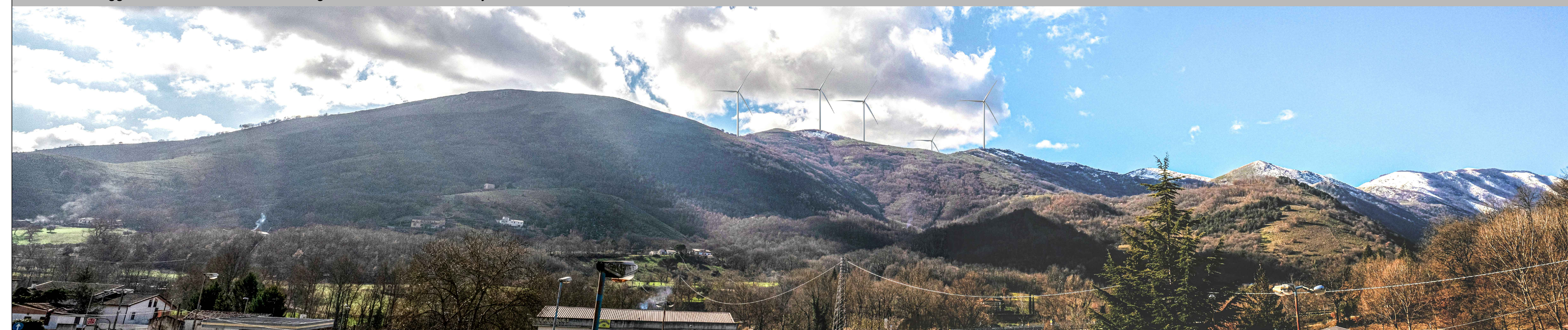
Vista del sito oggetto dell'intervento dall'area artigianale di Muro Lucano, layout di adeguamento tecnico