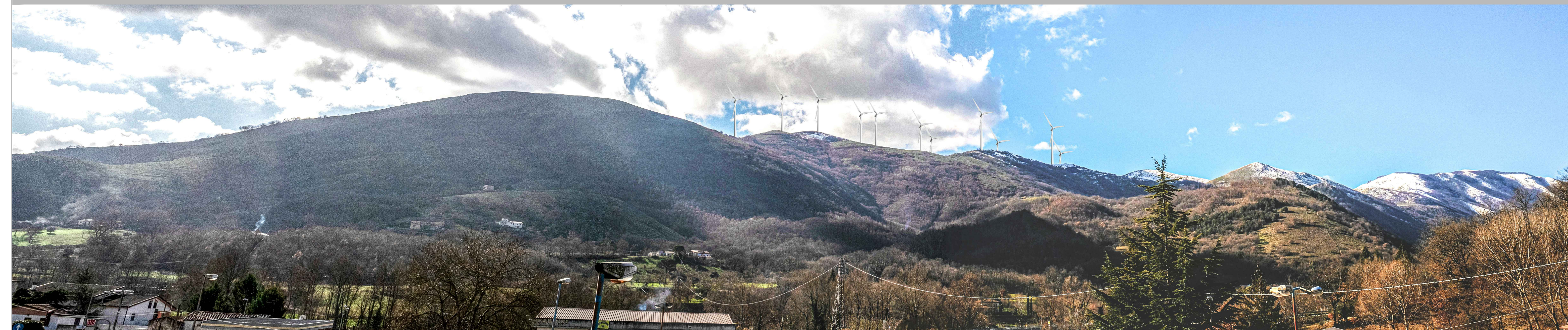
Vista del sito oggetto dell'intervento dall'area artigianale di Muro Lucano, layout autorizzato