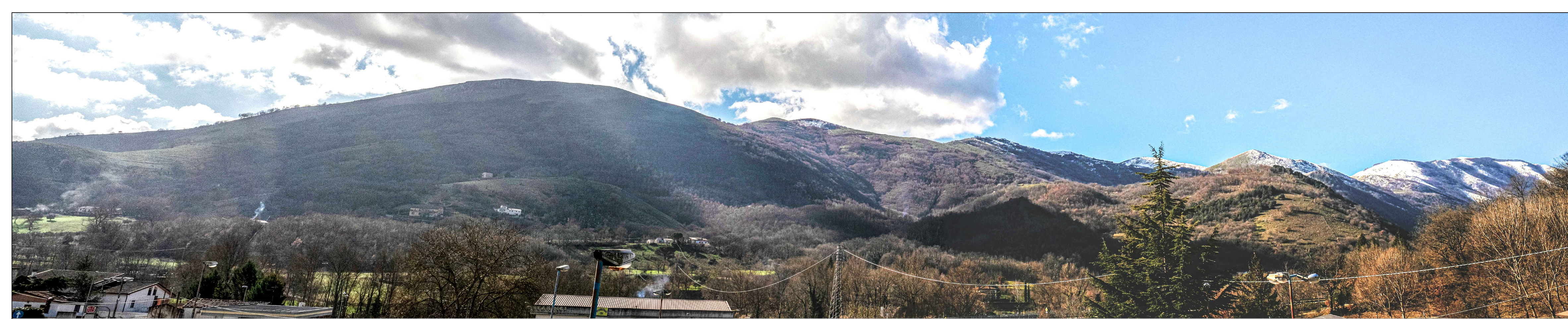
Vista del sito oggetto dell'intervento dall'area artigianale di Muro Lucano, prima dell'intervento