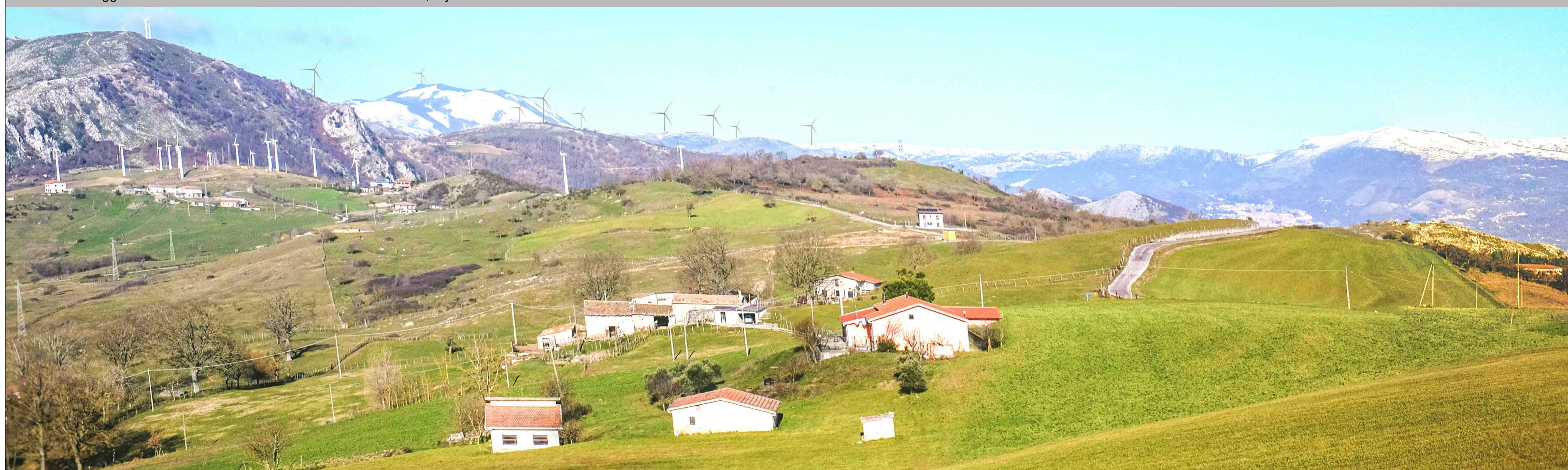
Vista del sito oggetto dell'intervento dall'area industriale di Balvano, layout di adeguamento tecnico