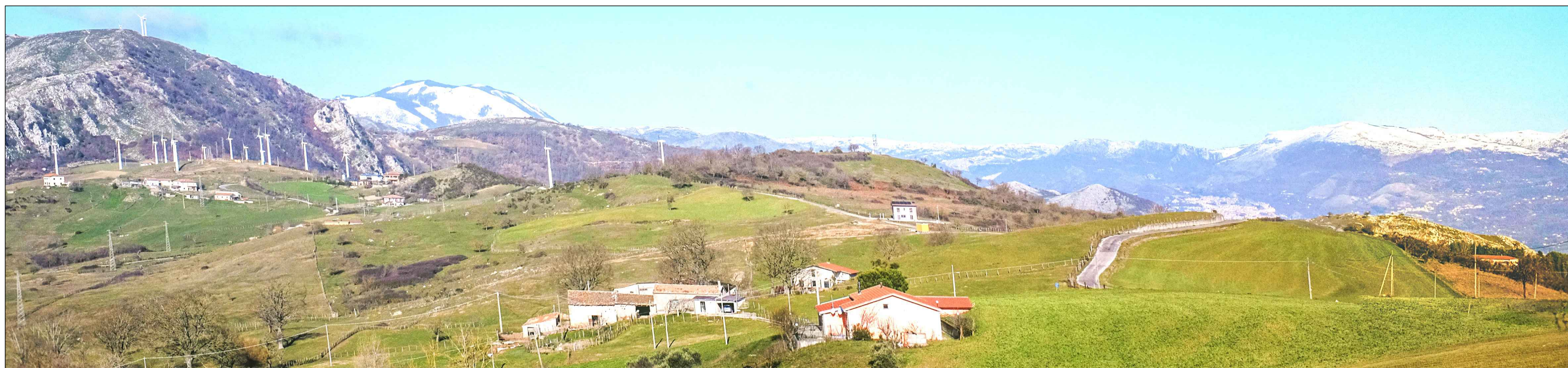
Vista del sito oggetto dell'intervento dall'area industriale di Balvano, prima dell'intervento