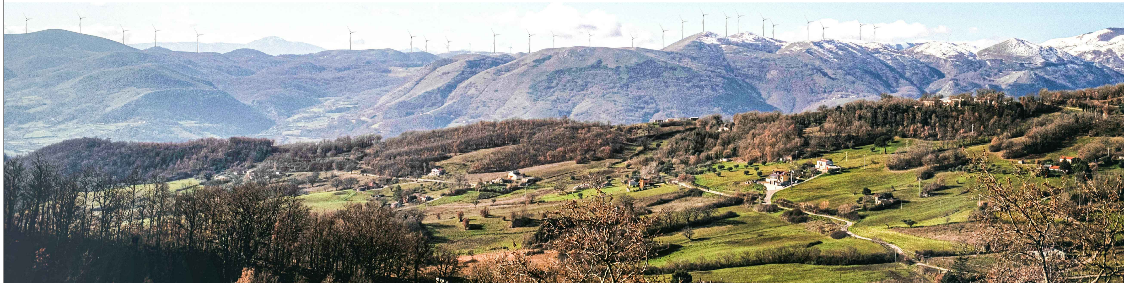
Vista del sito oggetto dell'intervento dal Comune di Bella - centro abitato, layout autorizzato