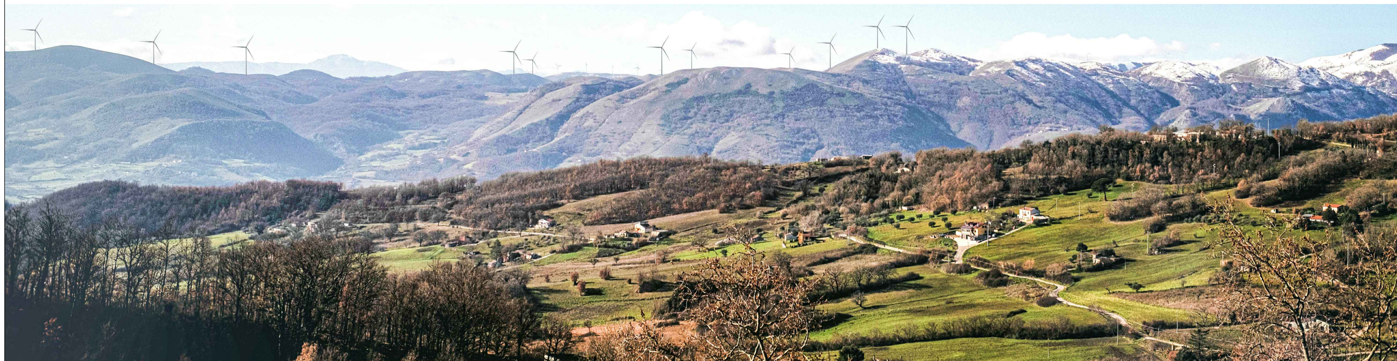
Vista del sito oggetto dell'intervento dal Comune di Bella - centro abitato, layout di adeguamento tecnico