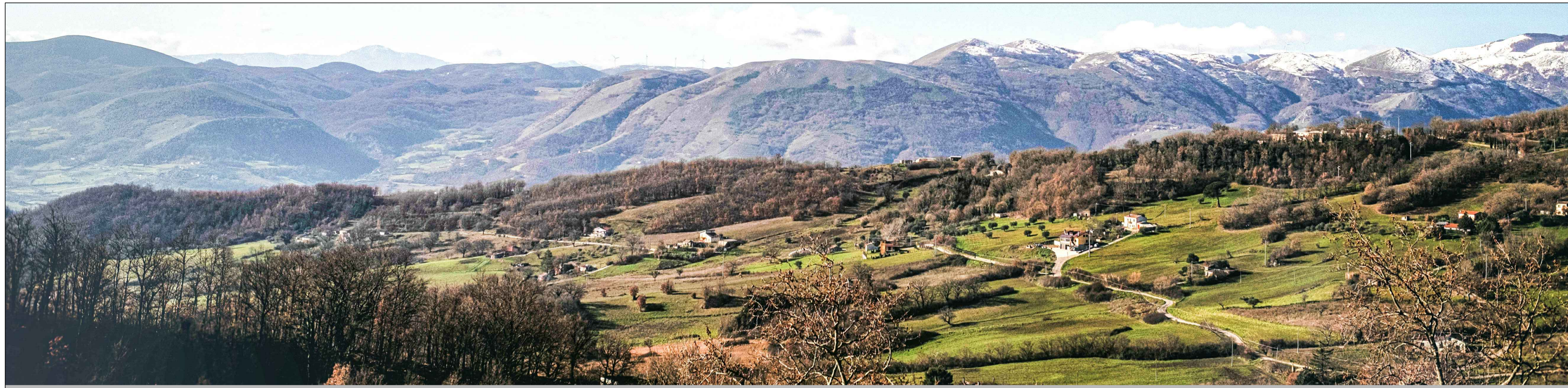
Vista del sito oggetto dell'intervento dal Comune di Bella - centro abitato, prima dell'intervento