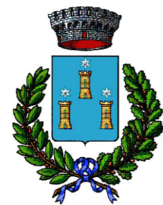
COMUNE DI CAMPOBELLO DI LICATA