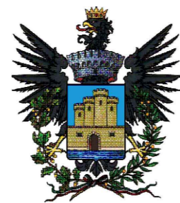
COMUNE DI LICATA

COSTRUZIONE ED ESERCIZIO DI UN IMPIANTO DI PRODUZIONE DELL'ENERGIA ELETTRICA DA FONTE EOLICA AVENTE POTENZA IN IMMISSIONE PARI A 48MW E ACCUMULO DI 24MW CON RELATIVO COLLEGAMENTO ALLA RETE ELETTRICA - IMPIANTO DENOMINATO "LICATA" UBICATO IN AGRO DEL COMUNE DI LICATA E CAMPOBELLO DI LICATA