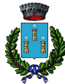
COMUNE DI CAMPOBELLO DI LICATA