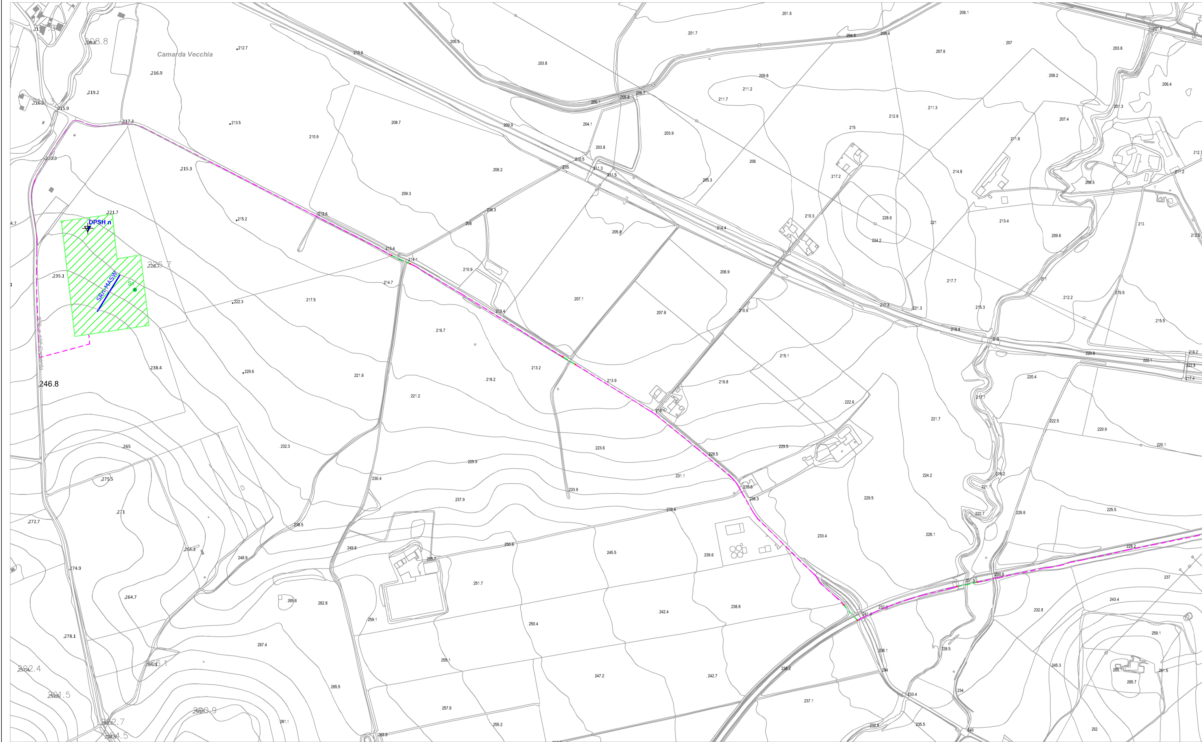
Tav.1/a: Planimetria Indagini (1:5.000)