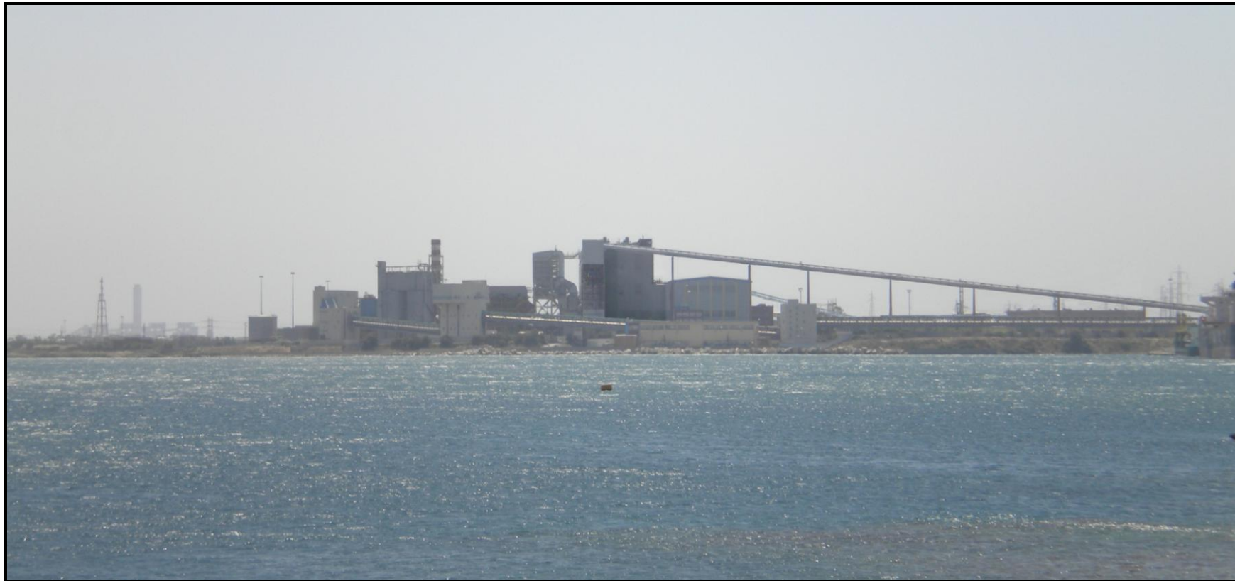
Fotoinserimenti da PV3 – Stato Progetto co-Combustione