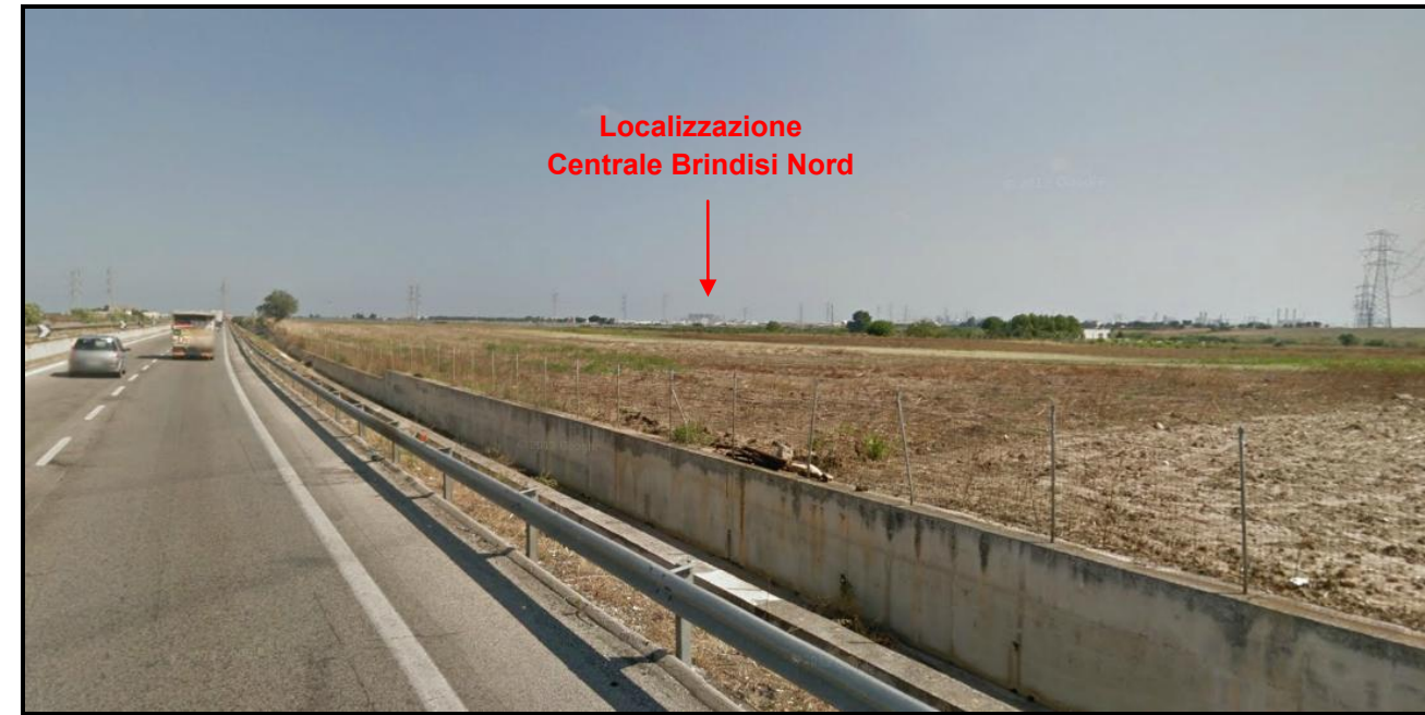
Figura D4.1.4h Ripresa Fotografica da PV7, Strada Statale n.613