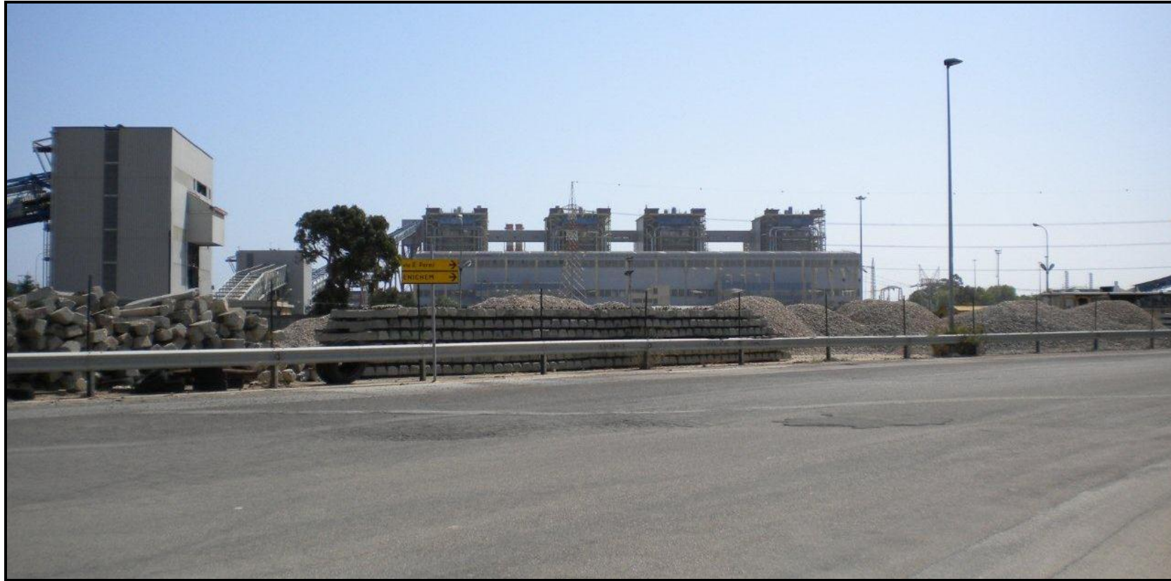
Figura D4.1.4b (2 di 2)