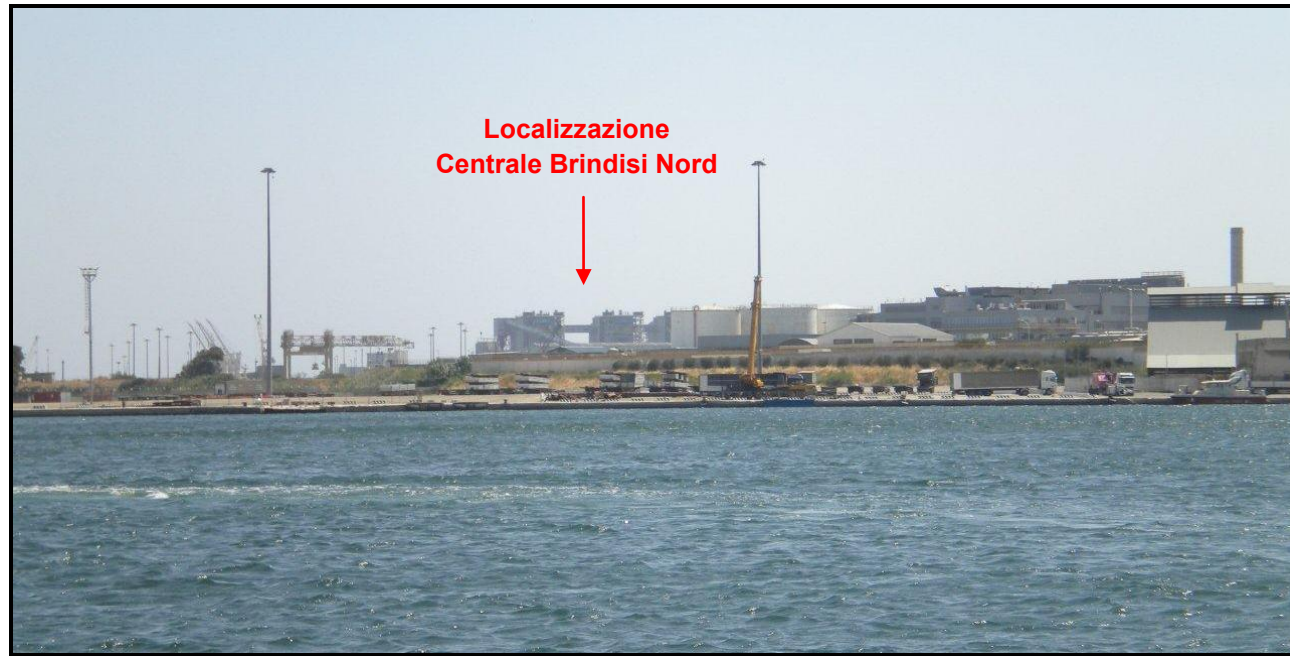
Figura D4.1.4f Ripresa Fotografica da PV5, Viale Regina Margherita