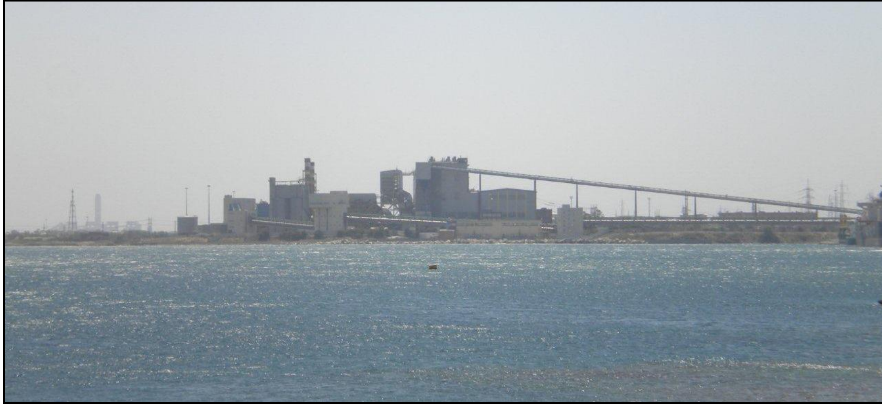
Figura D4.1.4d (2 di 2)