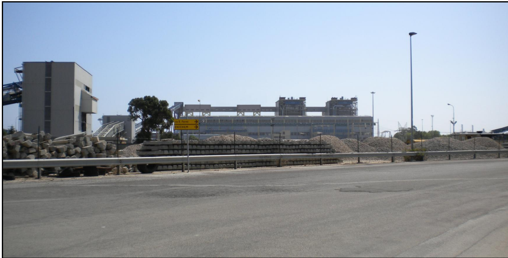
Fotoinserimenti da PV1, Viale Ettore Maiorana – Stato Progetto co-Combustione