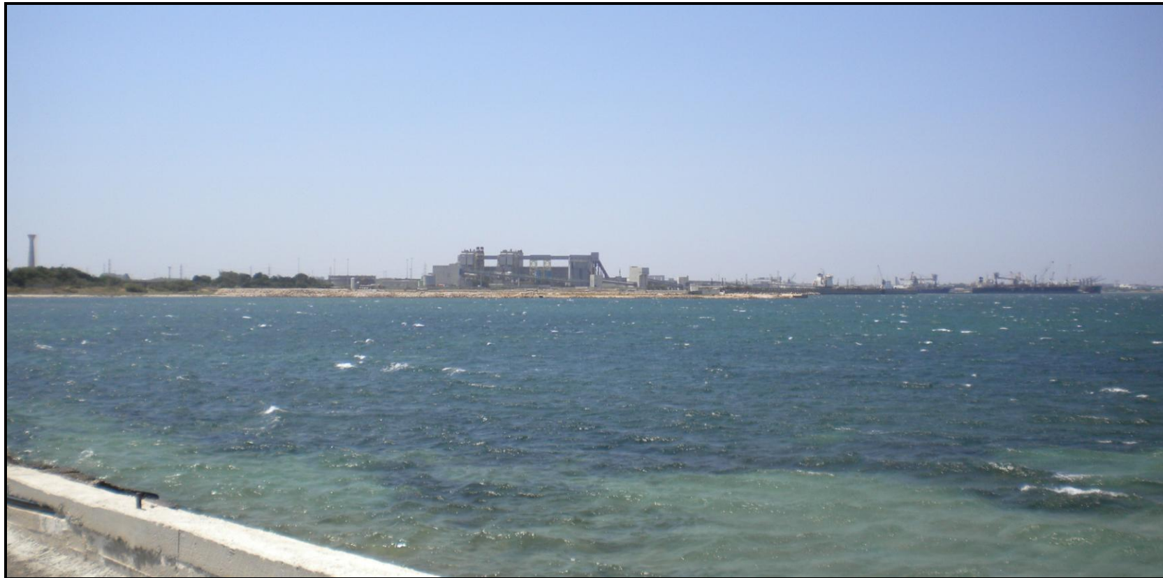
Fotoinserimenti da PV4 – Stato Progetto co-Combustione