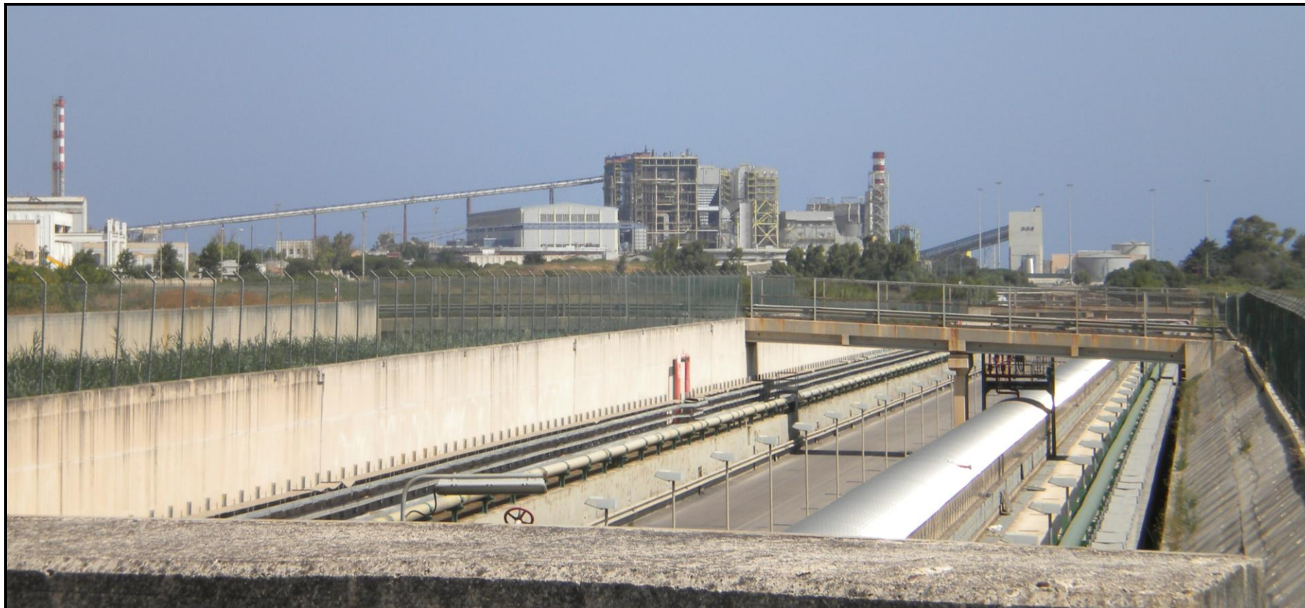
Fotoinserimenti da PV2, Strada per Pandi – Stato Progetto co-Combustione