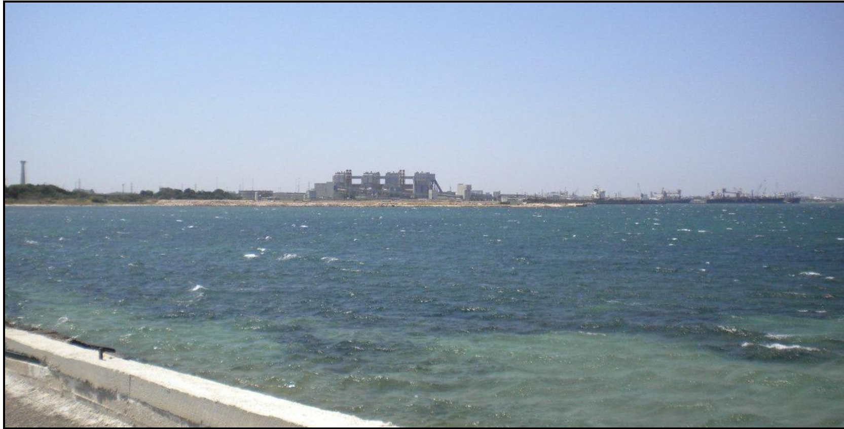
Figura D4.1.4e (2 di 2)