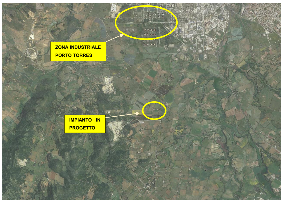
Figura 1: Inquadramento su ortofoto

L'impianto agro-voltaico denominato "Busia" è formato da un unico lotto ed è realizzato con struttura ad inseguimento monoassiale (trackers) al di sopra dei quali saranno installati pannelli fotovoltaici per una potenza complessiva di 20 MWp, e sarà realizzato su un terreno in area agricola (Zona E) di superficie di circa 34 ha totali, ricadente nel Comune di Sassari.