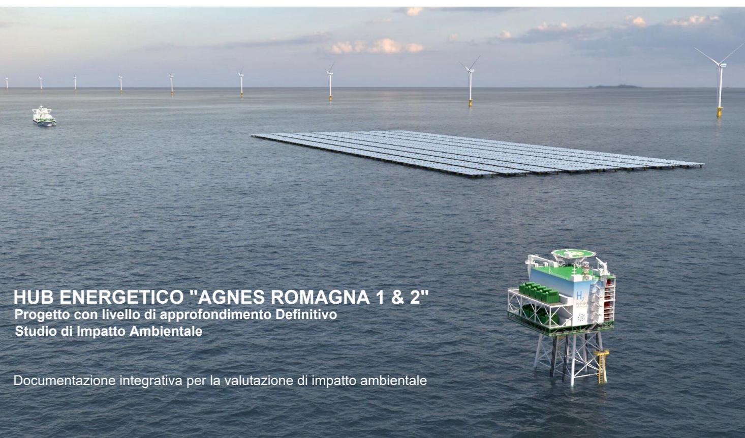
HUB ENERGETICO "AGNES ROMAGNA 1 & 2" Progetto con livello di approfondimento Definitivo Studio di Impatto Ambientale

Documentazione integrativa per la valutazione di impatto ambientale