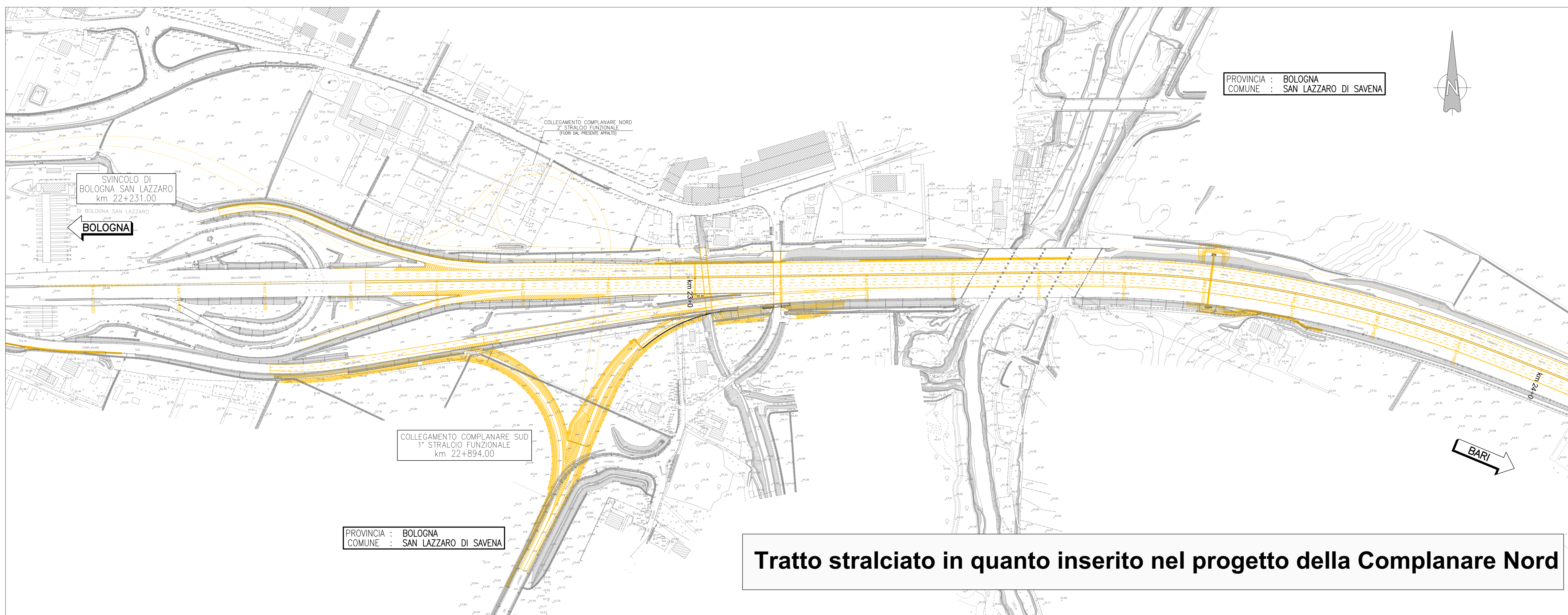
Tratto stralciato in quanto inserito nel progetto della Complanare Nord