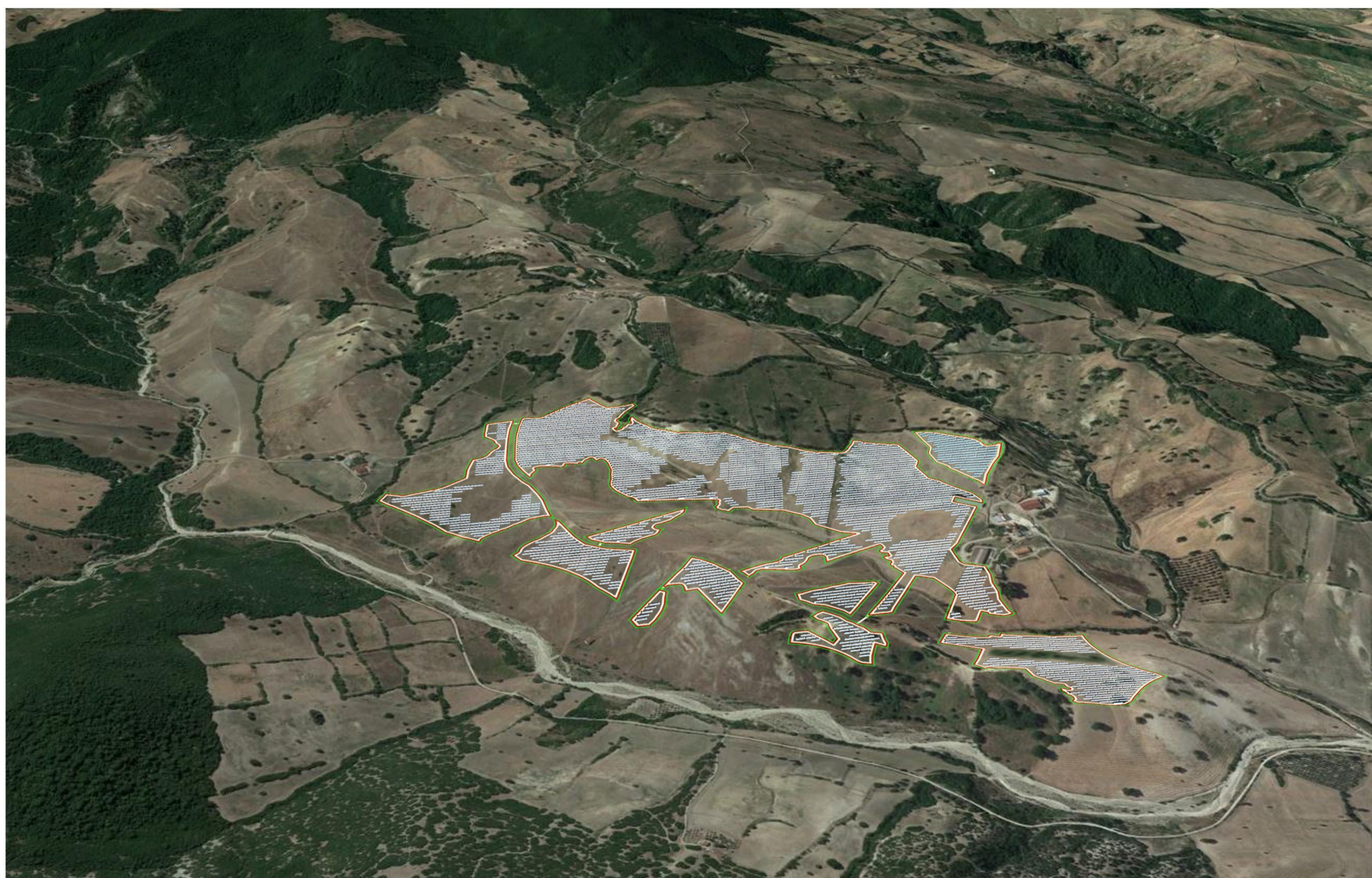
FOTOINSERIMENTO 3. AREA IMPIANTO VISTA DA NORD - POST OPERAM