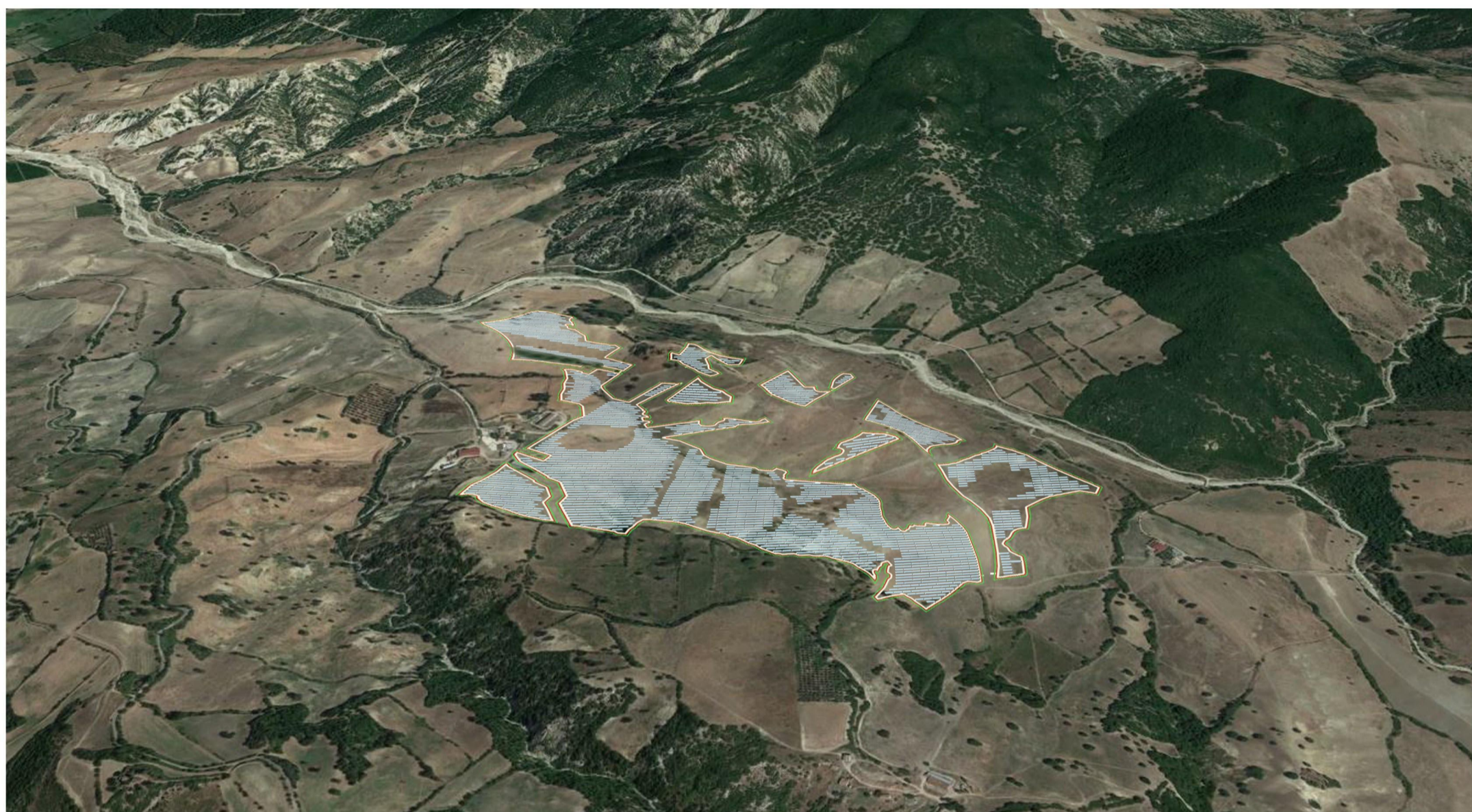
FOTOINSERIMENTO 2. AREA IMPIANTO VISTA DA SUD - POST OPERAM