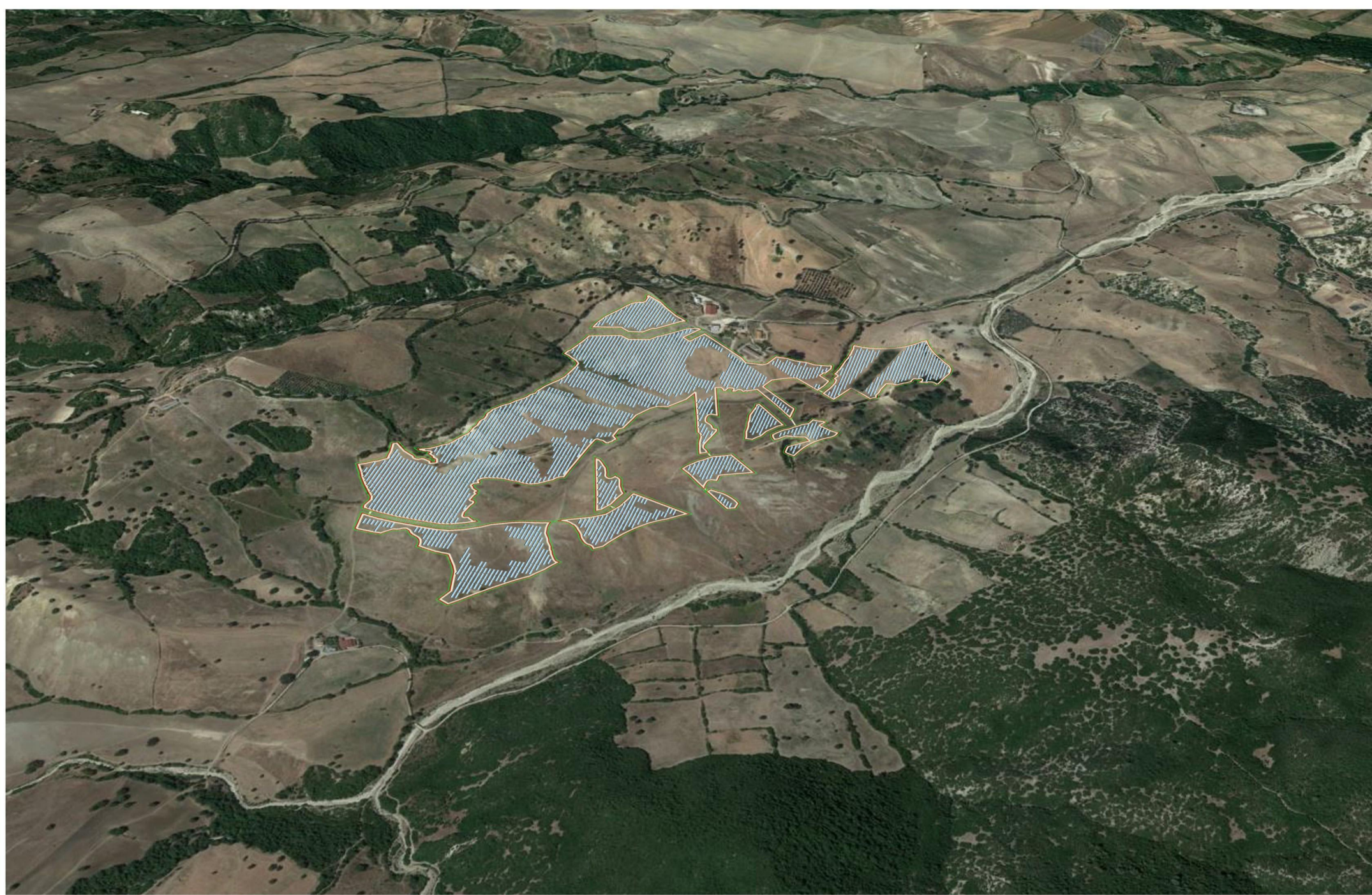
FOTOINSERIMENTO 1. AREA IMPIANTO VISTA DA EST - POST OPERAM