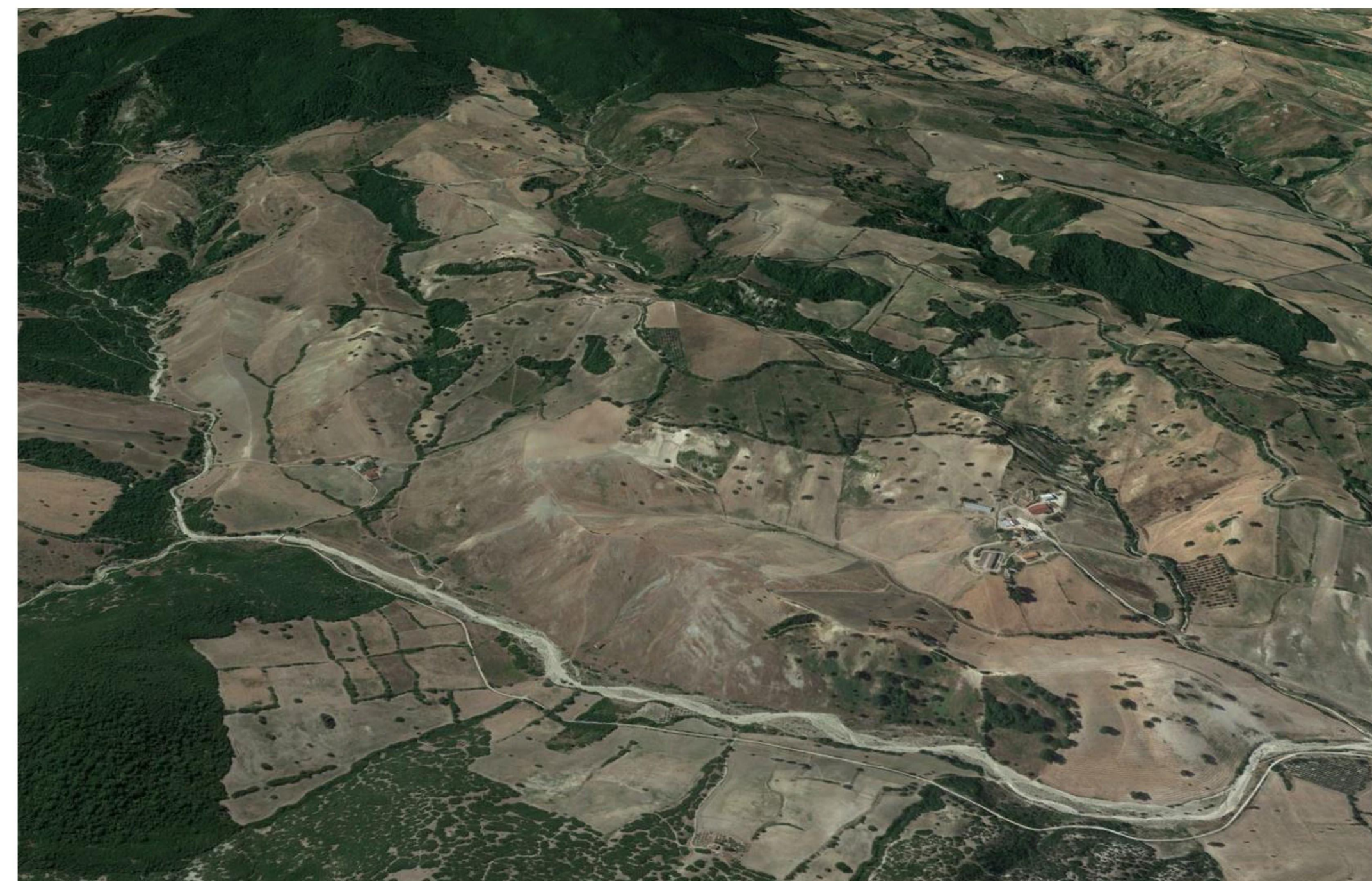
FOTOINSERIMENTO 3. AREA IMPIANTO VISTA DA NORD - ANTE OPERAM