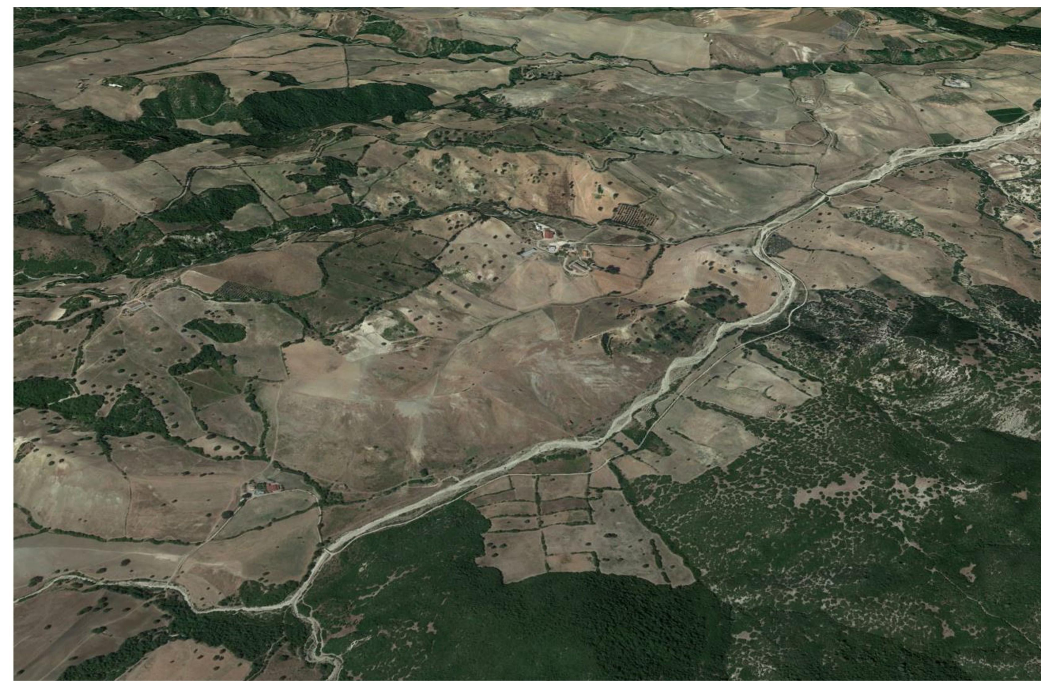
FOTOINSERIMENTO 1. AREA IMPIANTO VISTA DA EST - ANTE OPERAM