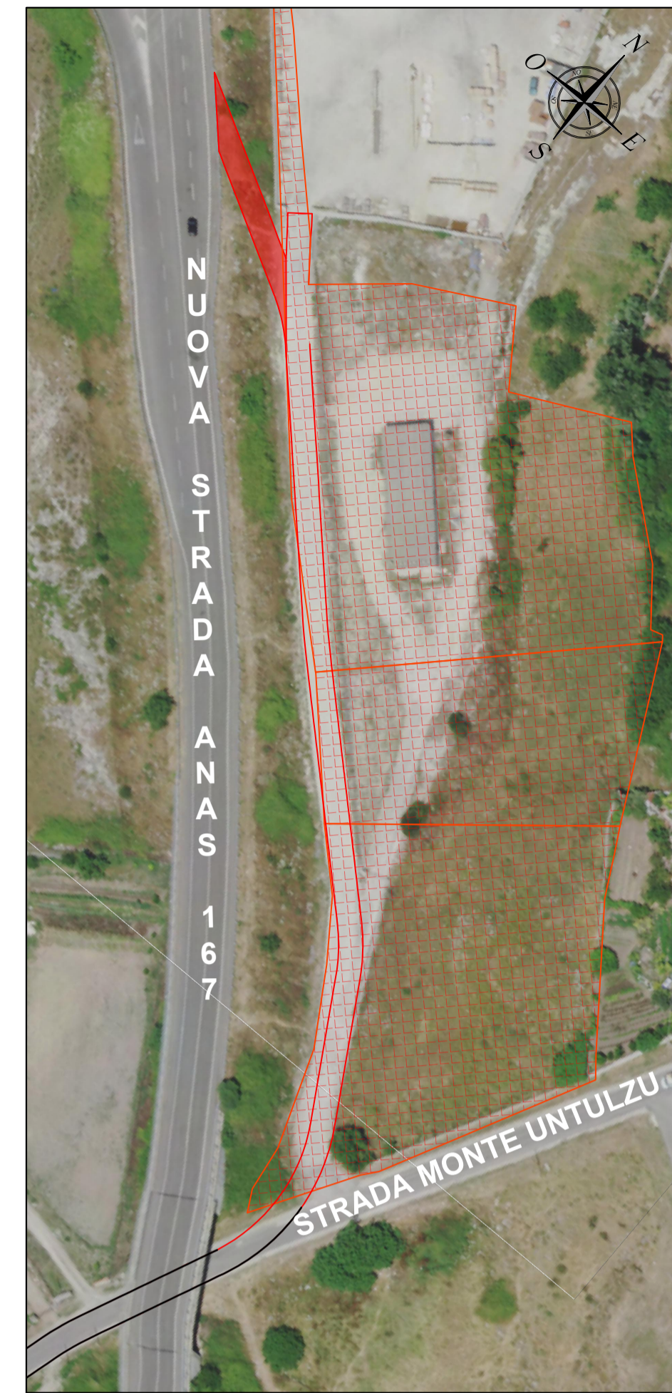
OB.17-18 - SCALA 1:1.000