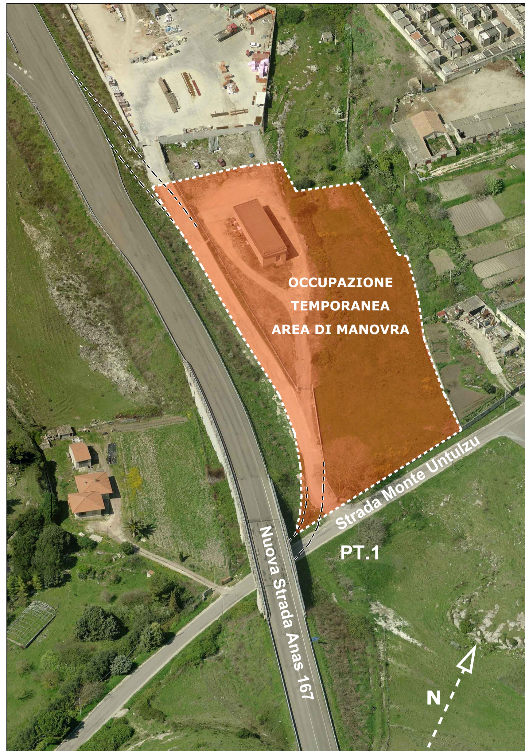
OB.17-18 - VISTA AEREA (OVEST)