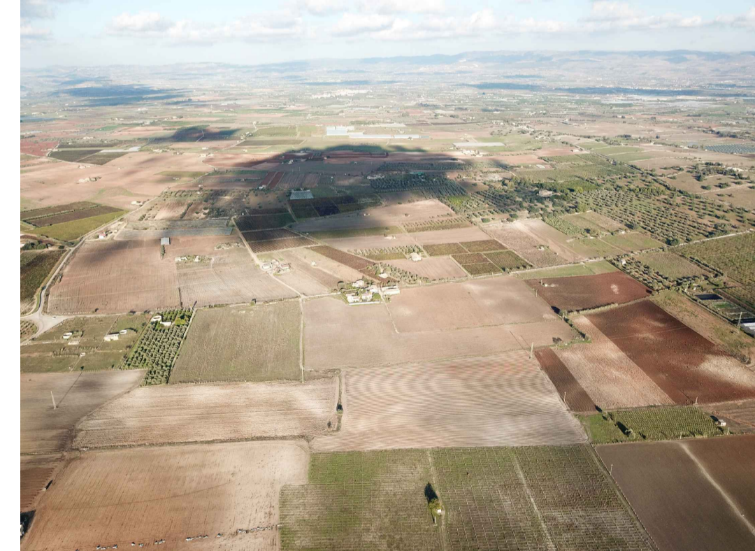
Punto di ripresa n°4 ante operam