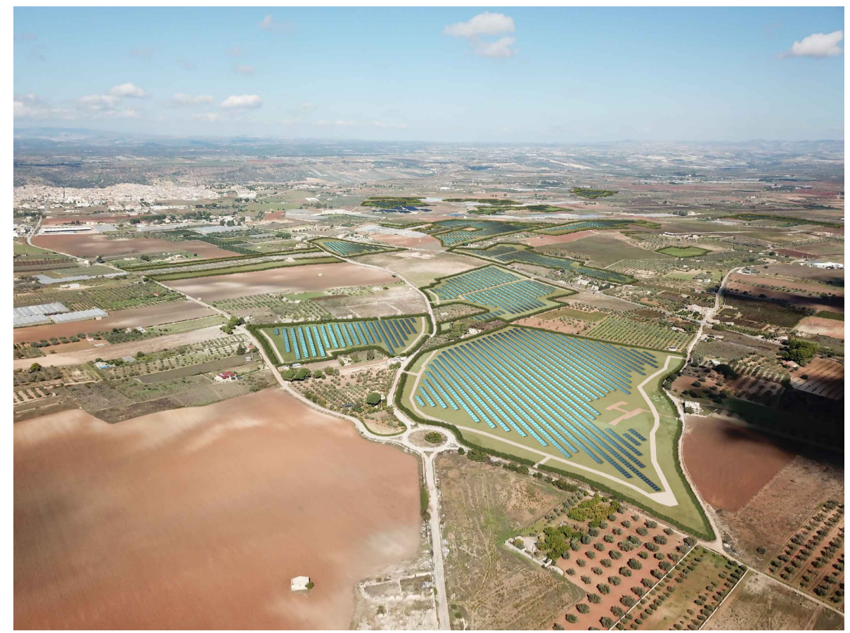
Fotosimulazione dell'impianto con moduli in silicio policristallino.