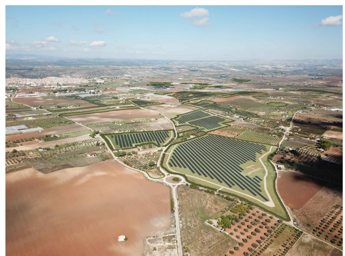
Fotosimulazione dell'impianto con moduli con tecnologia antiriflesso in silicio monocristallino.

Inquadramento territoriale su ortofoto dell'area d'impianto e degli impianti esistenti, autorizzati e in fase di autorizzazione nel raggio di 10 km. Scala 1:80.000