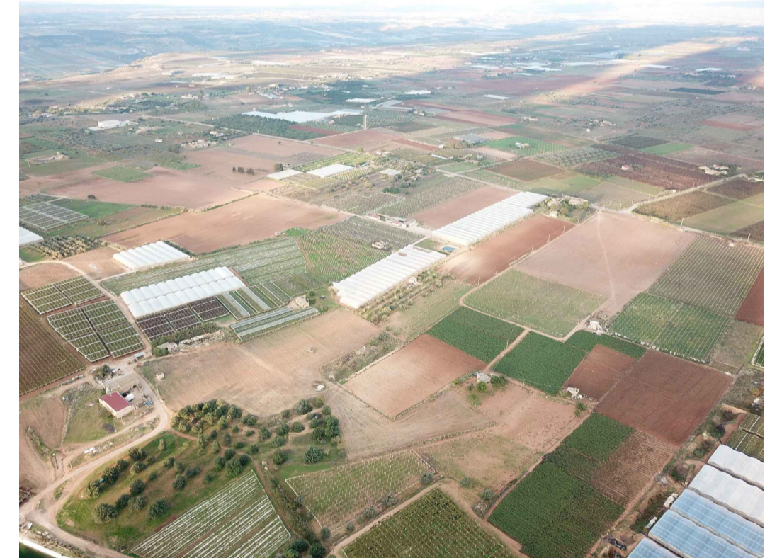
Punto di ripresa n°3 ante operam