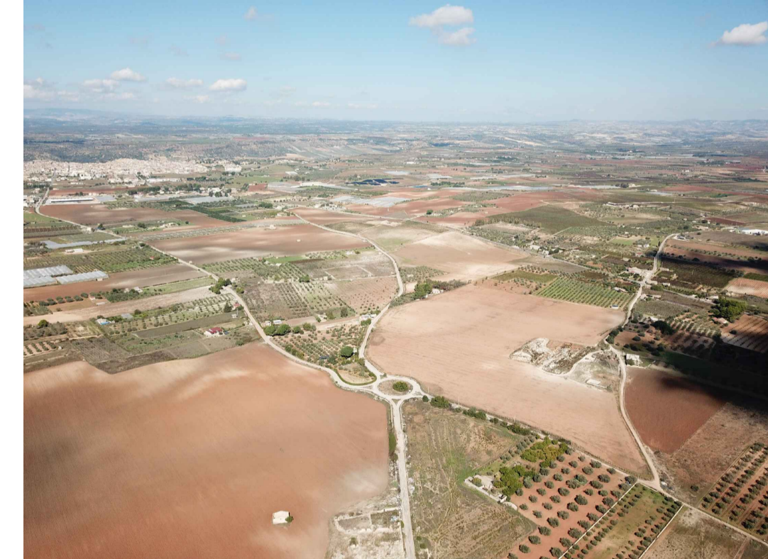
Punto di ripresa n°2 ante operam