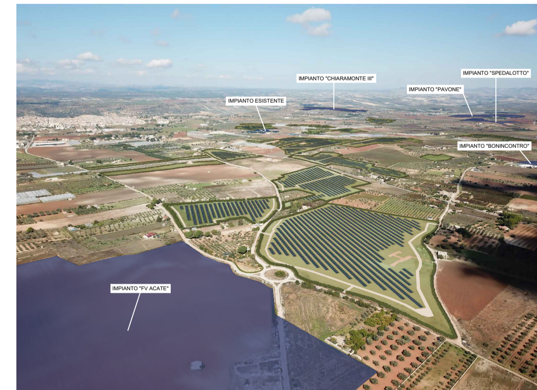
Punto di ripresa n°2 post operam con cumulo impianti "FV-Acate", "Bonincontro", "Spedalotto", "Pavone", "Chiaromonte III" e impianto esistente.