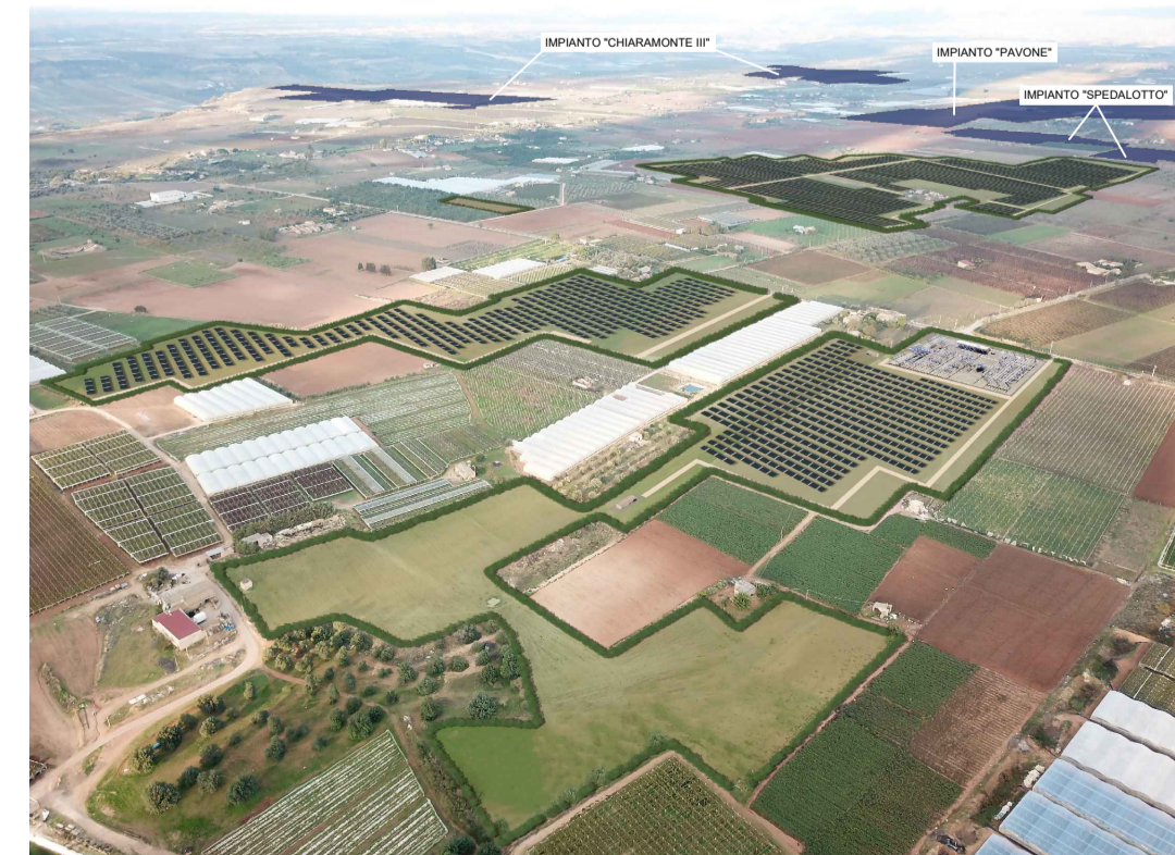
Punto di ripresa n°3 post operam con cumulo impianti "Spedalotto", "Pavone" e "Chiaromonte III".