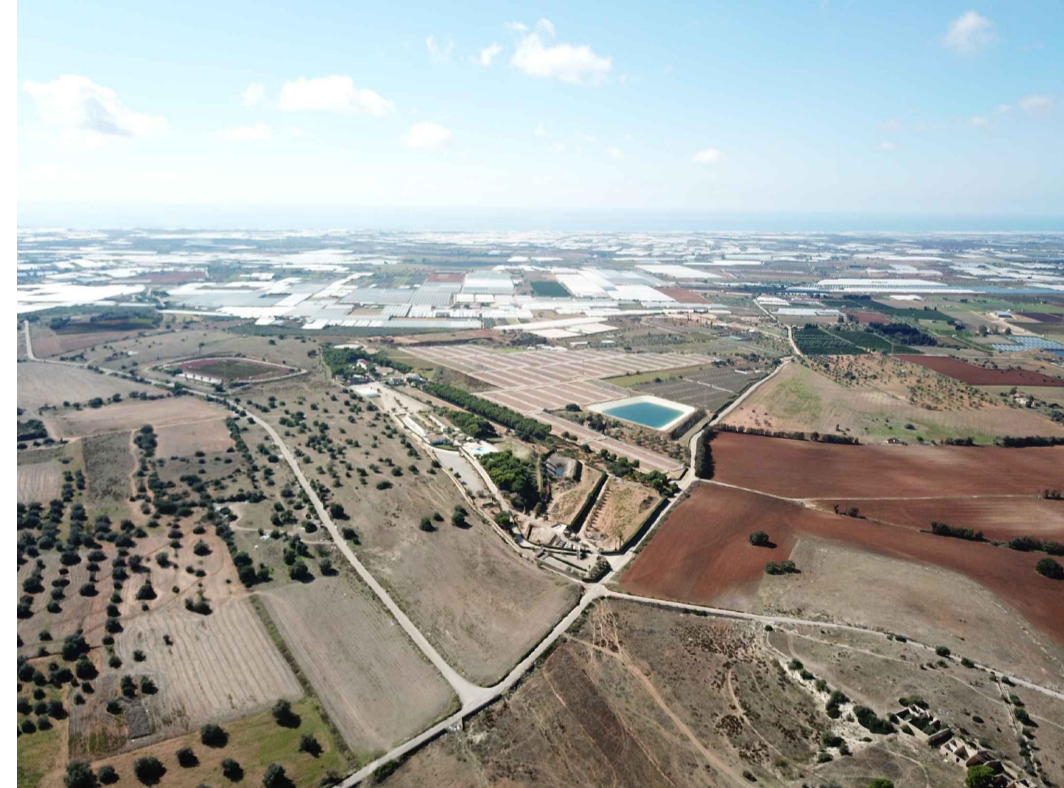
Punto di ripresa n°1 ante operam

Inquadramento territoriale su ortofoto dell'area d'impianto e degli impianti esistenti, autorizzati e in fase di autorizzazione nel raggio di 10 km. Scala 1:80.000