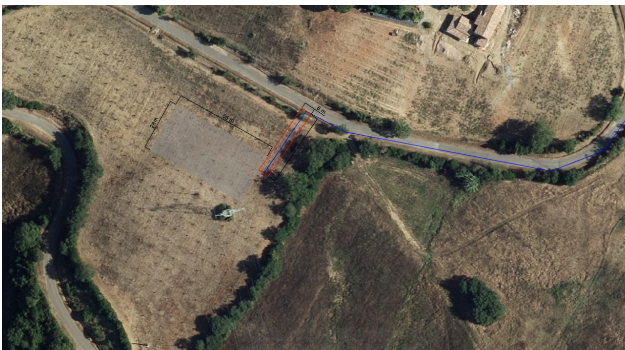
Figura 3 – Sovrapposizione area sottostazione (in grigio) e elettrodotto di connessione (in blu) nel tratto su terreno naturale su foto area

Coordinate dei vertici dell'area, in coordinate Gauss Boaga, partendo dal vertice in alto e ruotando verso destra: