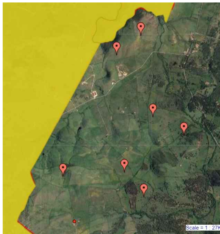
Zoom su WTG