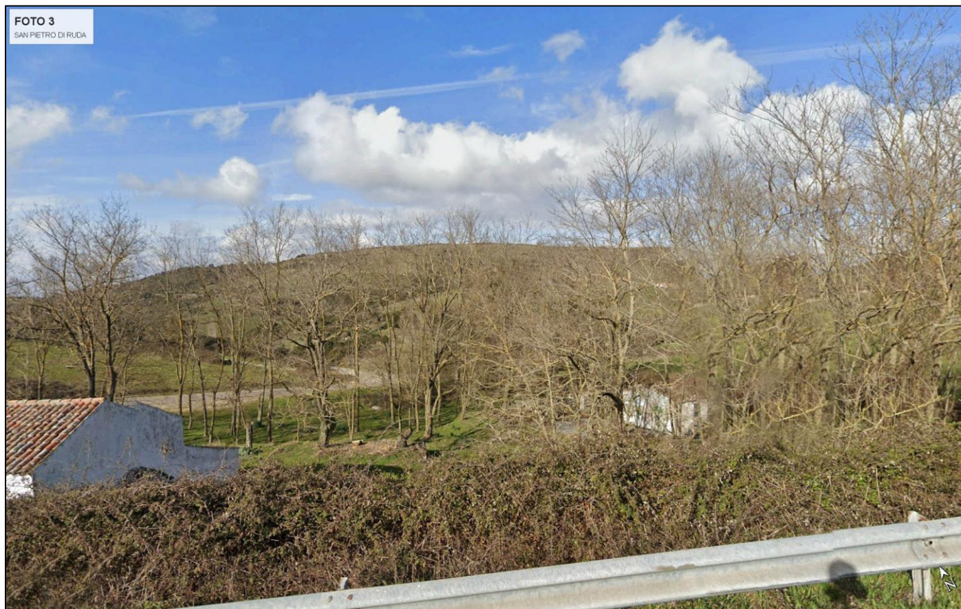
Foto3 – Post Operam