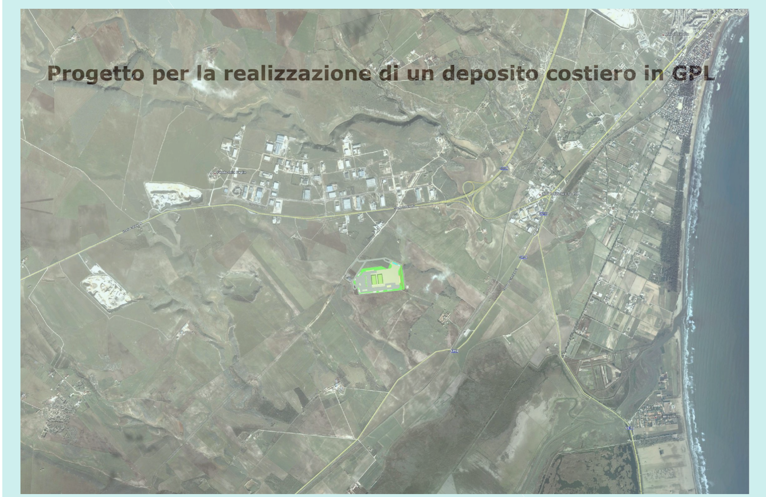
Progetto per la realizzazione di un deposito costiero in GPL