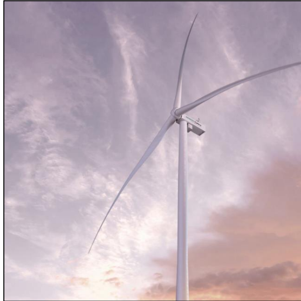
Figura 1: Aerogeneratore

L'area in cui ricade l'intervento proposto si trova nei comuni di Esterzili, Escalaplano e Seui (Sud Sardegna), a circa 4,3 km in direzione Nord del centro urbano di Escalaplano, a circa 5,2 km a Nord-Nord-Ovest dal centro abitato di Perdasdefogu, a circa 6,0 km in direzione Est dal centro urbano di Orroli, a circa 7,0 km in direzione Est dal centro urbano di Nurri ed a circa 8,3 km a Sud dal centro abitato di Esterzili. Si prevede il loro collegamento alla rete elettrica nazionale tramite l'esistente cabina primaria di Ulassai, distante circa 10 km in linea d'aria dall'impianto. Il cavidotto di collegamento alla cabina primaria correrà completamente lungo strade esistenti; attraverserà per un brevissimo tratto la strada SP 13, transiterà per una stradina interpodereale esistente per circa 20 km, quindi si imbrocherà un'altra strada sulla sinistra percorrendola per circa 1 km, quindi si svolterà a destra fino a giungere a un'altra strada interpodereale, quindi si proseguirà diritto imboccando una strada interpodereale percorrendola per circa 1 km fino ad arrivare all'area di progetto.