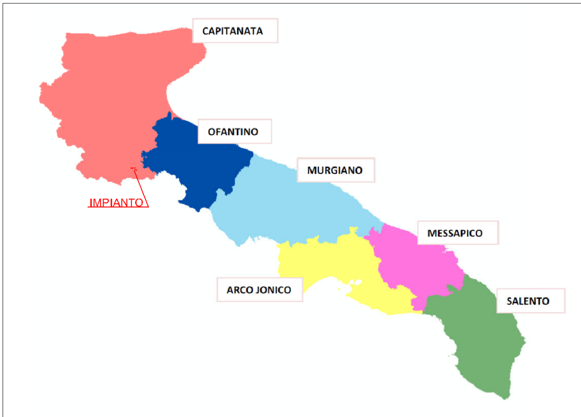
Inquadramento IMPIANTO su Ambiti Territoriali di Caccia (ATC)