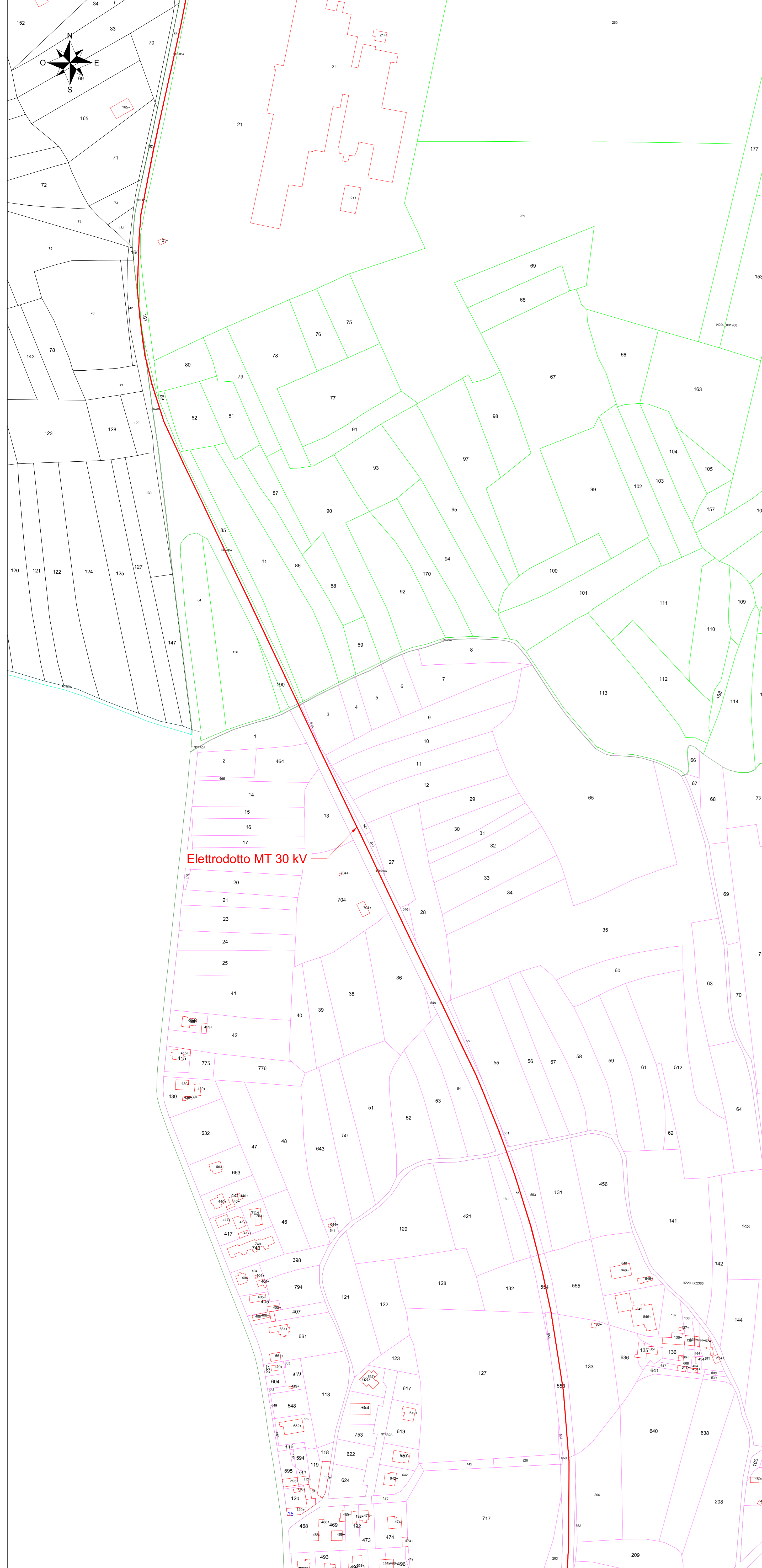
Vista C - Scala 1:2.000