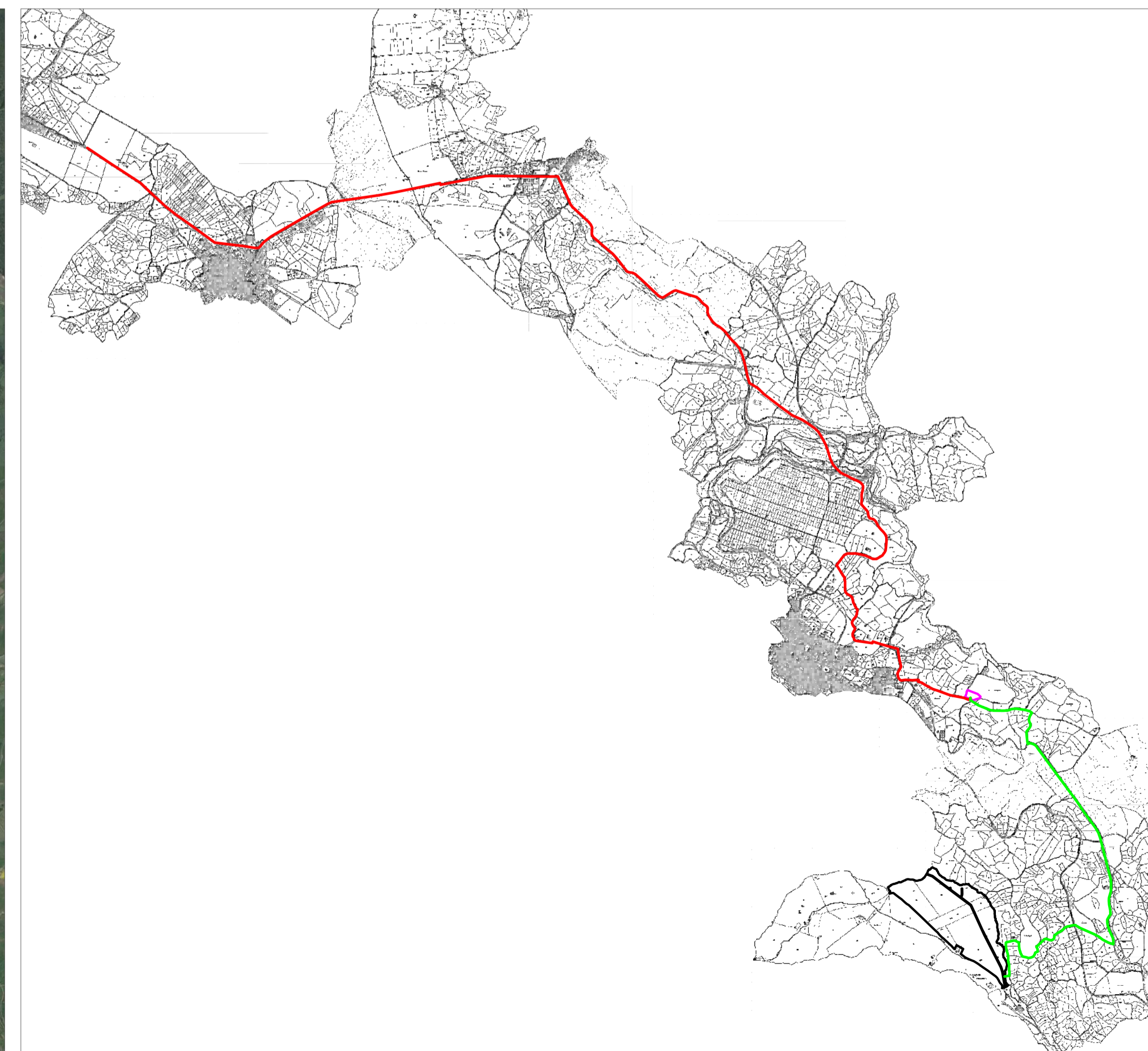
INQUADRAMENTO SU BASE CATASTALE - SCALA 1: 40.000