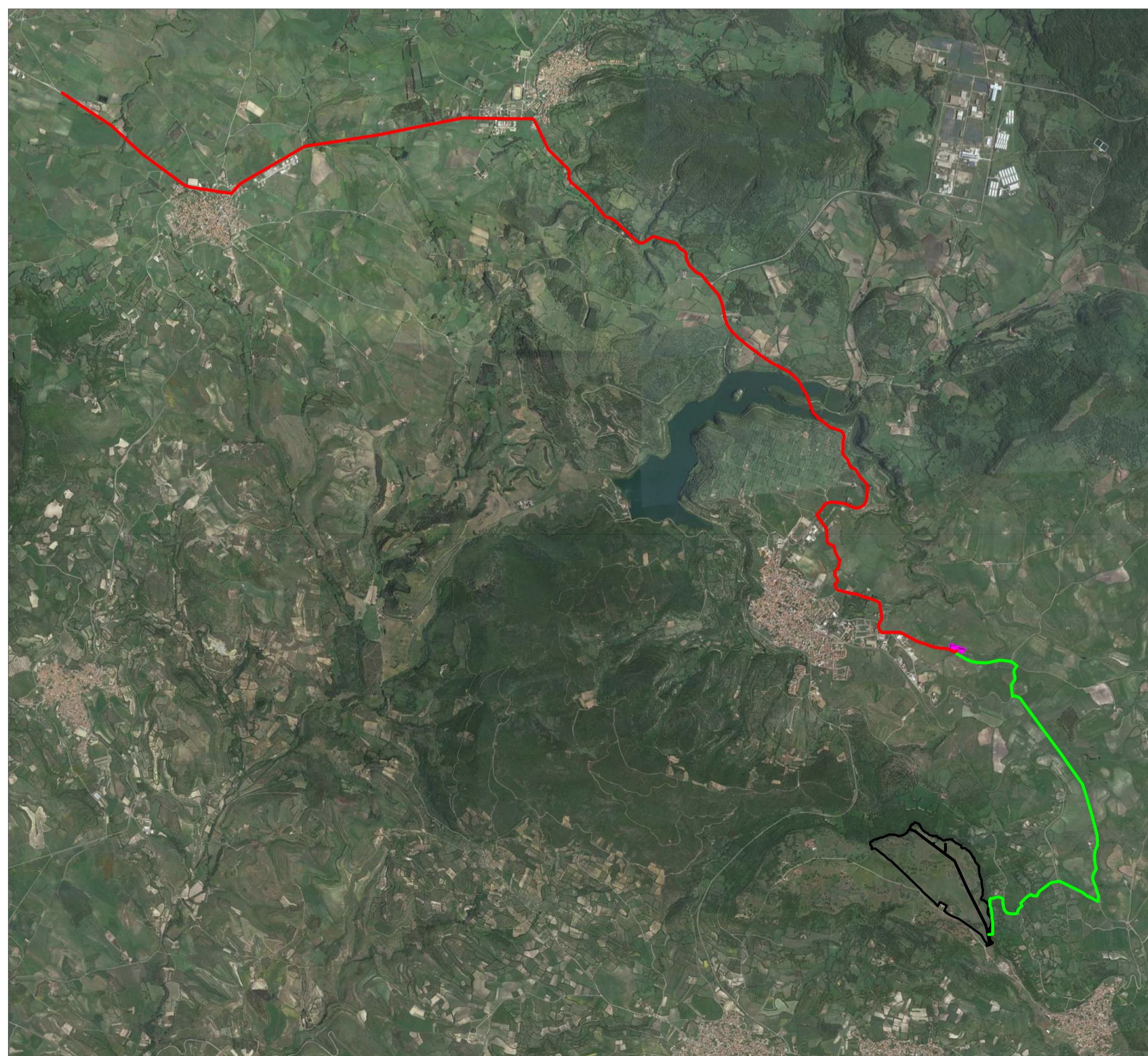
INQUADRAMENTO SU BASE ORTOFOTO - SCALA 1: 40.000