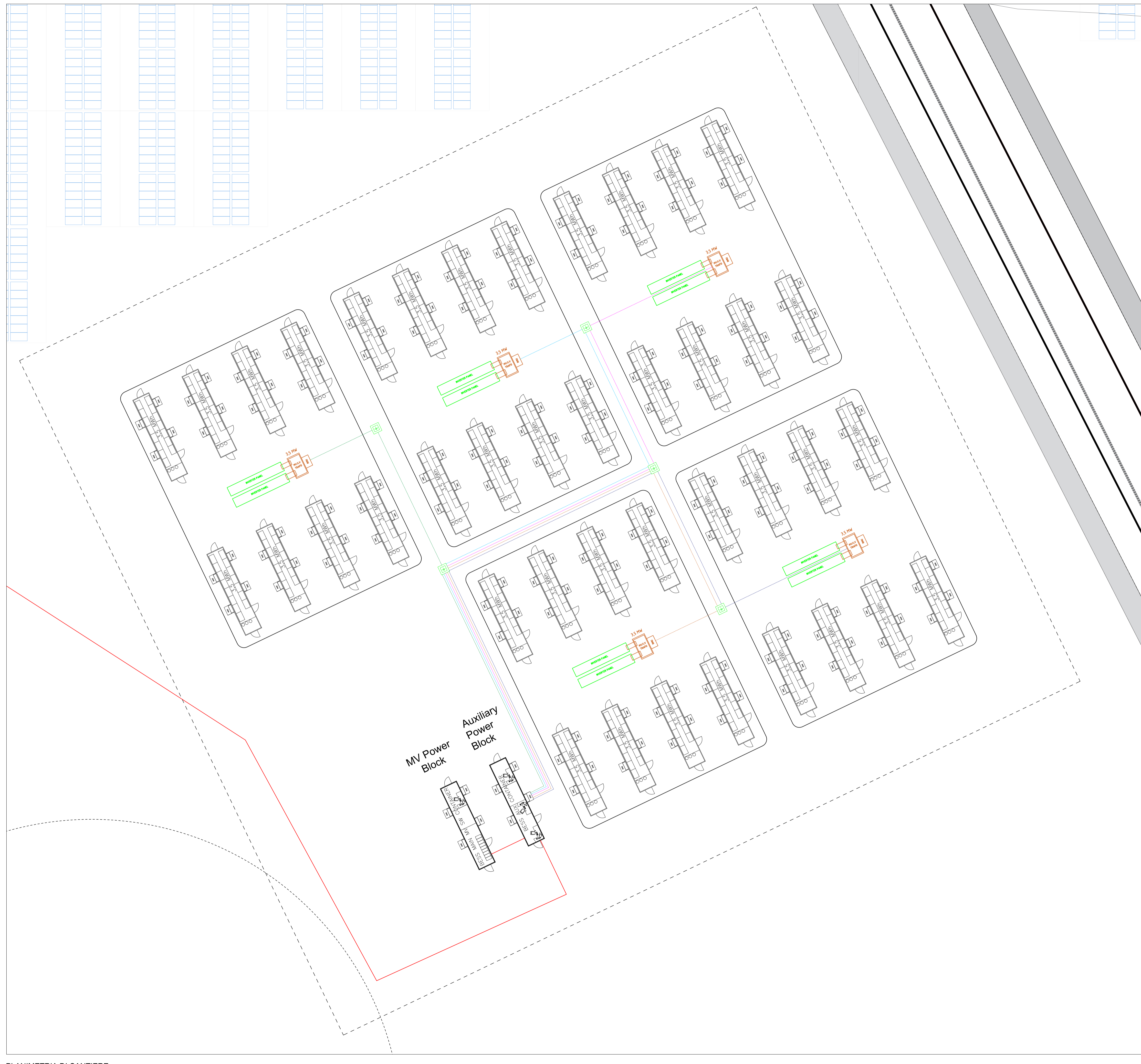
PLANIMETRIA DI CANTIERE