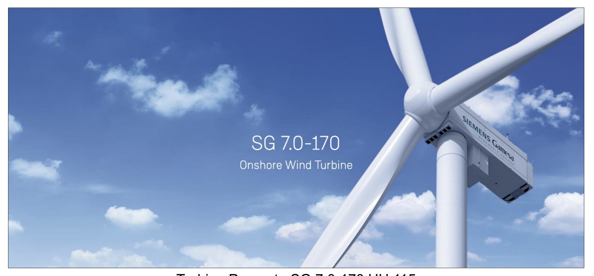
Turbina Proposta SG 7.0-170 HH 115