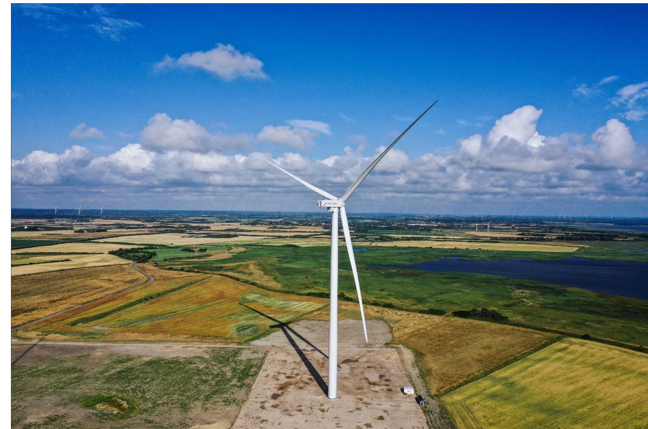
Turbina Siemens Gamesa SG 170 da 6.6 MW a Høvsøre n Danimarca