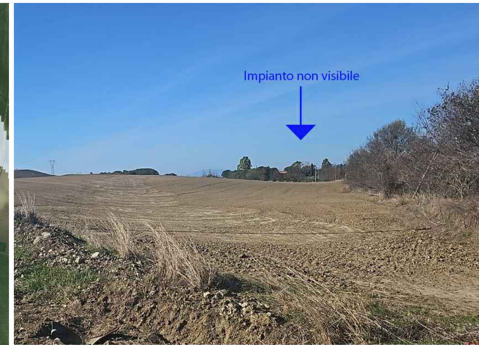
Il sito "Castel Ghezzo" non è censito dalle Tavole del PTPR come probabile sito archeologico; inoltre, dallo studio di intervisibilità effettuato, l'area in oggetto non risulta essere visibile come riportato dalla foto sovrastante.