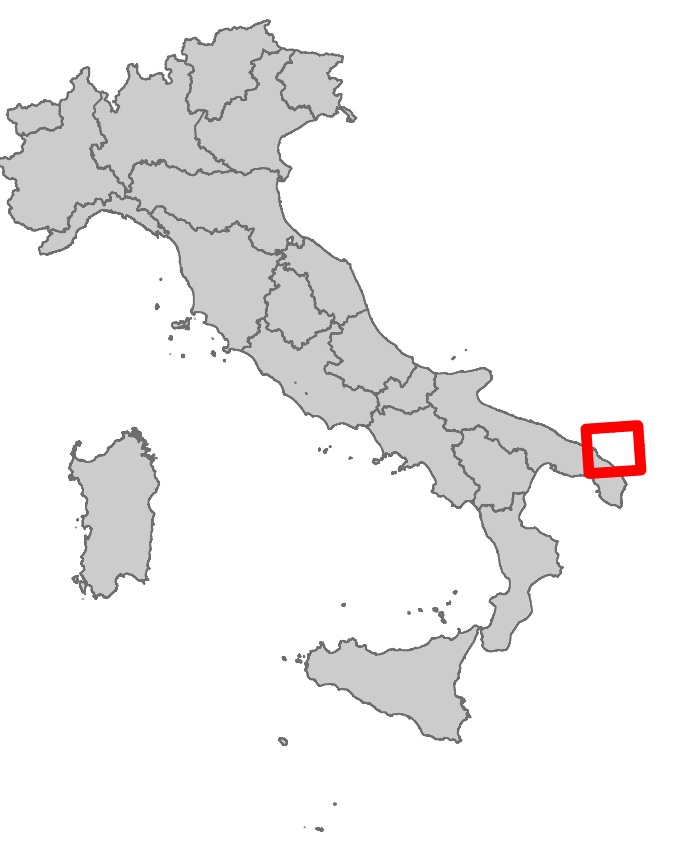
KEY MAP 1:12,000,000