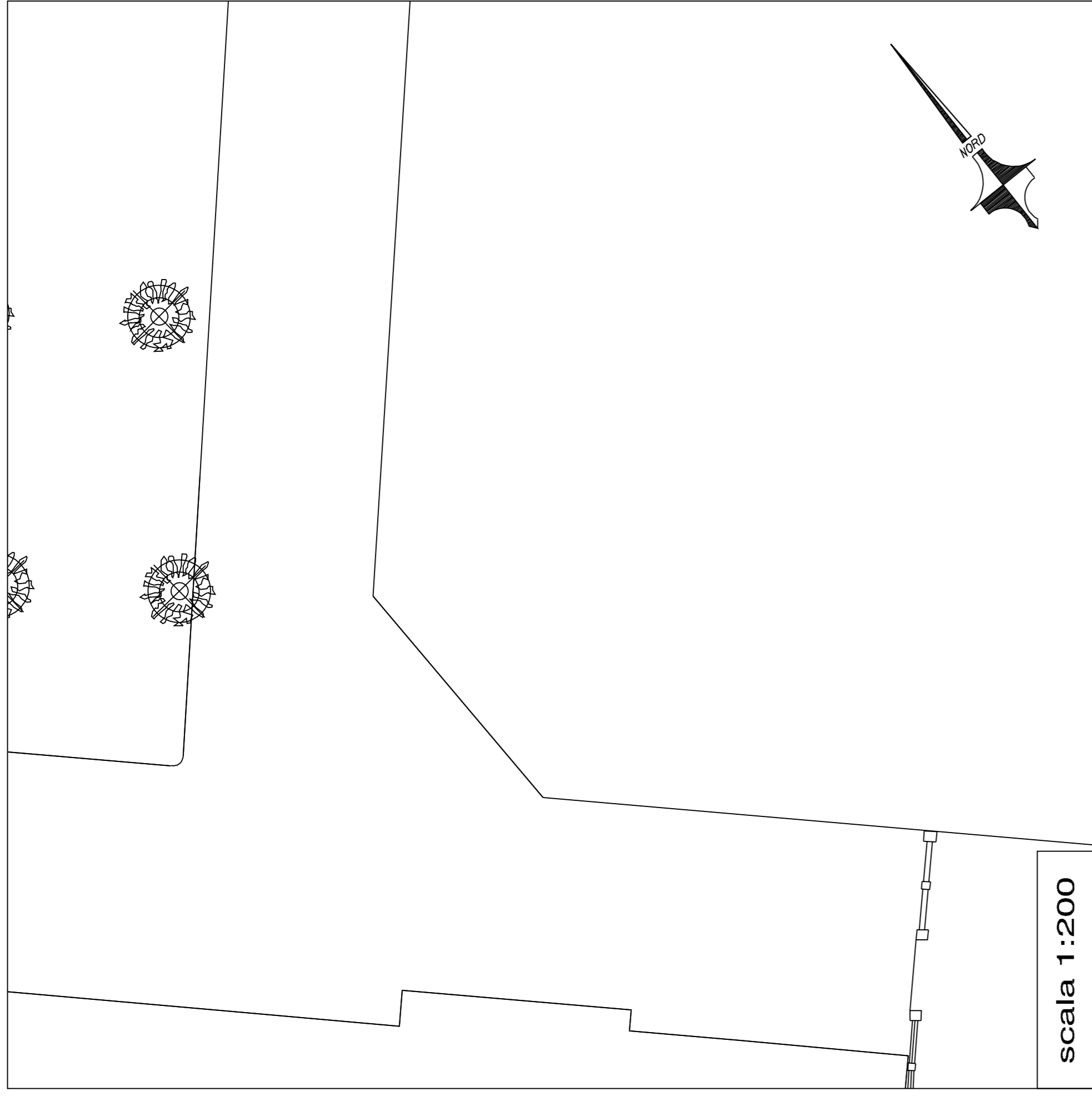
PLANIMETRIA STATO ATTUALE