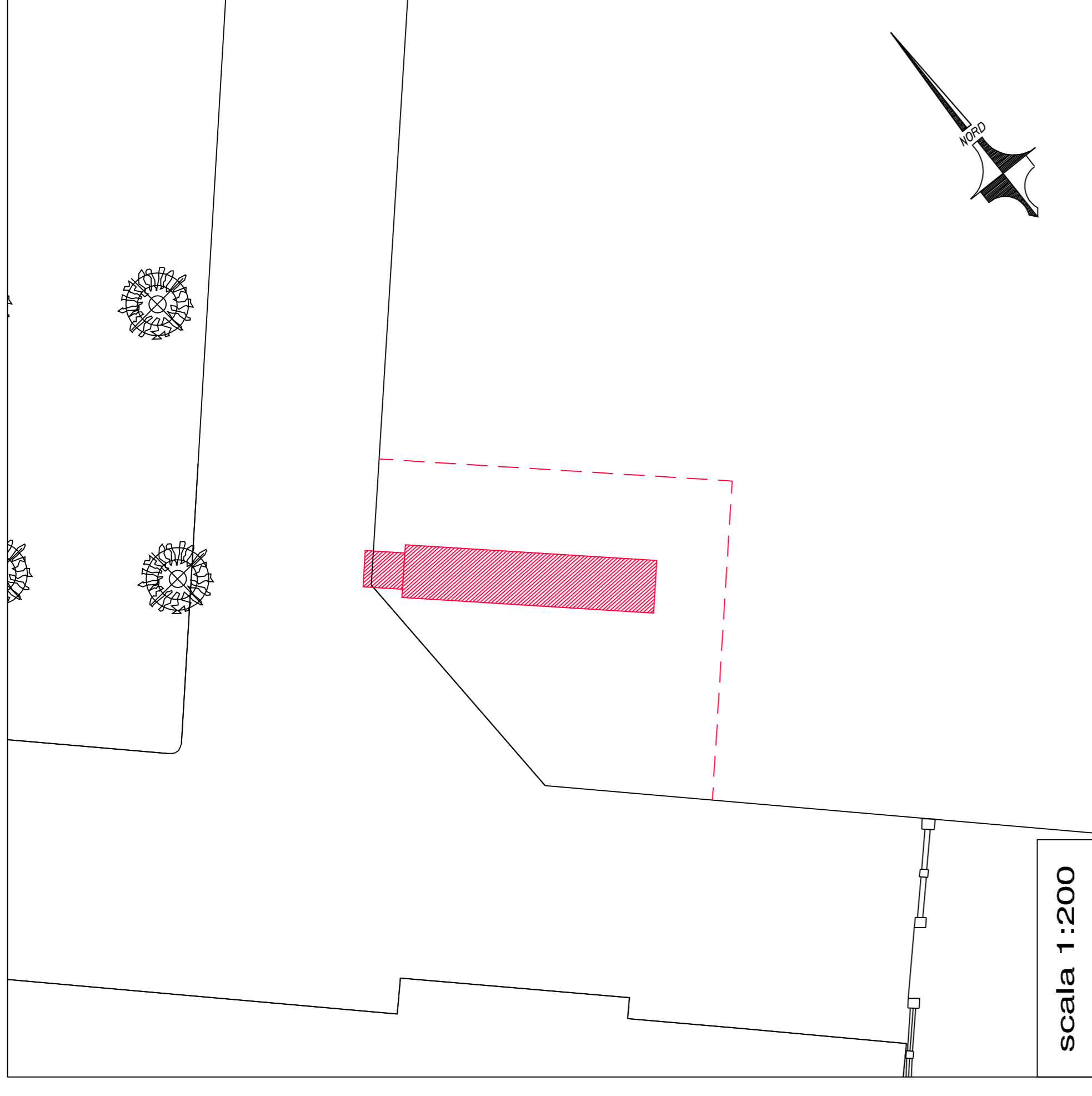
PLANIMETRIA STATO DI RAFFRONTO