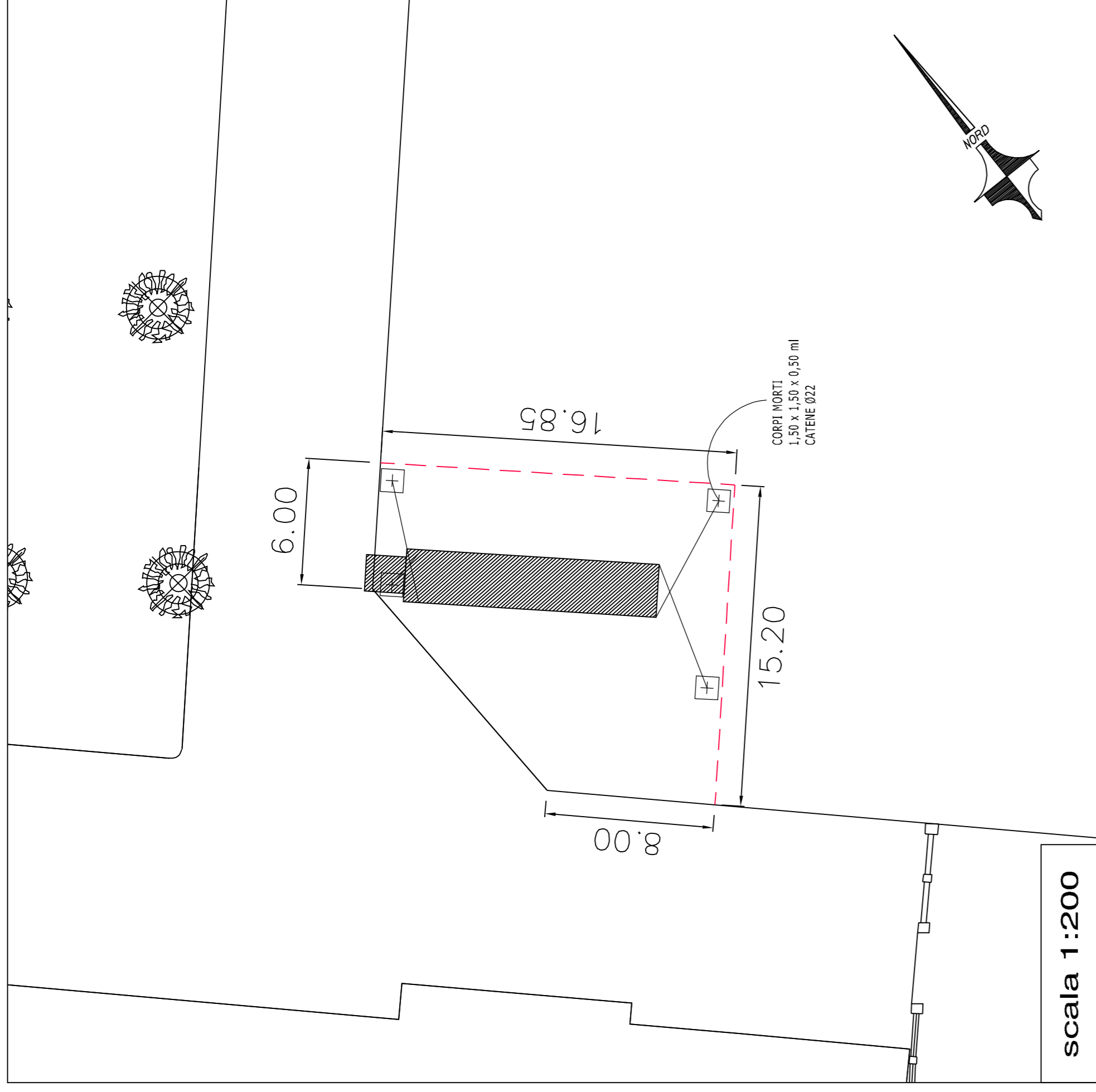
PLANIMETRIA STATO DI PROGETTO