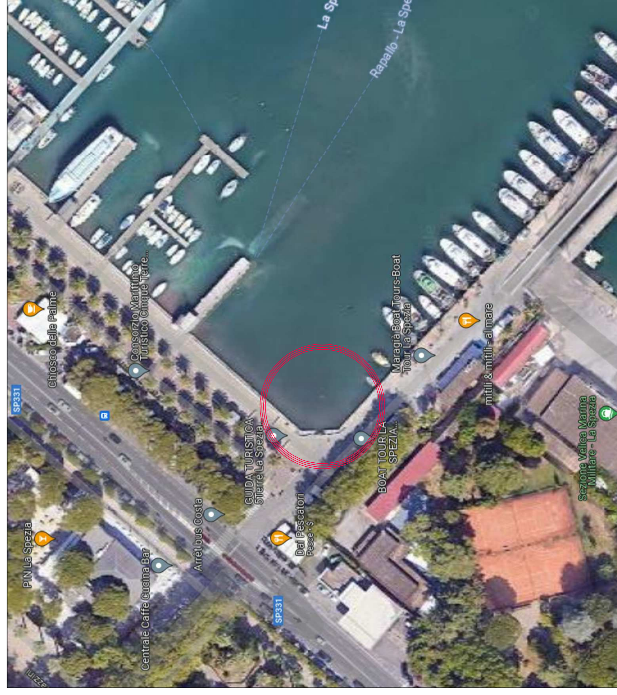
INQUADRAMENTO SU FOTO SATELLITARE