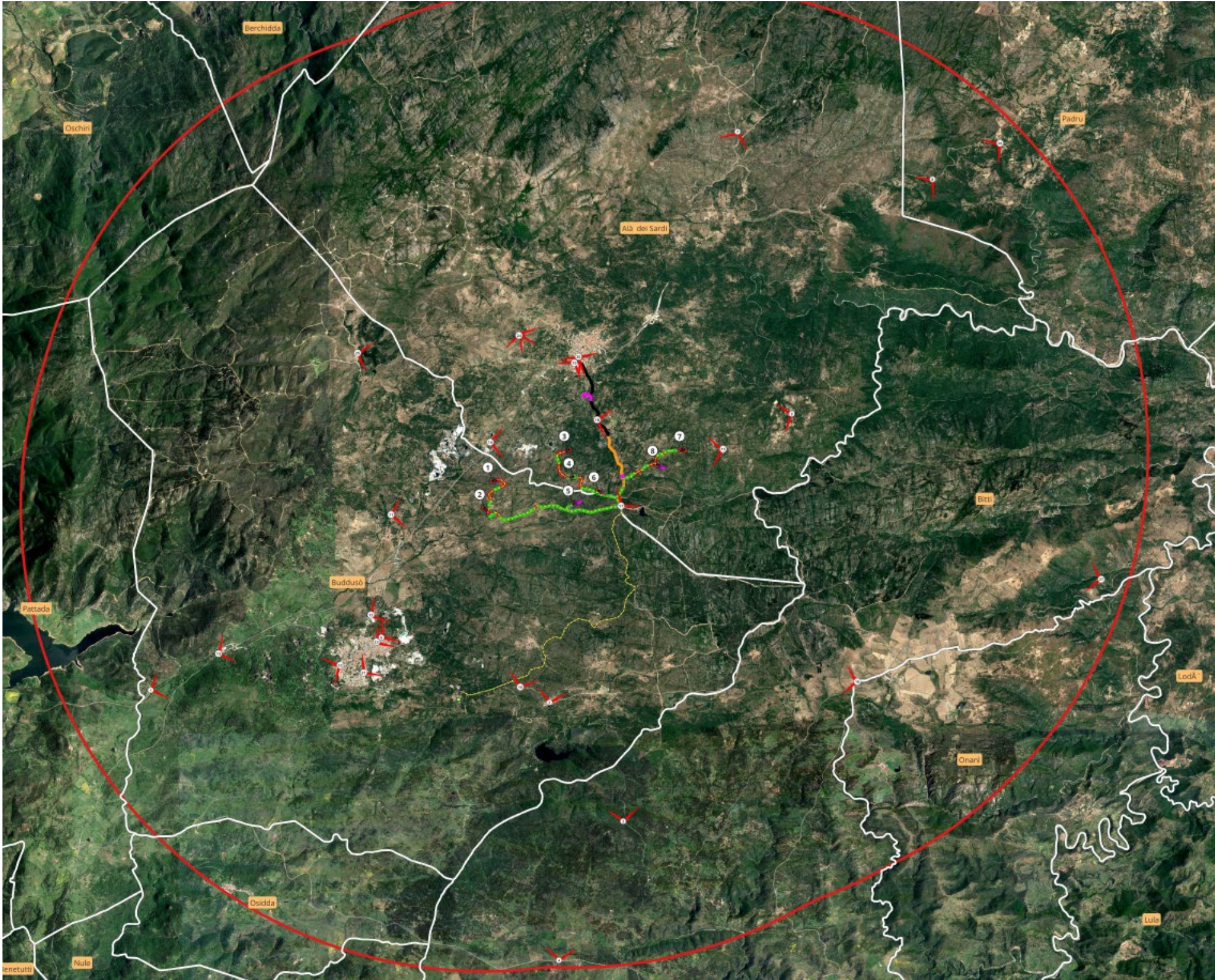
Figura 1 - Stralcio della tav. 2.18 "mappa dei punti di ripresa fotografica su base ortofoto"