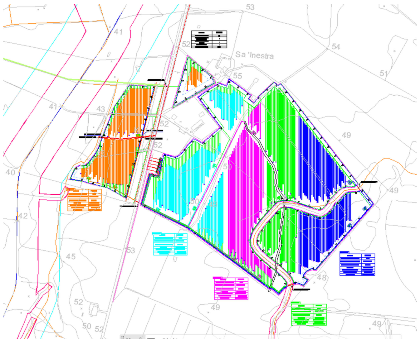
Fig. 2 Area d'impianto con individuazione settori

L'accesso alle varie aree dell'impianto avverrà dalla Strada Provinciale n.42 "Dei Due Mari".