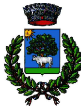
COMUNE DI ORUNE