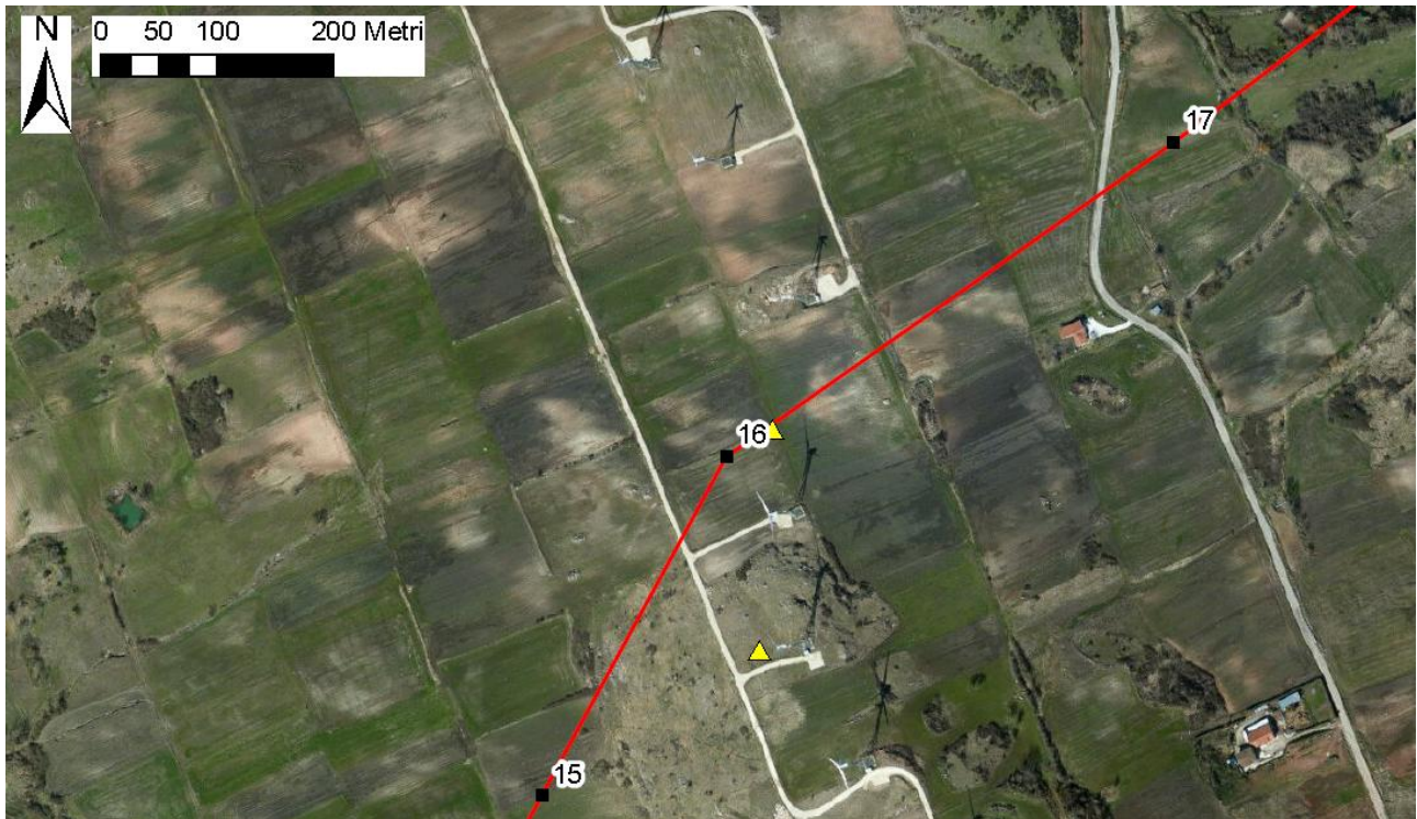
Figura 1 Coordinate indicate nel documento del Prof. Listanti (triangoli gialli) come torri eoliche sul progetto

In sede di redazione del progetto TERNA ha effettuato un'indagine per censire le torri eoliche esistenti, in iter autorizzativo ed autorizzate. Le coordinate fornite dal Prof. Listanti non coincidono con nessuna di esse.