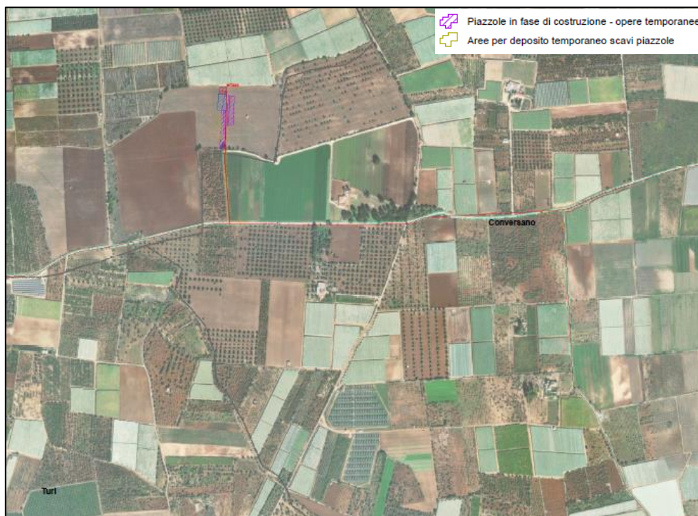
Figura 2 - Inquadramento aree di cantiere WTG03