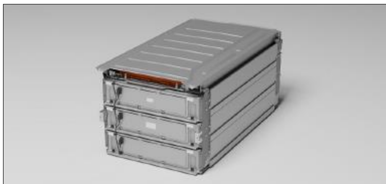
Figura 4 - Battery Module

Ciascun modulo batteria, include un modulo inverter integrato per la conversione dell'alimentazione CC/CA. I moduli batteria sono collegati in parallelo, ciascuno con una connessione CA e uscita di comunicazione. I moduli non richiedono alcun assemblaggio o regolazione sul campo e possono essere sostituiti solo dall'assistenza Tesla o da un fornitore di servizi terzo approvato.