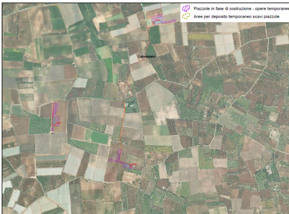
Figura 3 - Inquadramento aree WTG04, 05, 06