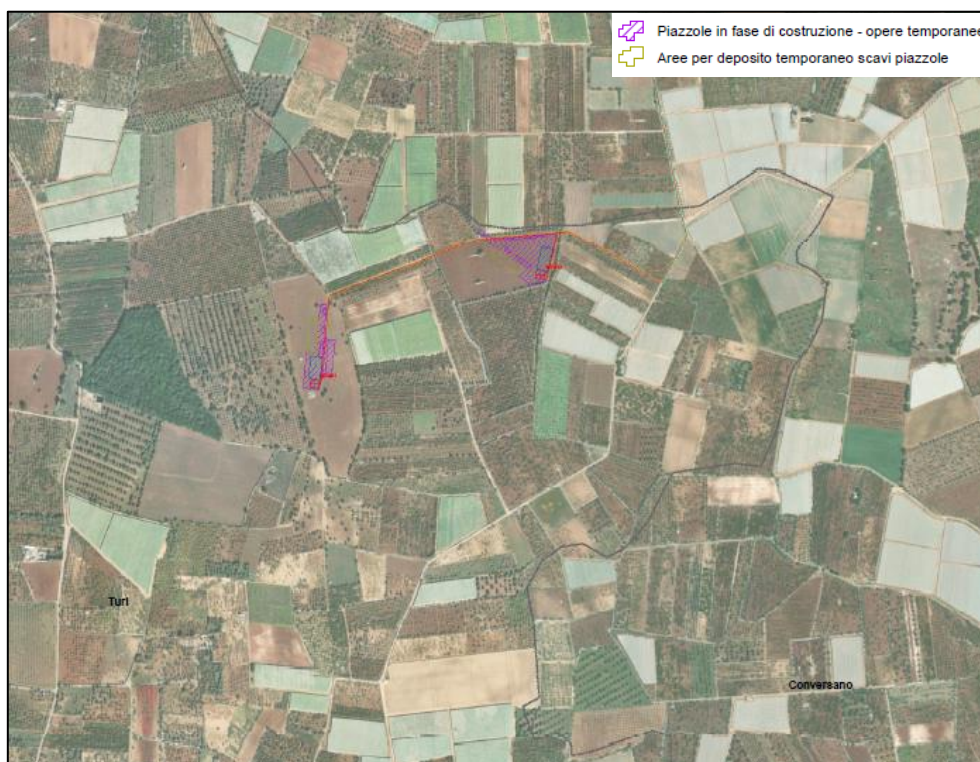
Figura 1 - Inquadramento aree di cantiere WTG01, 02