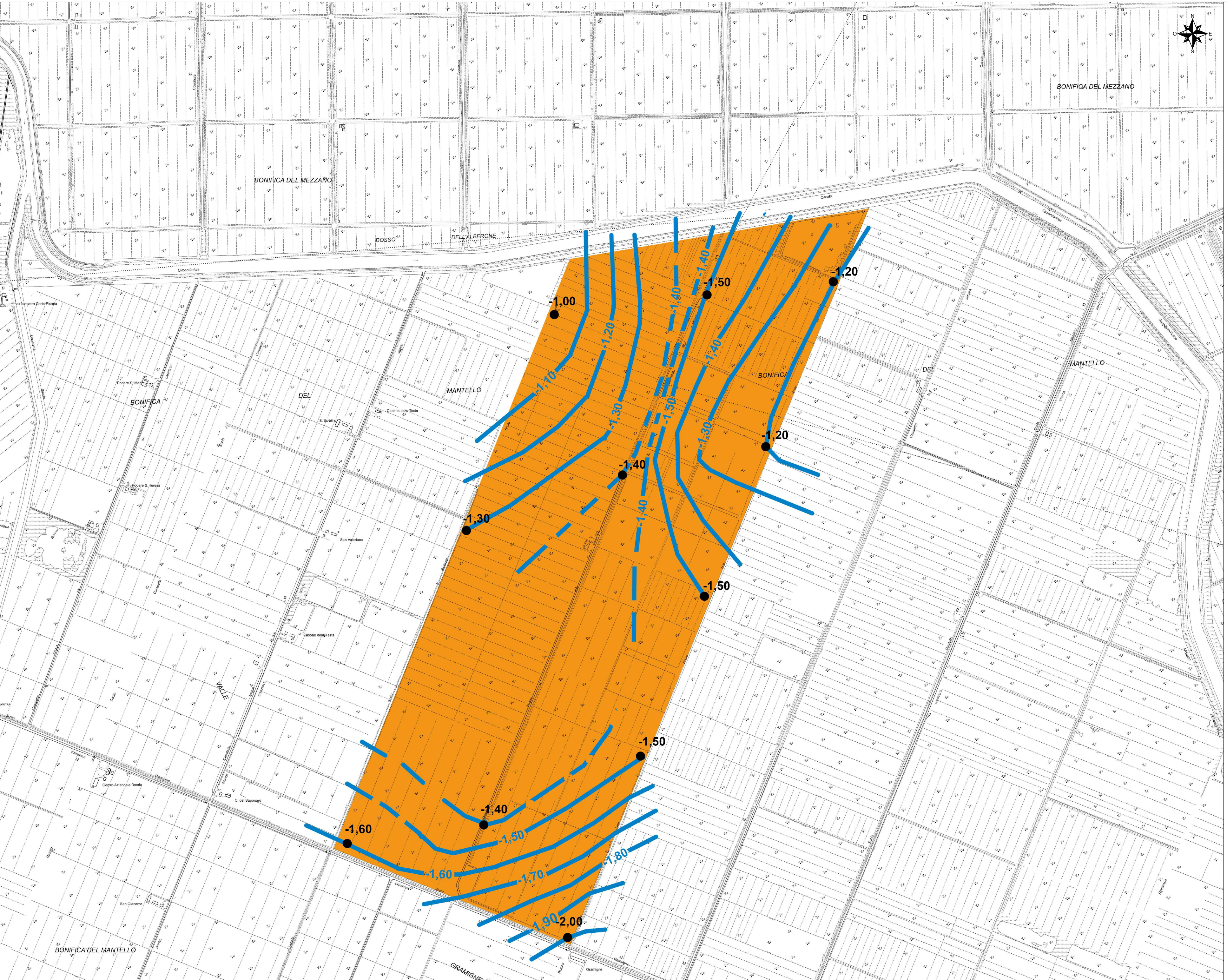
CARTA DELLE ISOBATE (livello della falda espresso in metri dal p.c. rilevato nelle indagini svolte a luglio/agosto 2023)