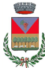
COMUNE DI ORGOSOLO