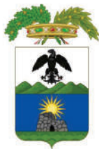
PROVINCIA DI NUORO