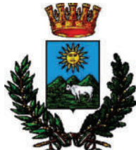
COMUNE DI NUORO