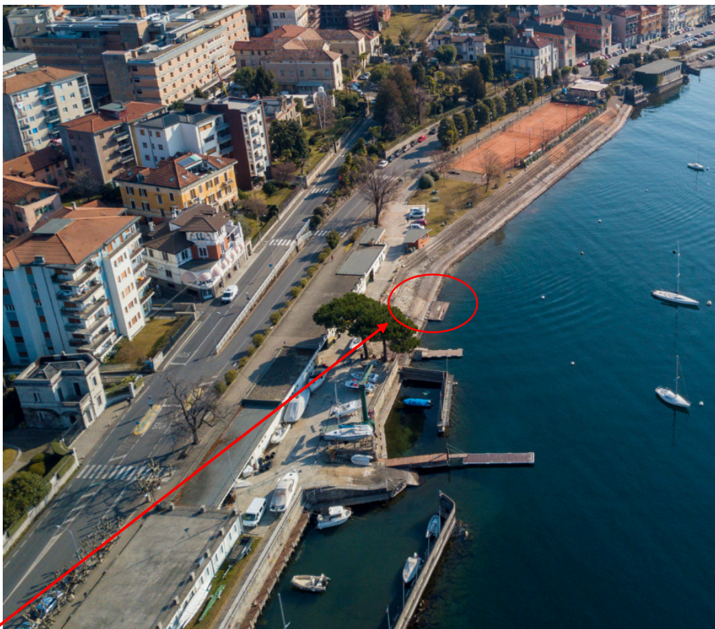
Immagine 2, pontile societario