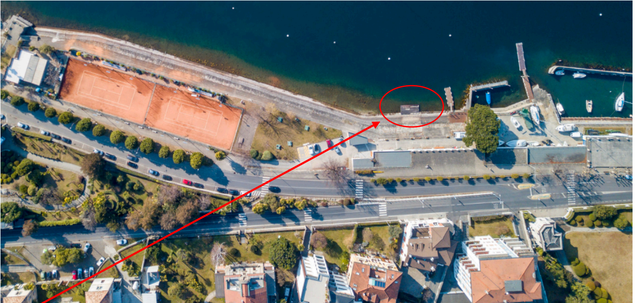
Immagine 3, pontile societario, vista dall'alto