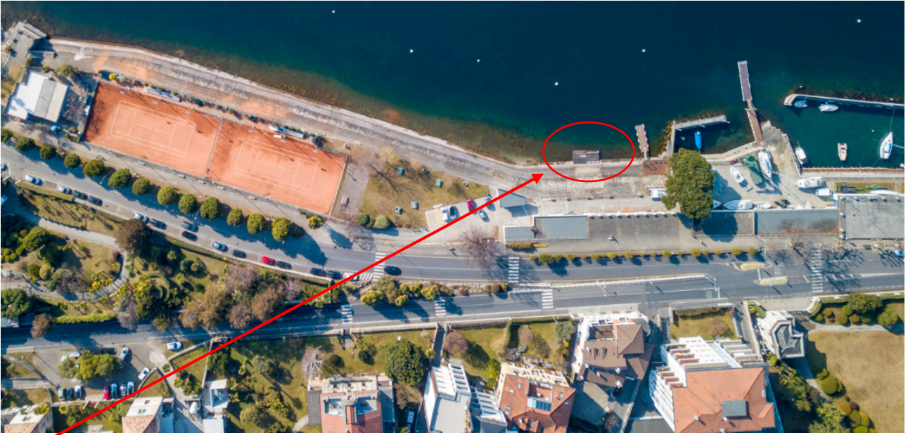
Immagine 3, pontile societario, vista dall'alto