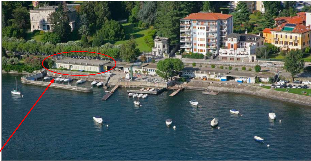
Immagine 1, Sede Sociale Canottieri Pallanza