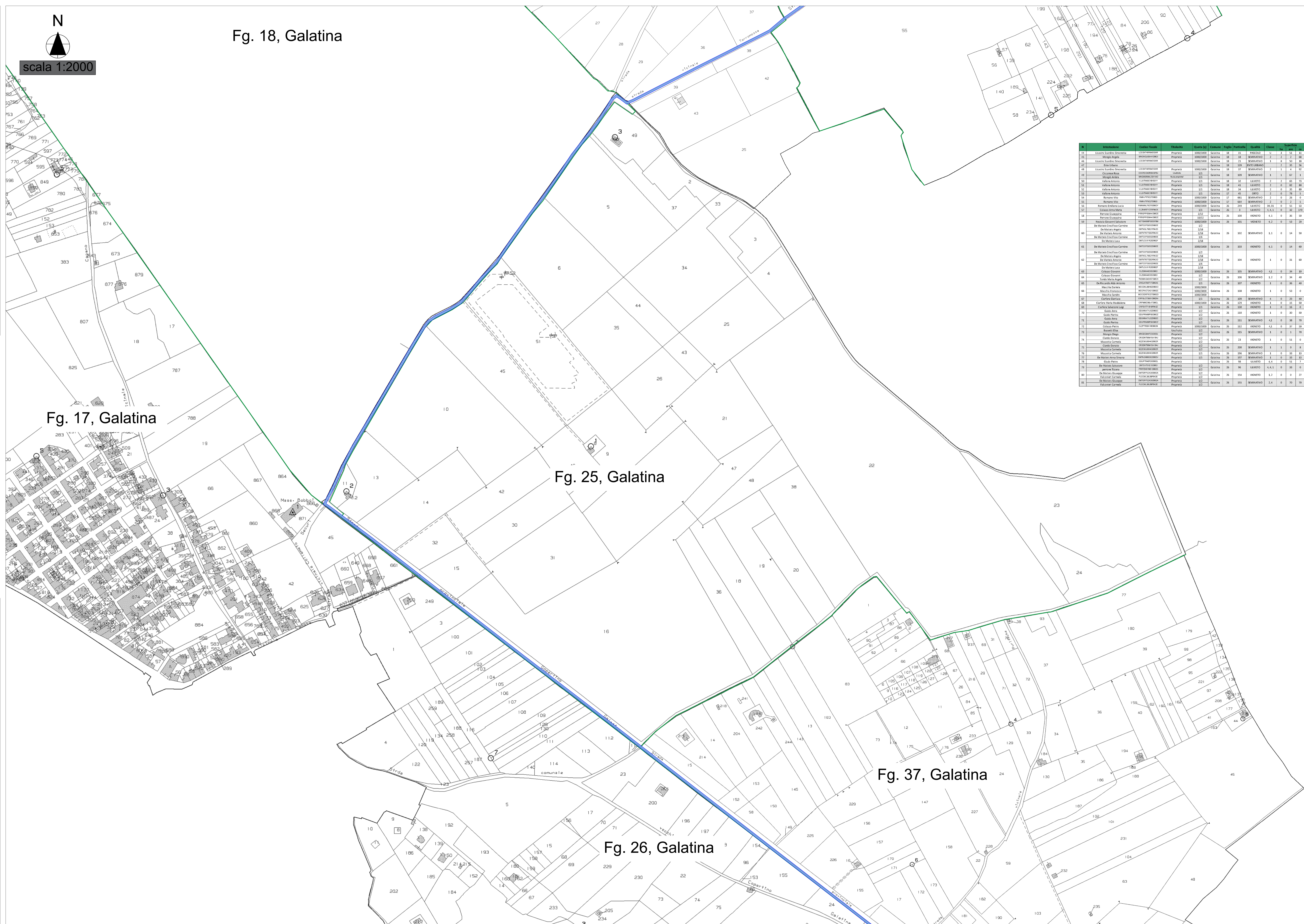
Fig. 18, Galatina