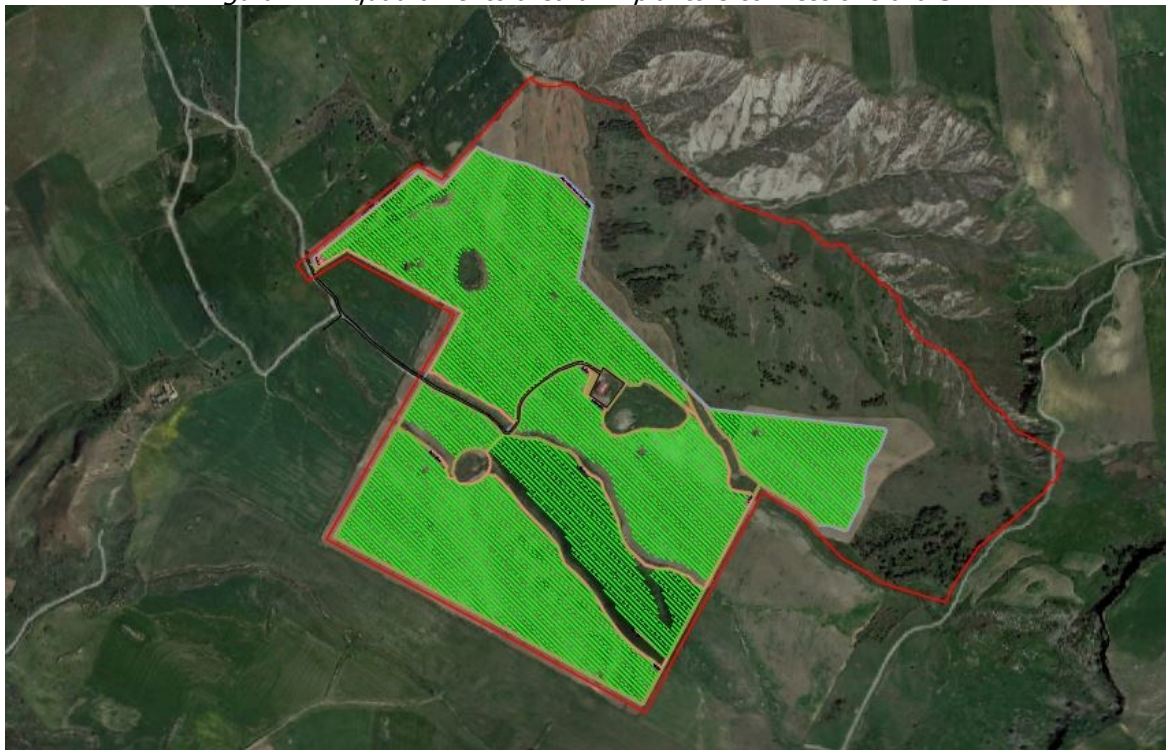
Figura 2 - Layout impianto