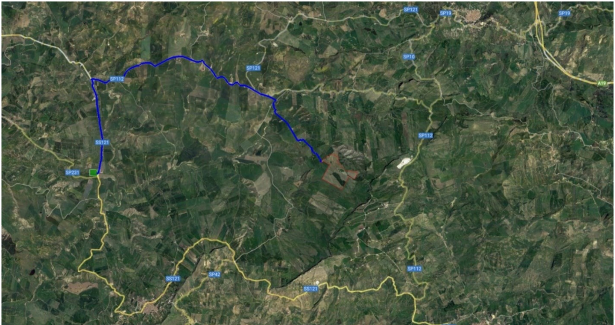
Figura 1 - Inquadramento area di impianto e connessione alla SE

L'impianto in oggetto, allo stato attuale, prevede l'impiego di moduli fotovoltaici con un sistema subverticale fisso a 35° con moduli da 710 Wp bifacciali ed inverter centralizzati. Il dimensionamento ha tenuto conto della superficie utile, della distanza tra le file di moduli, allo scopo di evitare fenomeni di ombreggiamento reciproco, e degli spazi utili per l'installazione delle cabine di conversione e trasformazione oltre che di consegna e ricezione e dei relativi edifici tecnici.