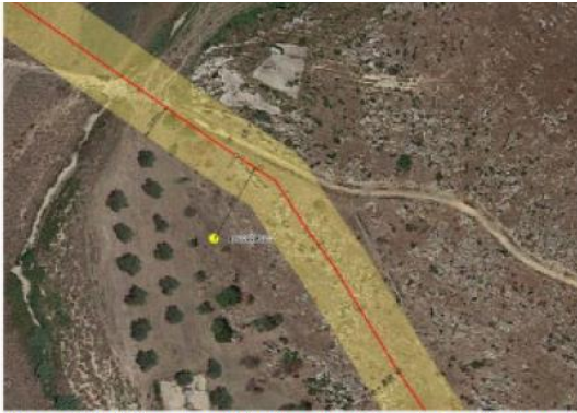
Figura 20: Ubicazione del sito potenzialmente inquinato codice 1910120014, in C.da gli Archi, nel Comune di Mazara del Vallo