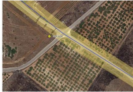
Figura 21: Ubicazione del sito potenzialmente inquinato codice 1910110002, in C.da Bartolotta, nel Comune di Marsala

Con riferimento ai “Siti potenzialmente inquinati della Regione Siciliana” la Commissione, valutata la documentazione presentata dal Proponente e all’esito delle verifiche eseguite nell’ambito del procedimento in esame, ritiene che in fase di Progettazione Esecutiva il proponente, ai sensi dell’art. 242-ter del D.Lgs. 3 aprile 2006, n. 152, dovrà definire le eventuali interazioni delle attività di cantiere con i due siti individuati e dettagliare le modalità di interazione con le matrici potenzialmente contaminate nelle due aree; prevedere modalità e tecniche che “non pregiudichino né interferiscano con l’esecuzione e il completamento della bonifica, né determinino rischi per la salute dei lavoratori e degli altri fruitori dell’area”; attivare la procedura prevista per la caratterizzazione e la gestione dei terreni movimentati, nel rispetto di quanto indicato dal comma 4 dell’art. 242-ter del D.Lgs. 3 aprile 2006, n. 152 e s.m.i. come indicato nella Condizione Ambientale n. 4”.