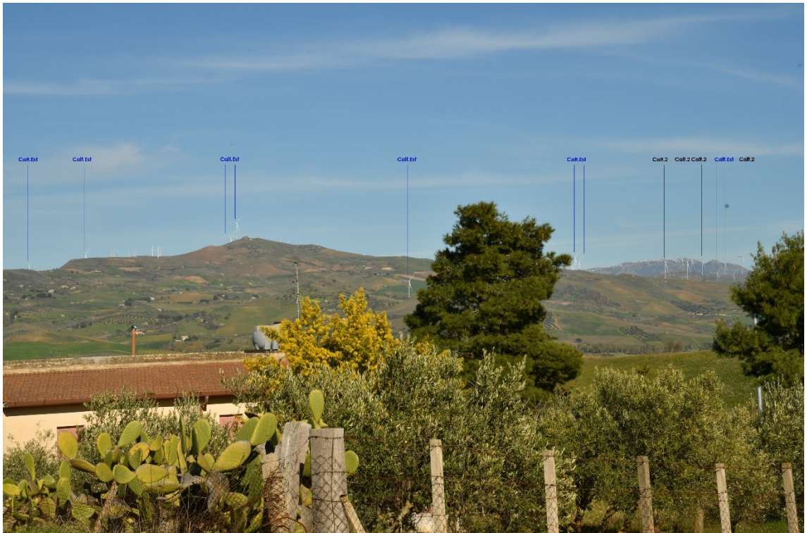
Figura 2-12: Dal Comune di Vallelunga Pratameno, SS121 - Post-operam