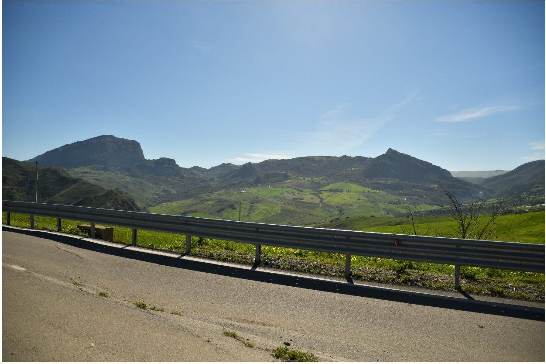
Figura 2-1: Dal Comune di Sclafani Bagni, SS120 - Ante-operam