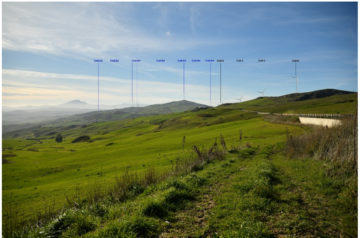
Figura 2-10: Dal Comune di Caltavuturo, SP64 - Post-operam