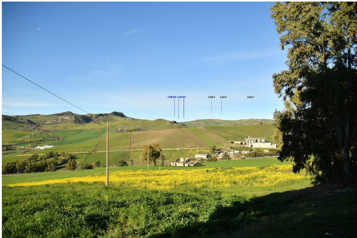
Figura 2-8: Dal Comune di Polizzi Generosa, SS120 - Post-operam