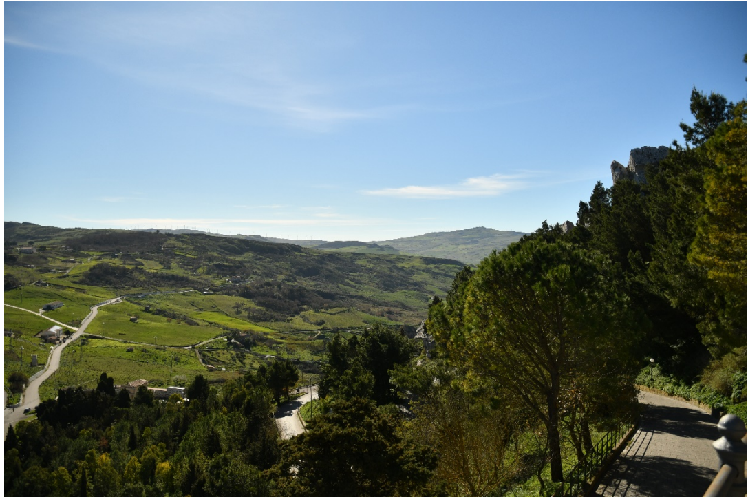
Figura 2-3: Dal Comune di Sclafani Bagni (Centro) - Ante-operam