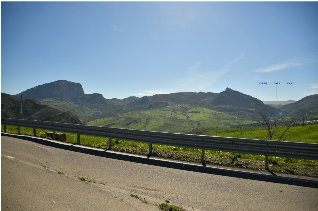
Figura 2-2: Dal Comune di Sclafani Bagni, SS120 - Post-operam