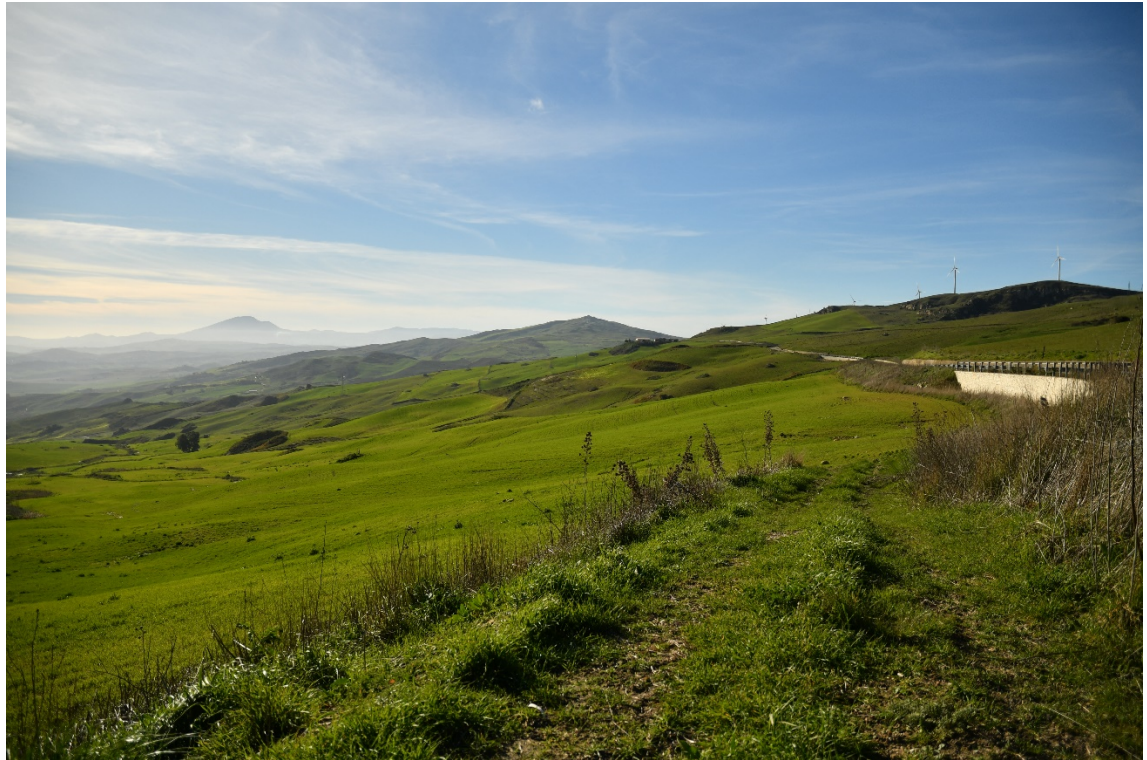
Figura 2-9: Dal Comune di Caltavuturo, SP64 - Ante-operam