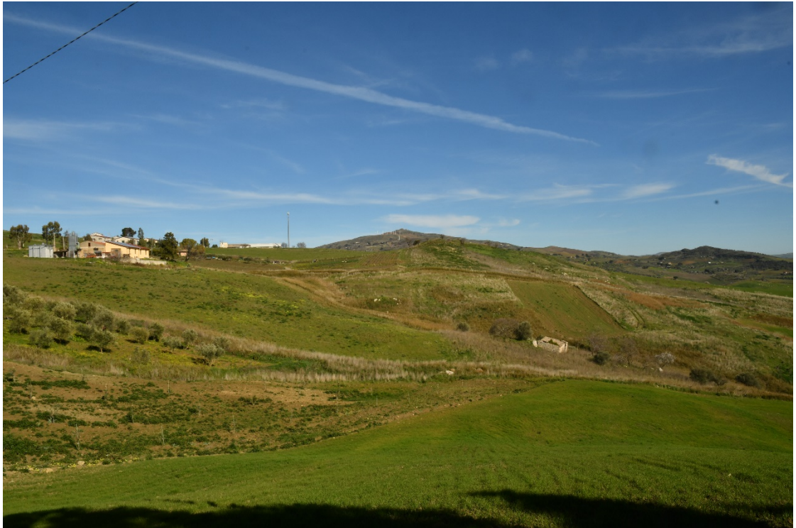
Figura 2-13: Dal Comune di Vallelunga Pratameno, SP8 - Ante-operam