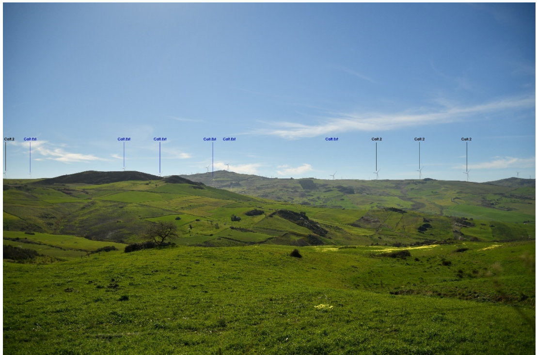
Figura 2-18: Dal Comune di Sclafani Bagni, SP56 - Post-operam