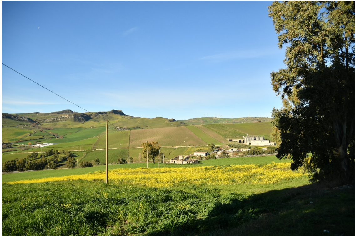
Figura 2-7: Dal Comune di Polizzi Generosa, SS120 - Ante-operam