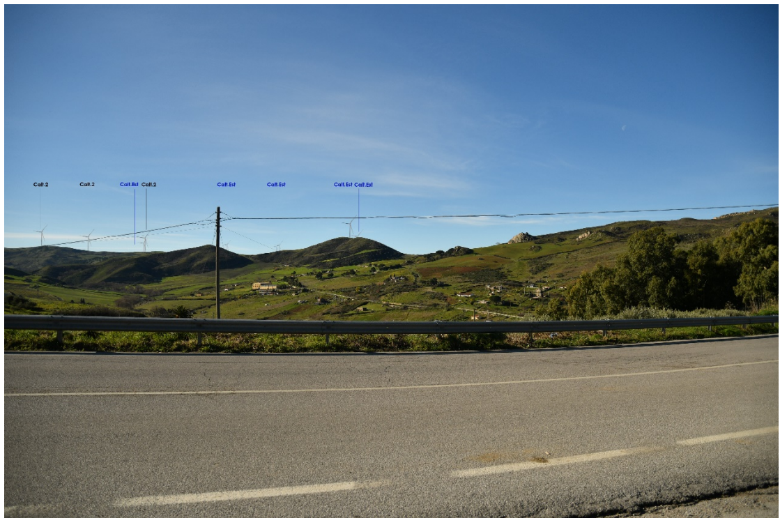
Figura 2-6: Dal Comune di Caltavuturo, SS120 - Post-operam