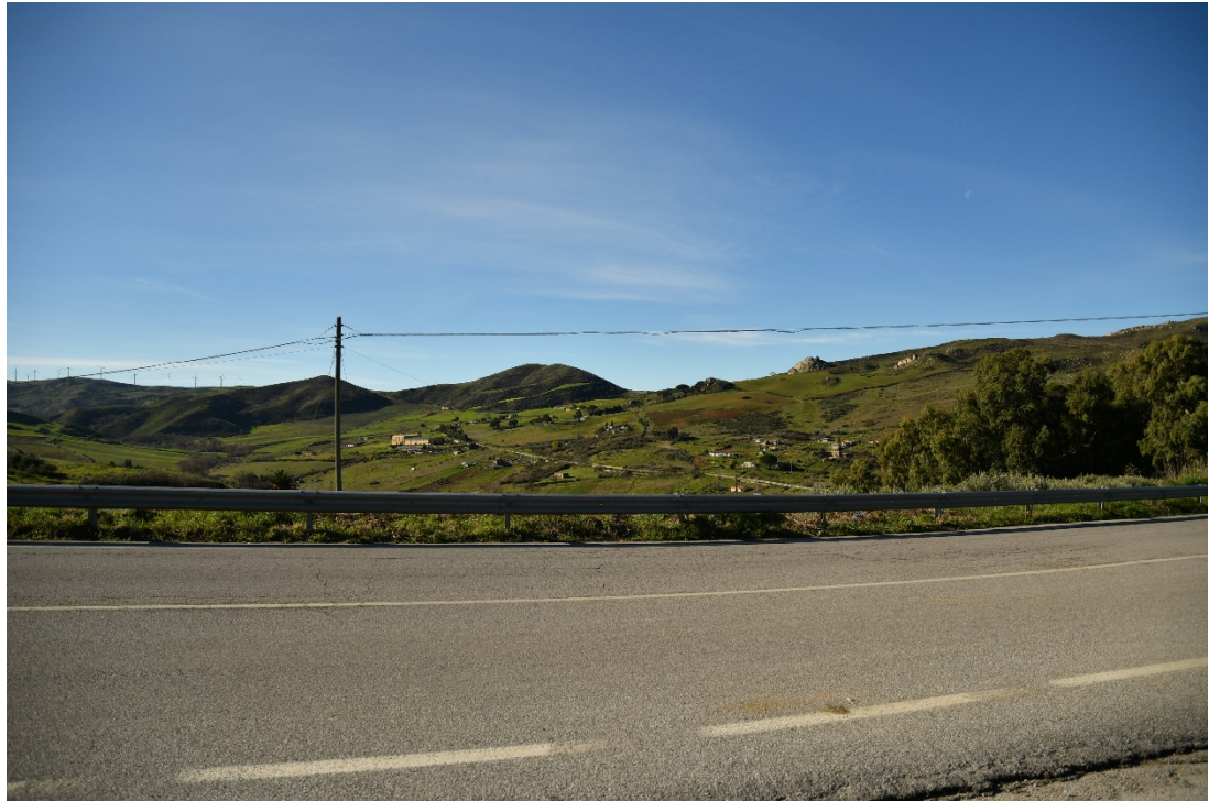
Figura 2-5: Dal Comune di Caltavuturo, SS120 - Ante-operam