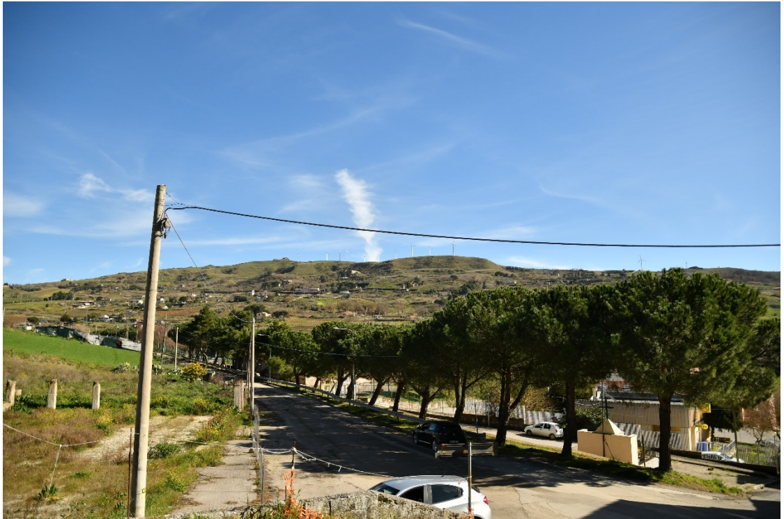
Figura 2-15: Dal Comune di Valledolmo (Centro) - Ante-operam