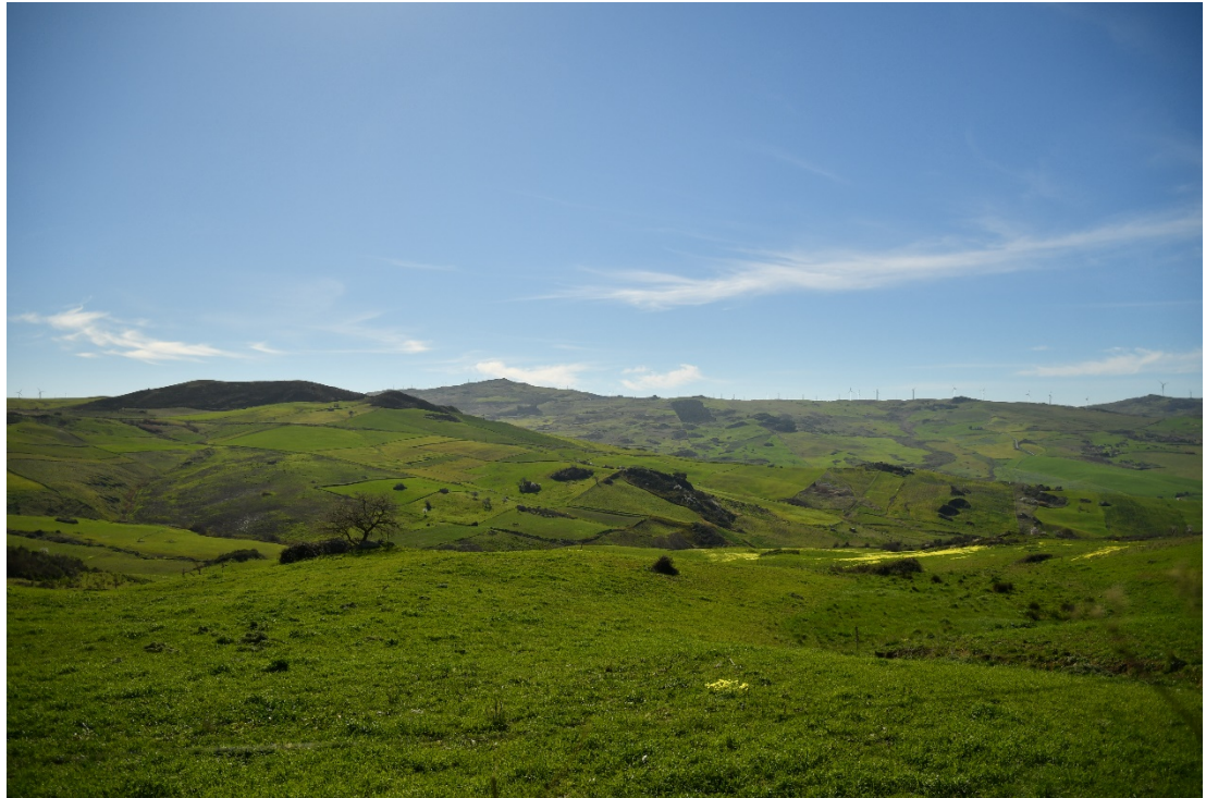
Figura 2-17: Dal Comune di Sclafani Bagni, SP56 - Ante-operam