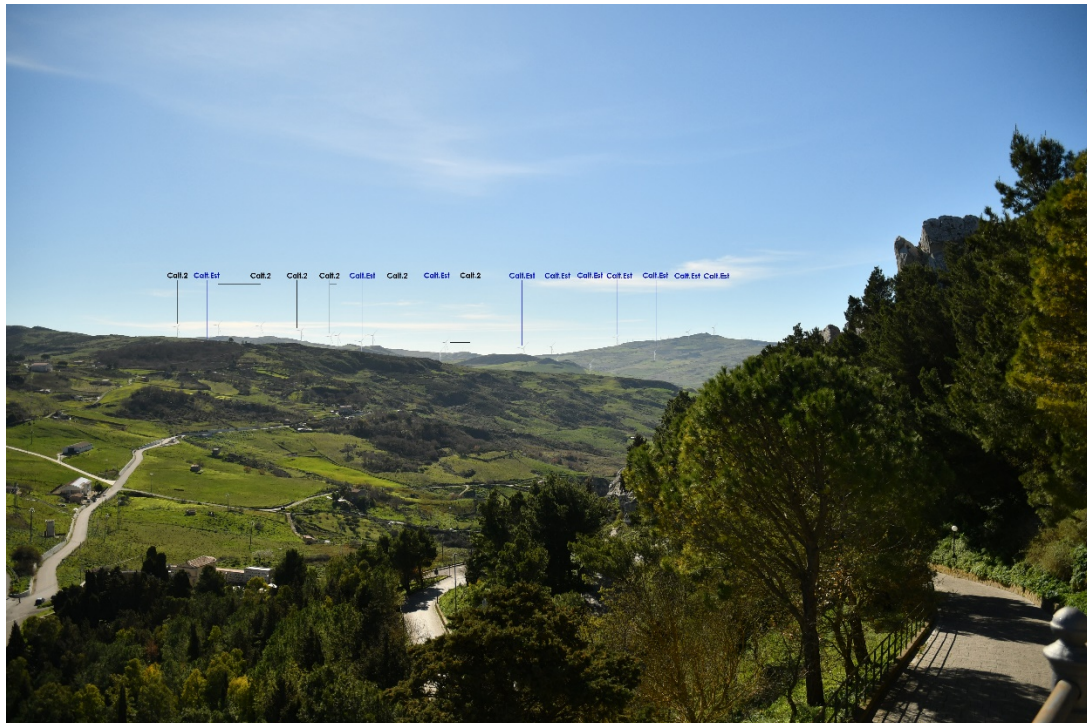
Figura 2-4: Dal Comune di Sclafani Bagni (Centro) - Post-operam