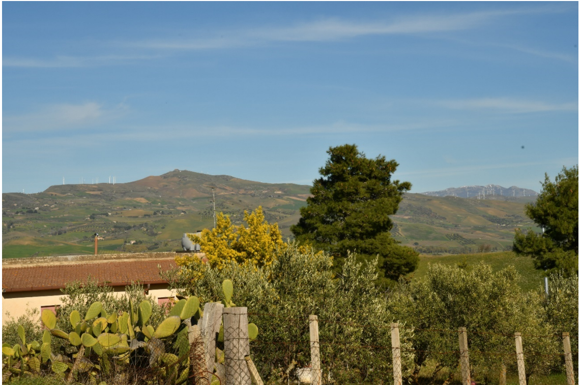
Figura 2-11: Dal Comune di Vallelunga Pratameno, SS121 - Ante-operam